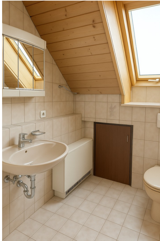
oben Bad mit Dusche und WC