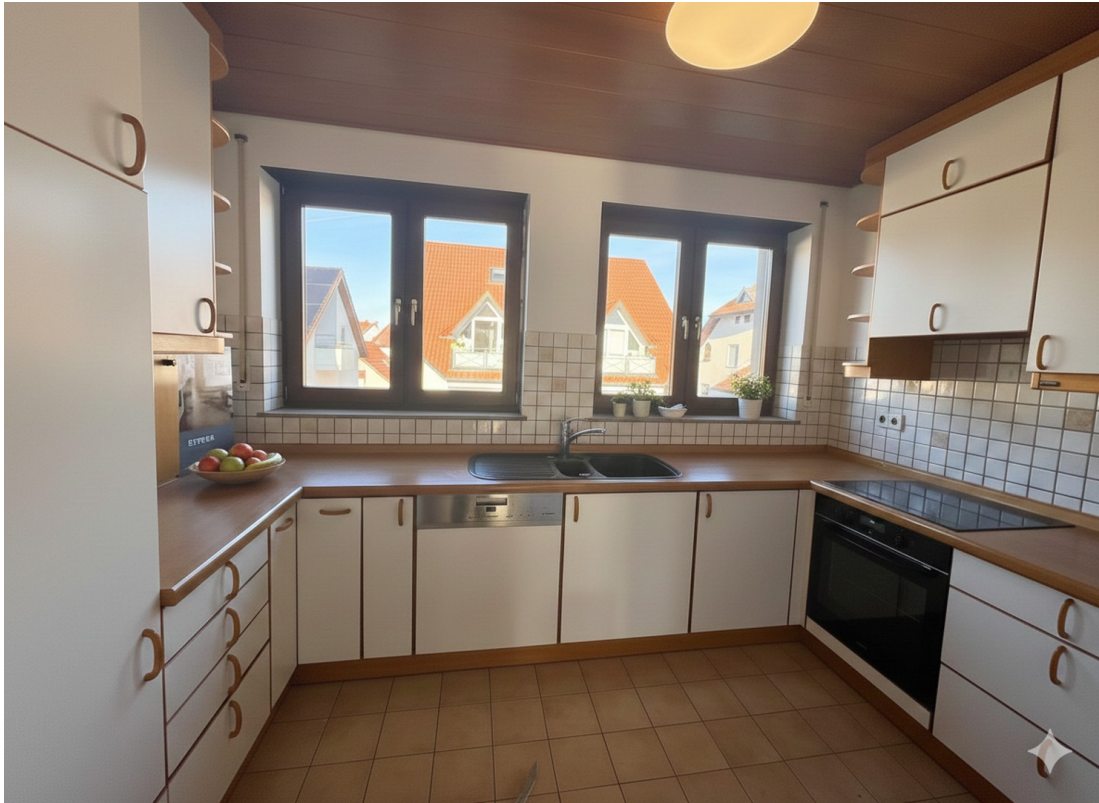
Einbauküche mit Markengeräten