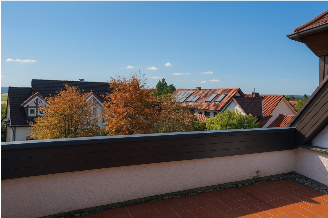
Dachterrasse nach Süden