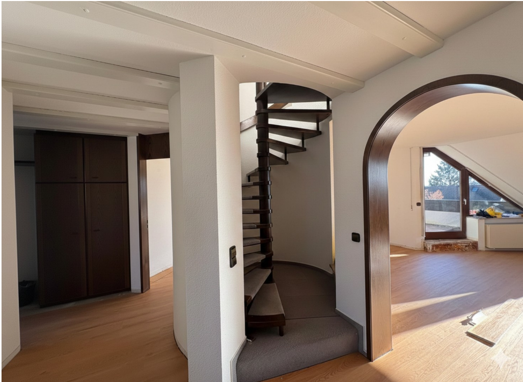
Flur und Wendeltreppe