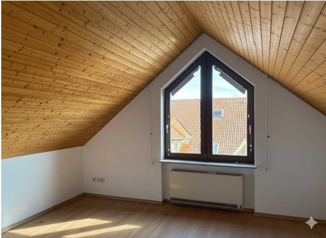
oben Zimmer 1