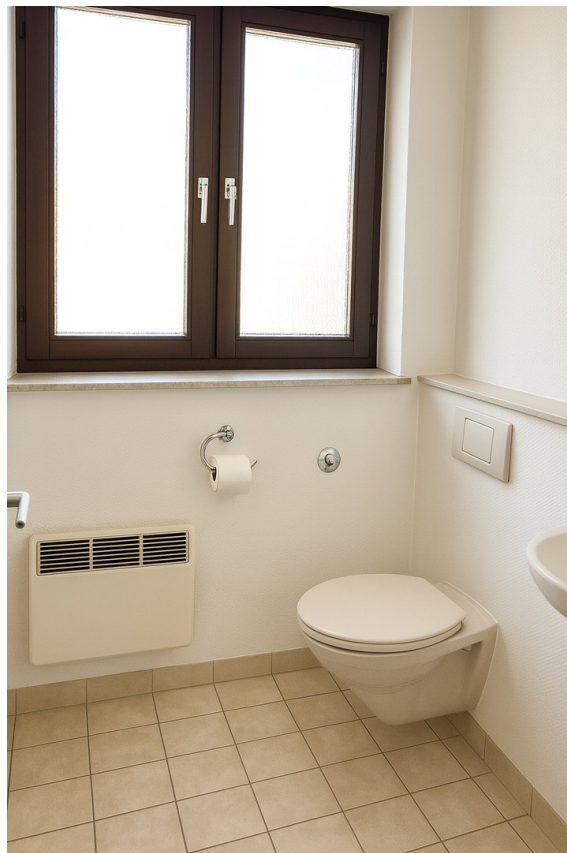
unten Gäste WC