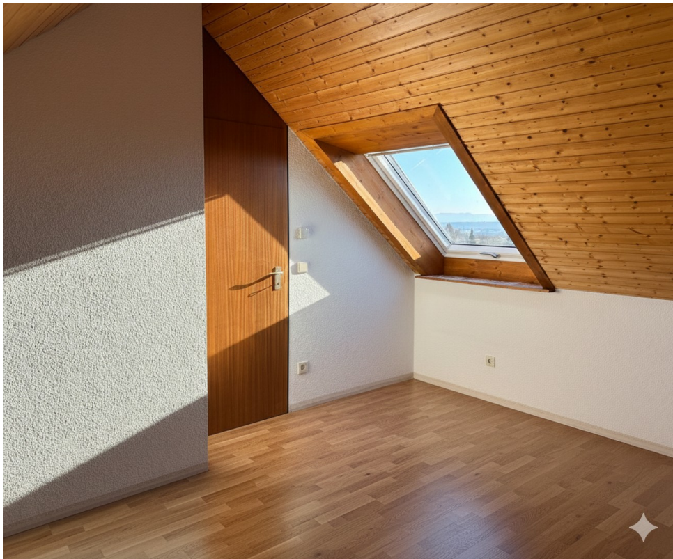
oben Zimmer 2