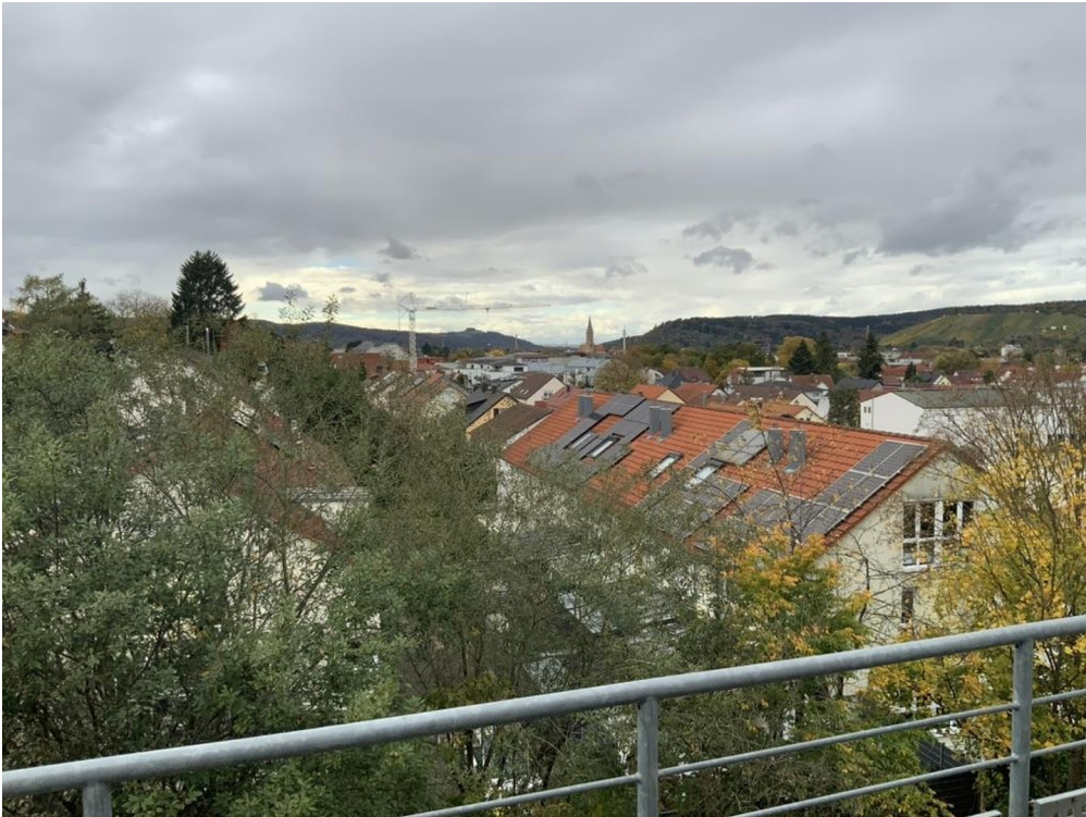
Balkon Süd West