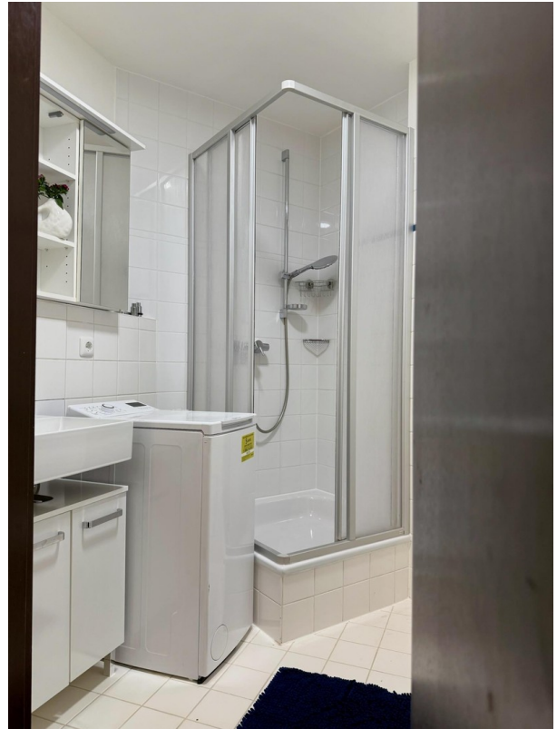
Bad inkl. Toploader