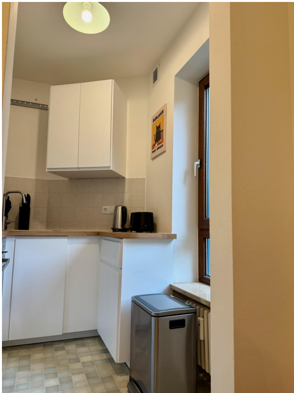
Neue Küche (voll-ausgestattet)