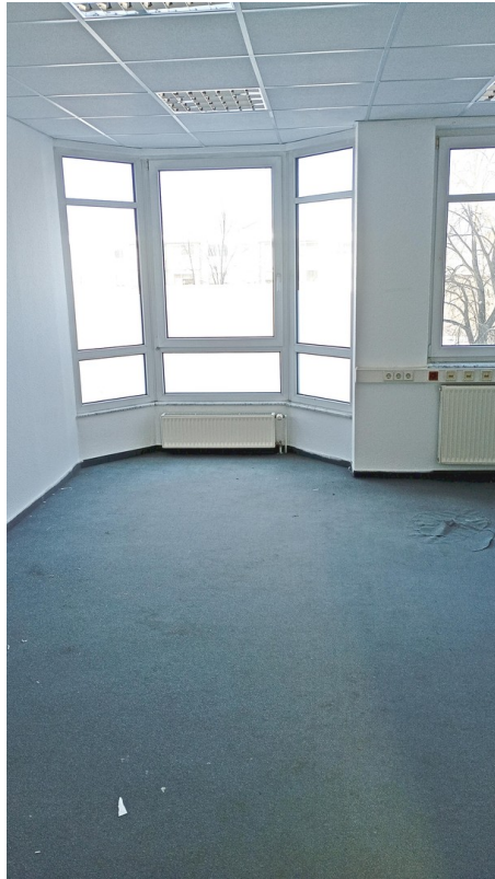
Zimmer 2 - Erkerzimmer