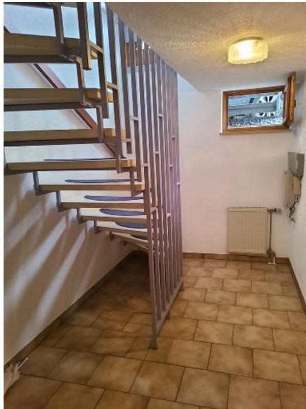
Treppe zum Keller