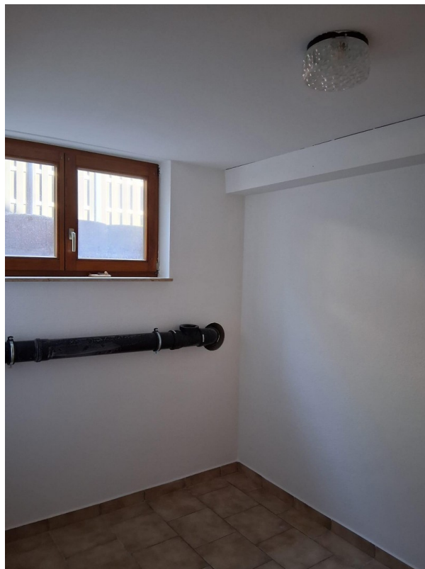
Kellerraum Whg. OG