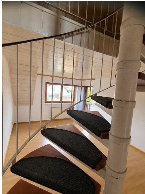
Treppe zum DG