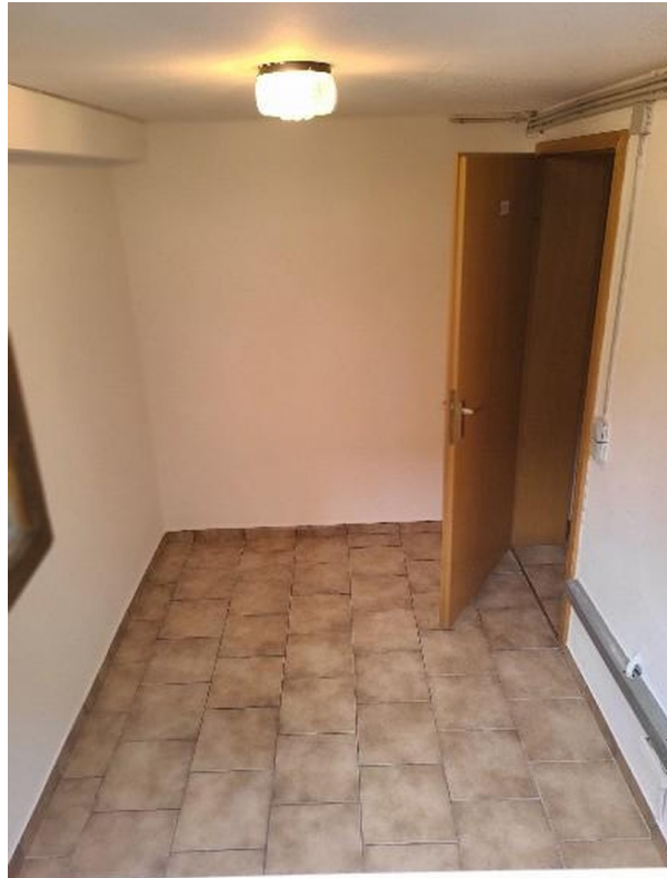
Kellerraum Whg. OG