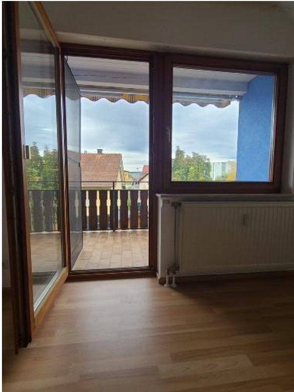
Schlafzimmer - Zugang Balkon