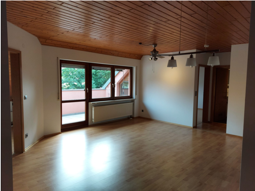
Wohnzimmer / Balkon