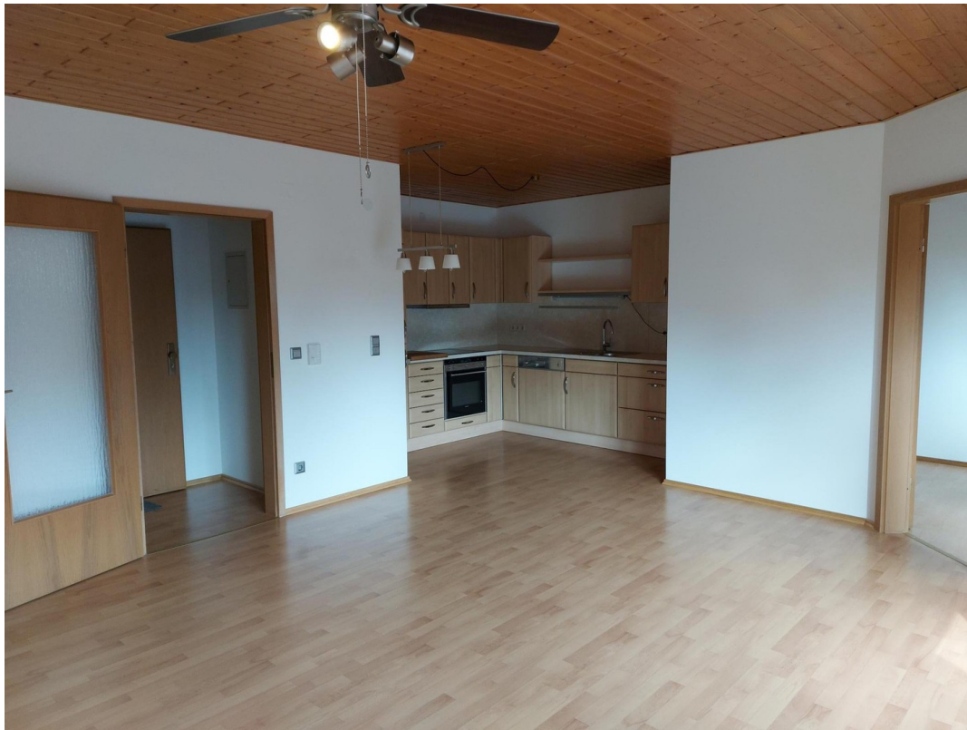
Wohnzimmer / Küche