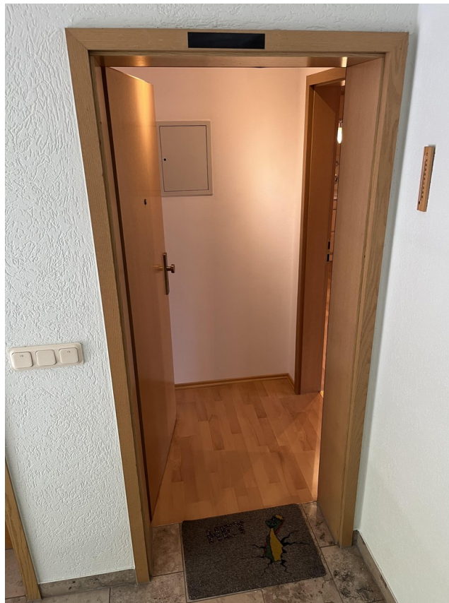
Haustür / Treppenhaus