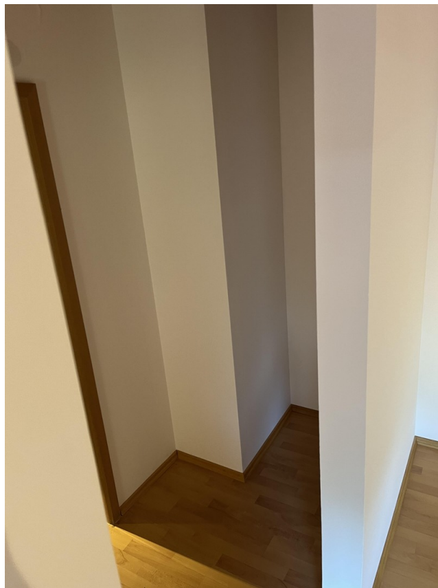
Wohnzimmer / Vorrats-Nische