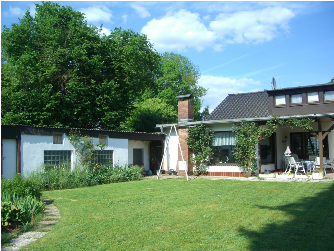
Nordwestseite mit Annexbau