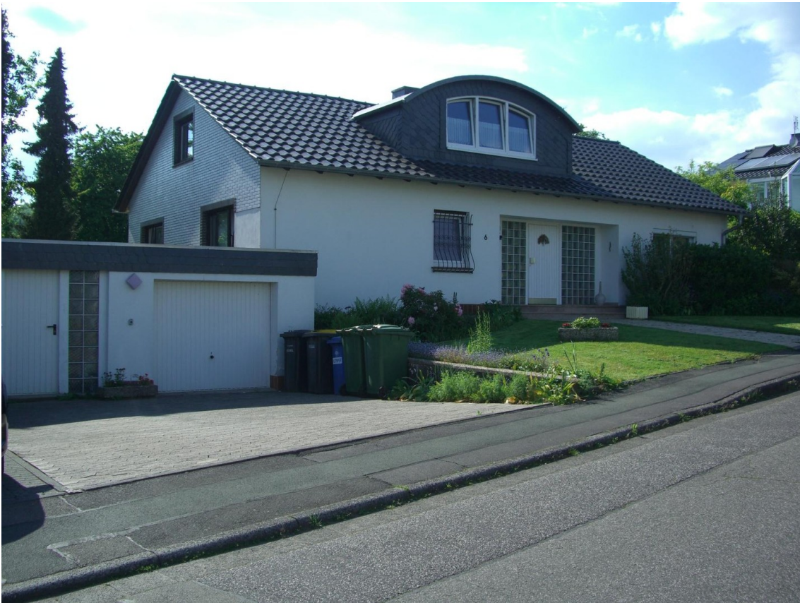
Front Anwesen von Osten aus