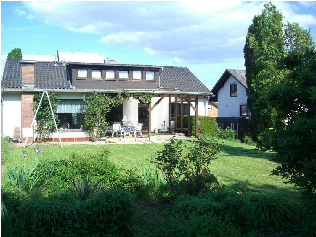
Südwestblick auf Terrasse/Haus