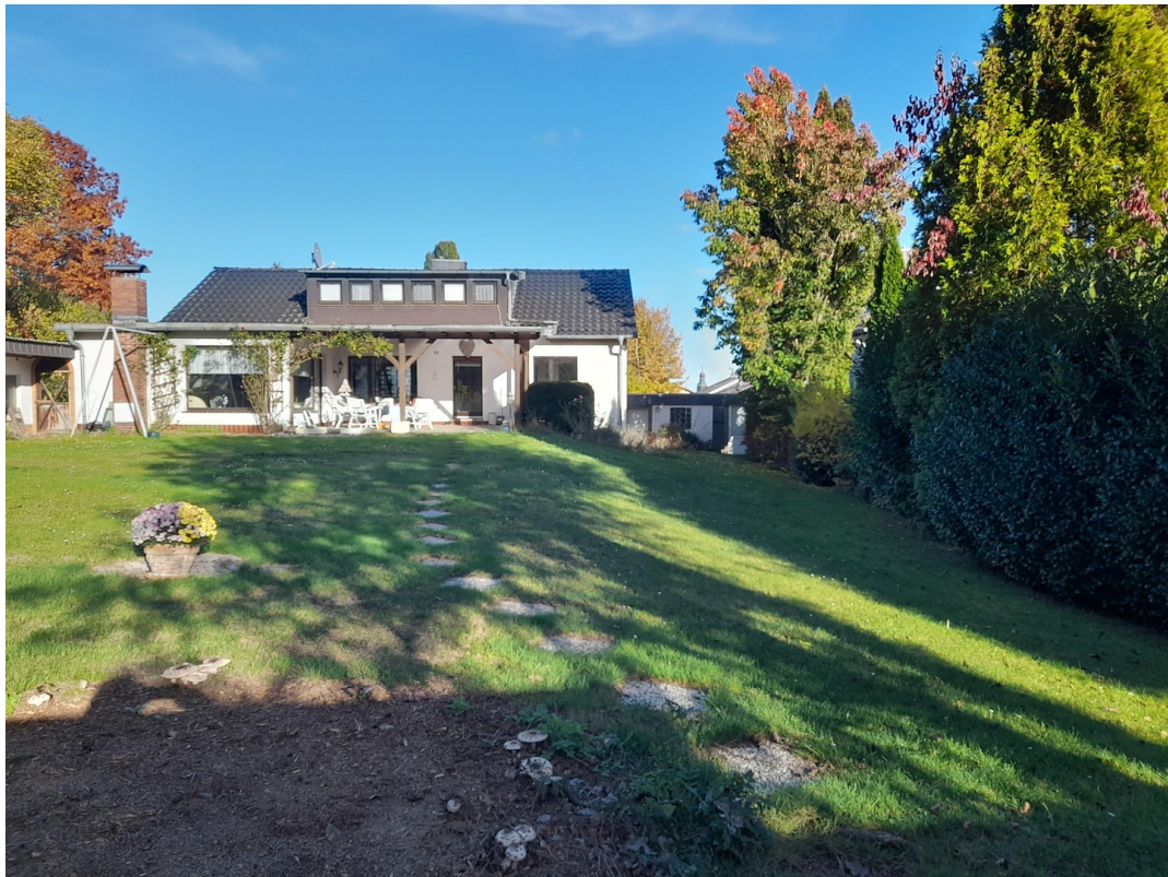
Südwestblick aufs Haus