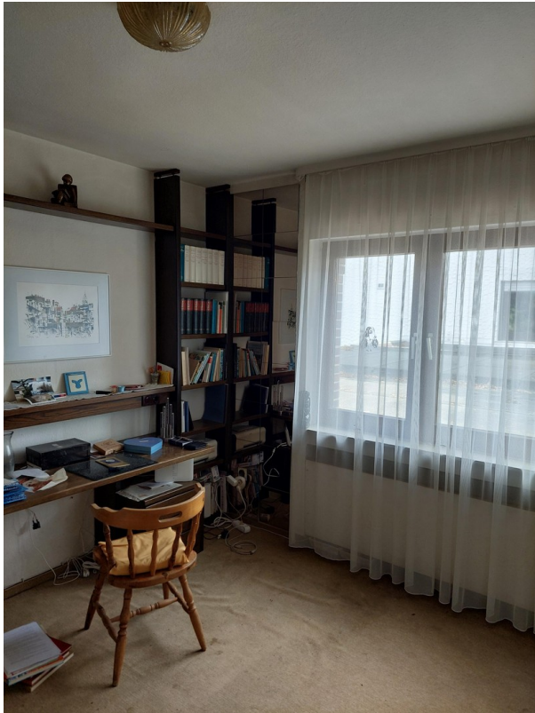
Arbeits-/Kinderzi. 1 EG