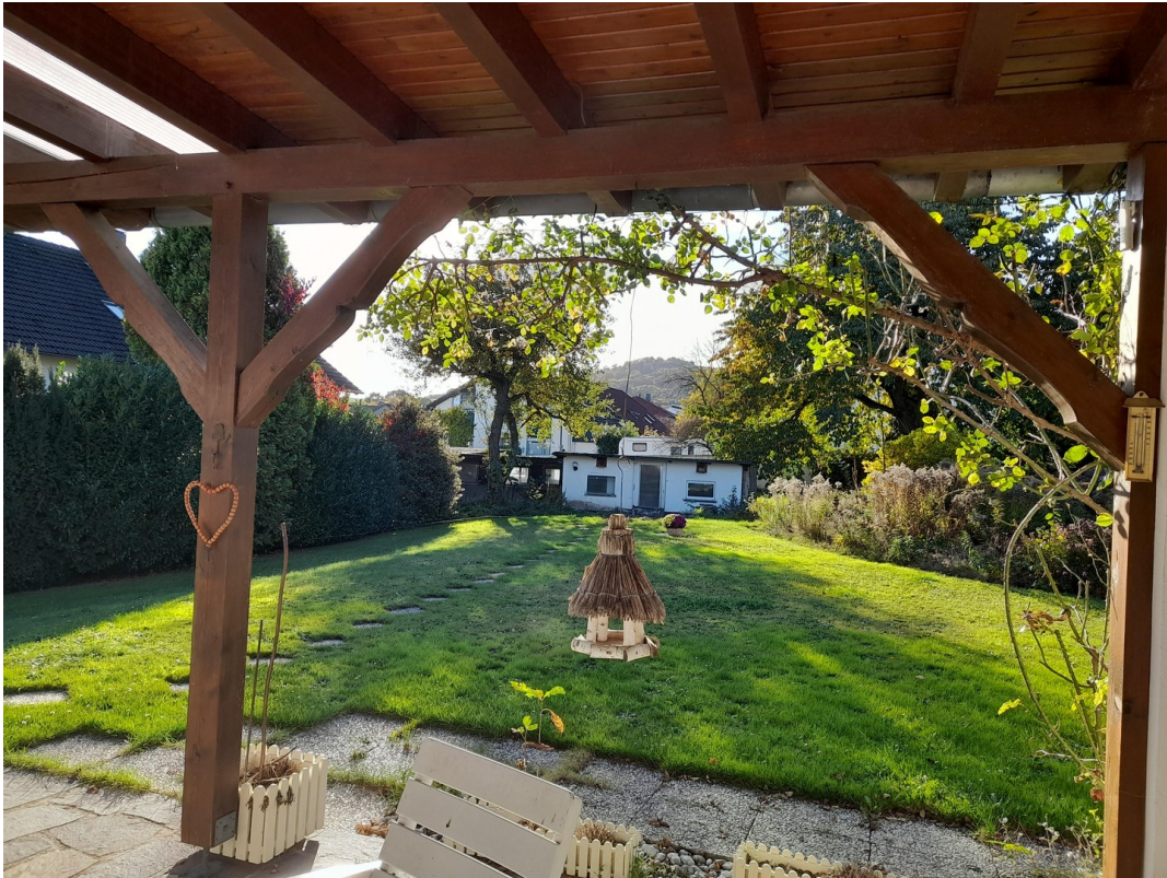
Garten mit Annexbau 2