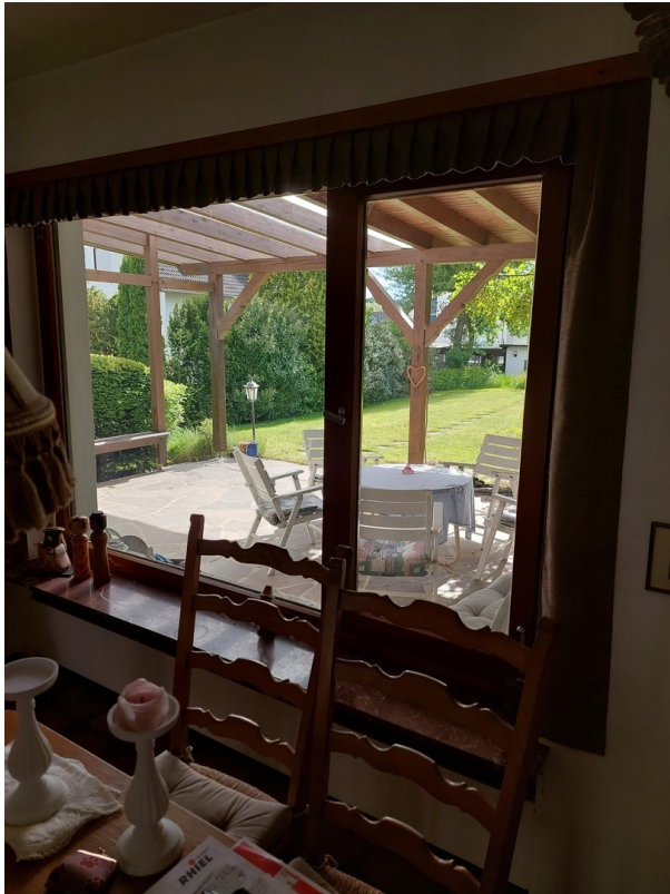
Blick von Diele in Garten