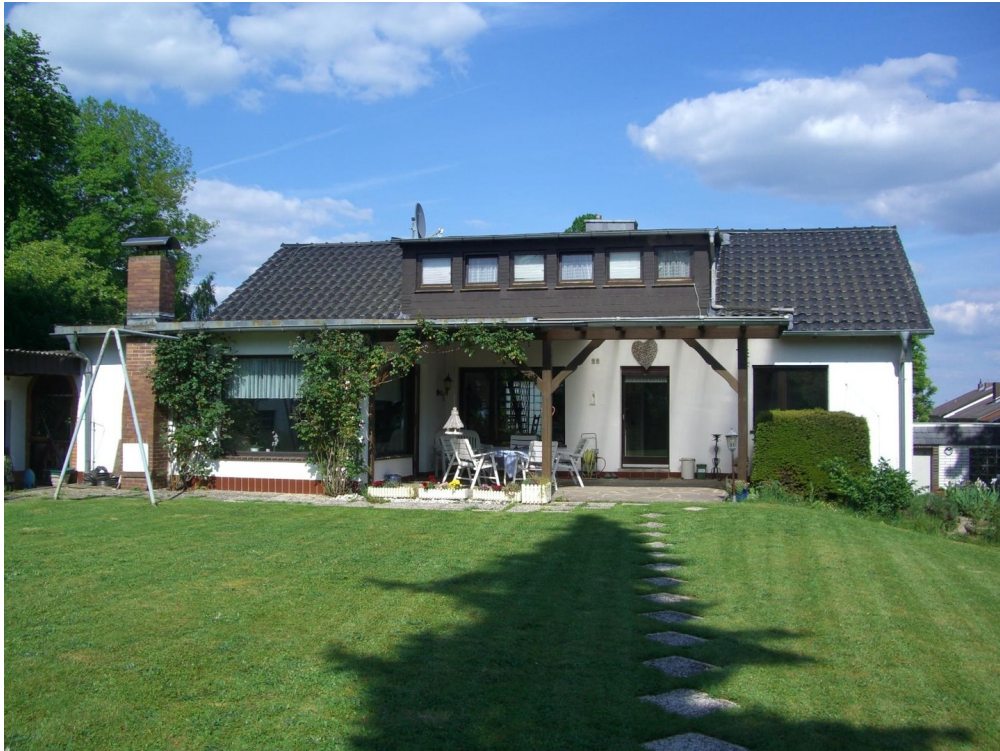
Südwestblick auf das Anwesen