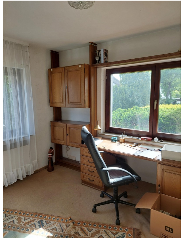
Arbeits-/Kinderzi. 2 EG