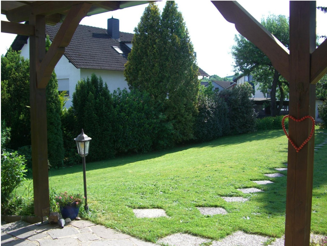
Südblick von Terrasse