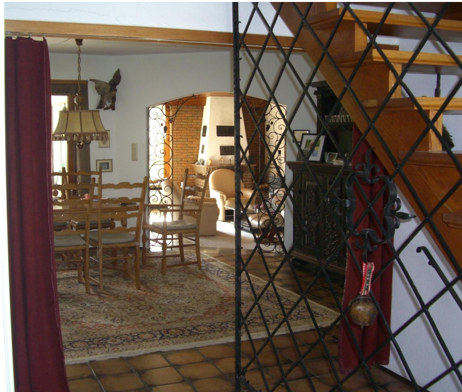
Blick Eingang in Diele/WoZi EG