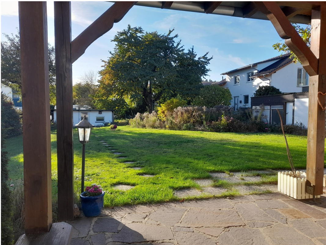
Blick Richtung Westen