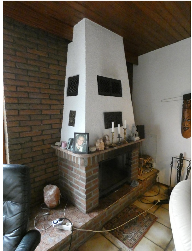
Kamin WoZi EG