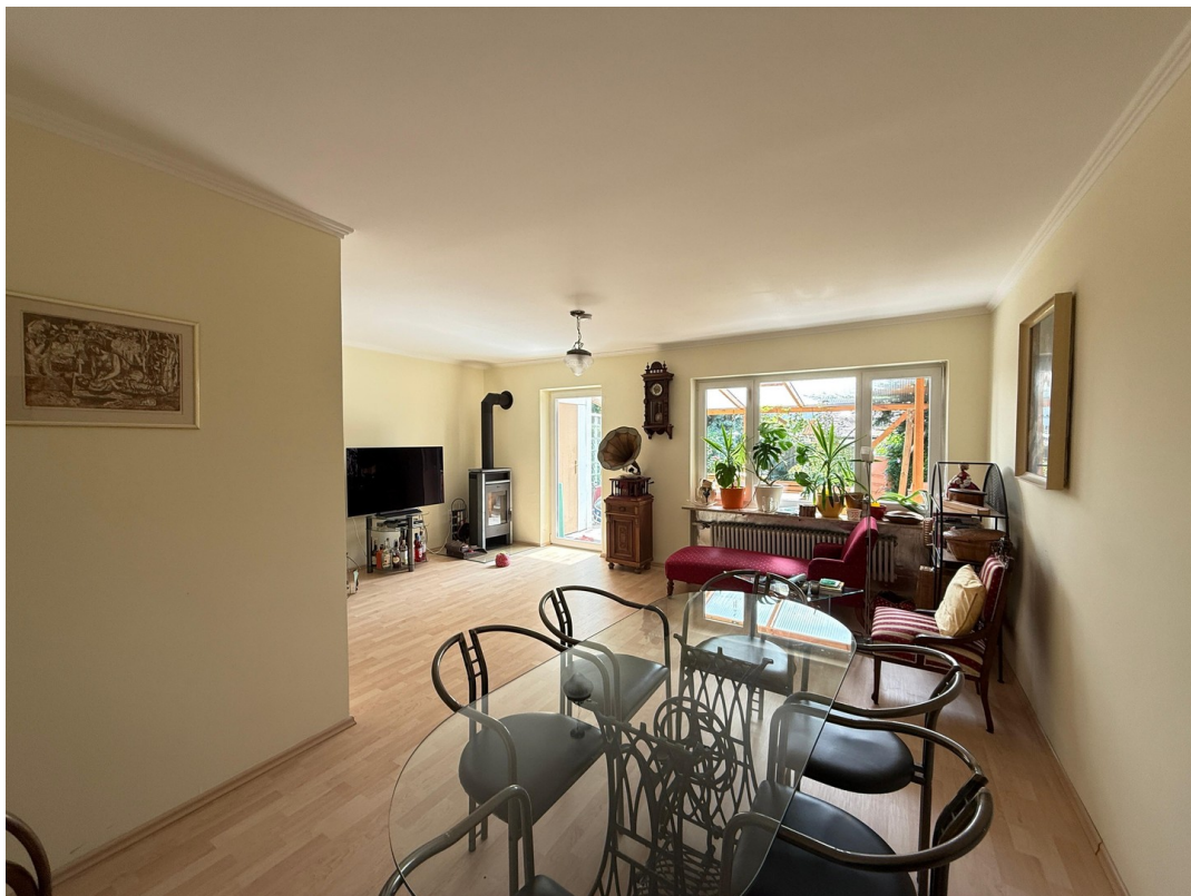
Wohnzimmer mit Specksteinofen