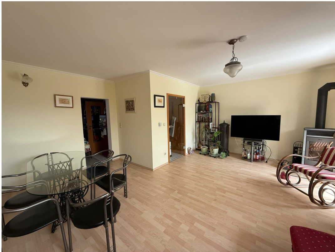
Wohnzimmer mit Specksteinofen