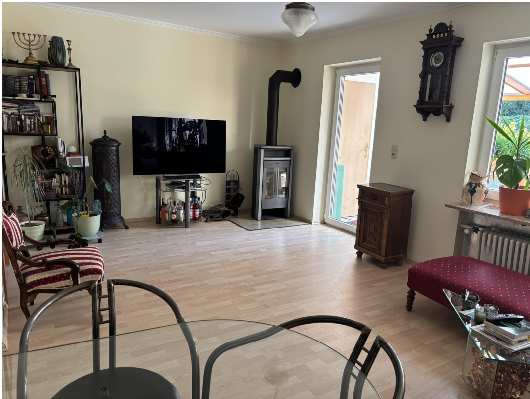
Wohnzimmer mit Specksteinofen