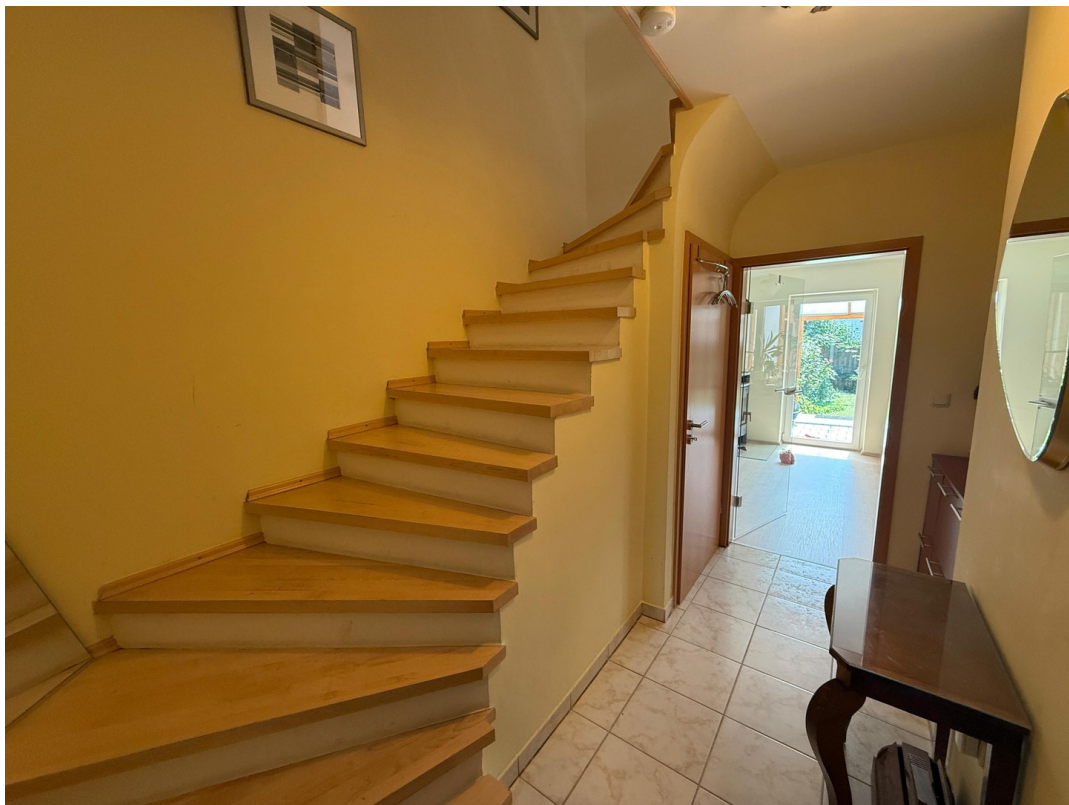
Treppe EG - OG