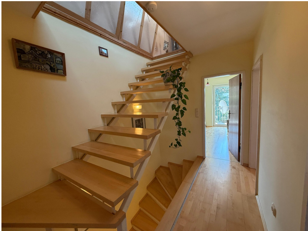
Treppe OG - DG