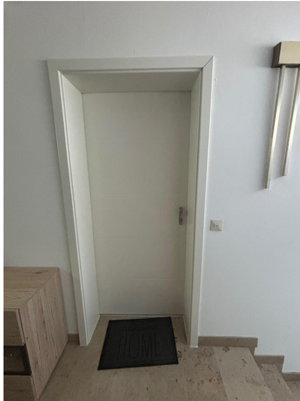
Hausflur / Haustür