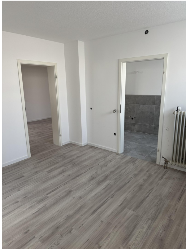
Schlafzimmer mit Bad Zugang