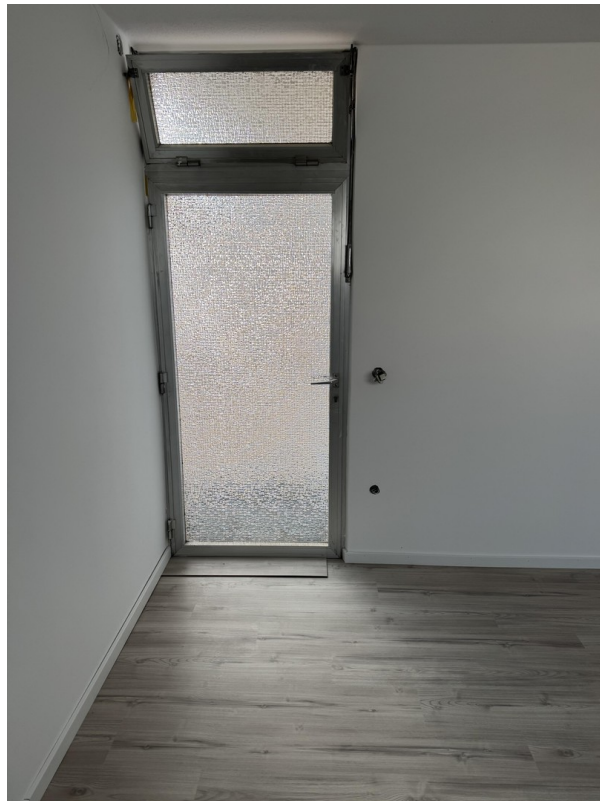
Zugang Terrasse Schlafzimmer