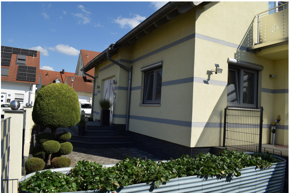
Haus / Gartenblick