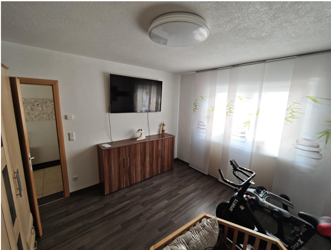
Büro/ Schlafzimmer Erdgeschoss