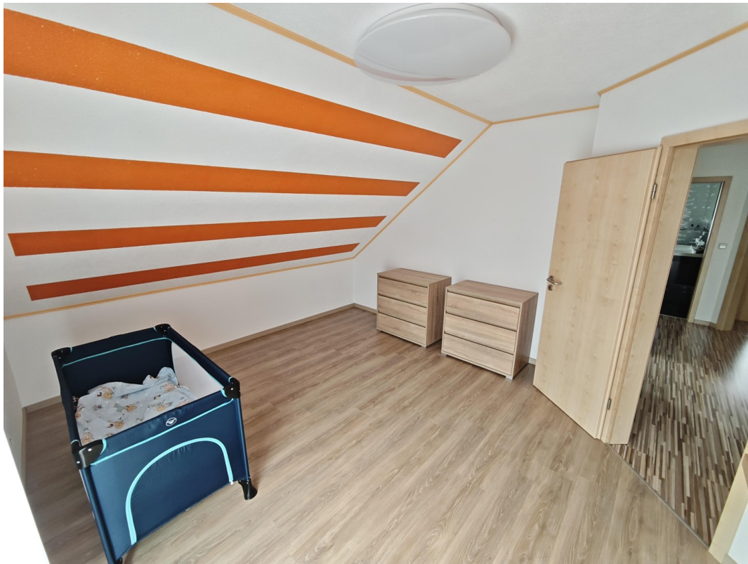
Kinderzimmer -1 Obergeschoss