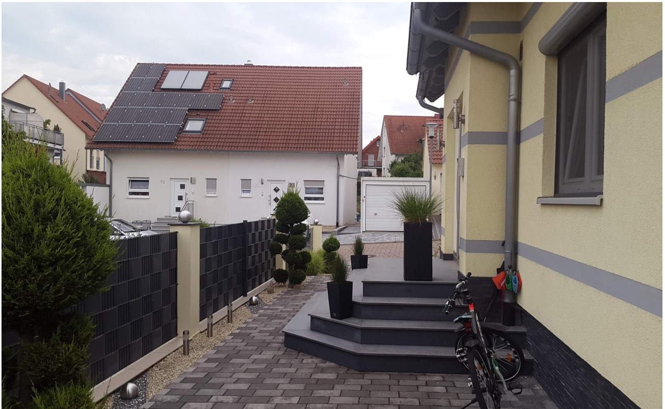
Haus/ Eingang Bereich