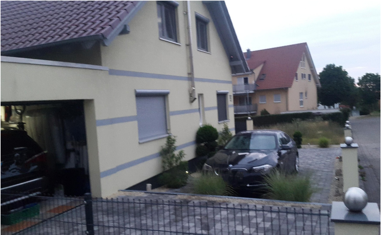
Haus/ Einfahrt Bereich