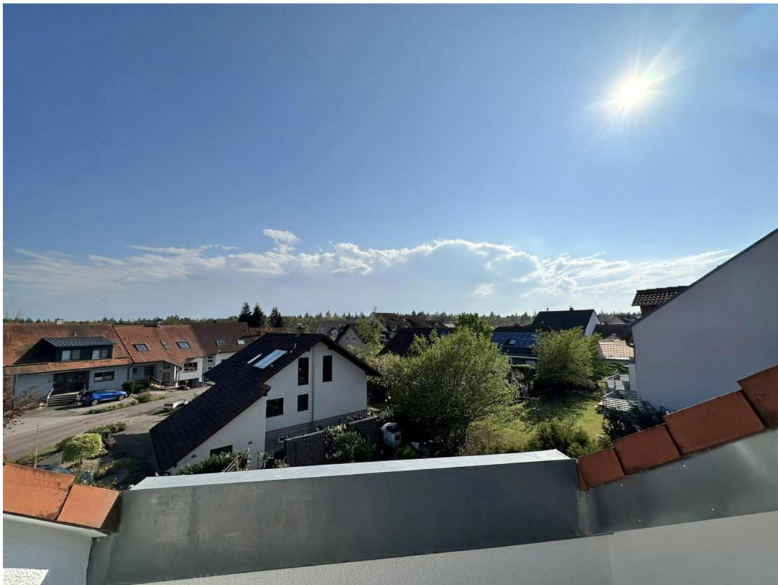
Blick von der Dachterrasse