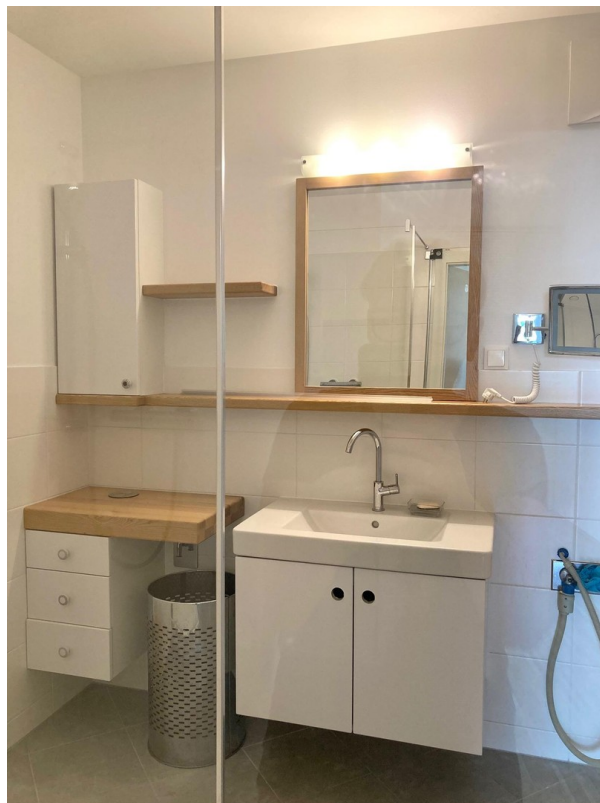
Bad, incl. mass-gefertigte Möb