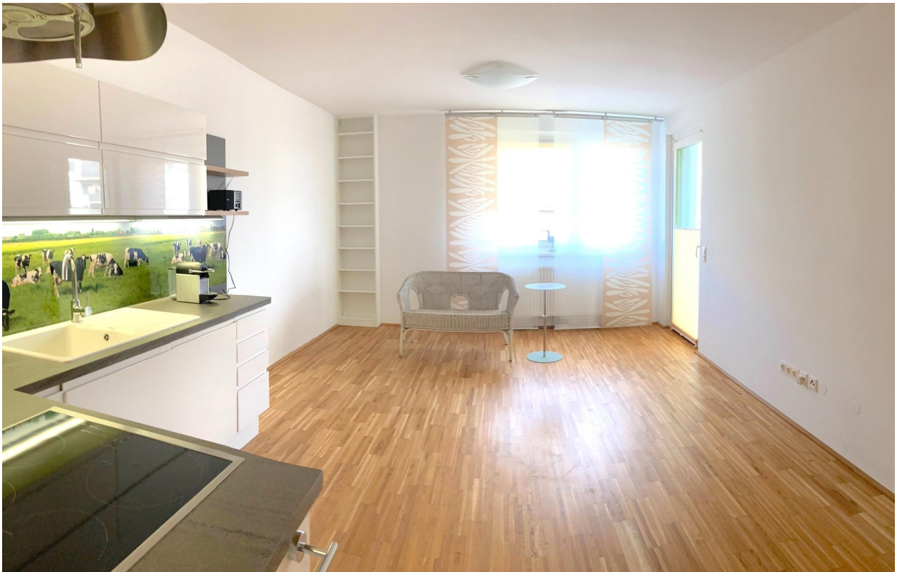
Küche - Wohnzimmer