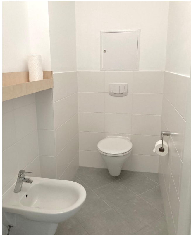
WC & Bidet