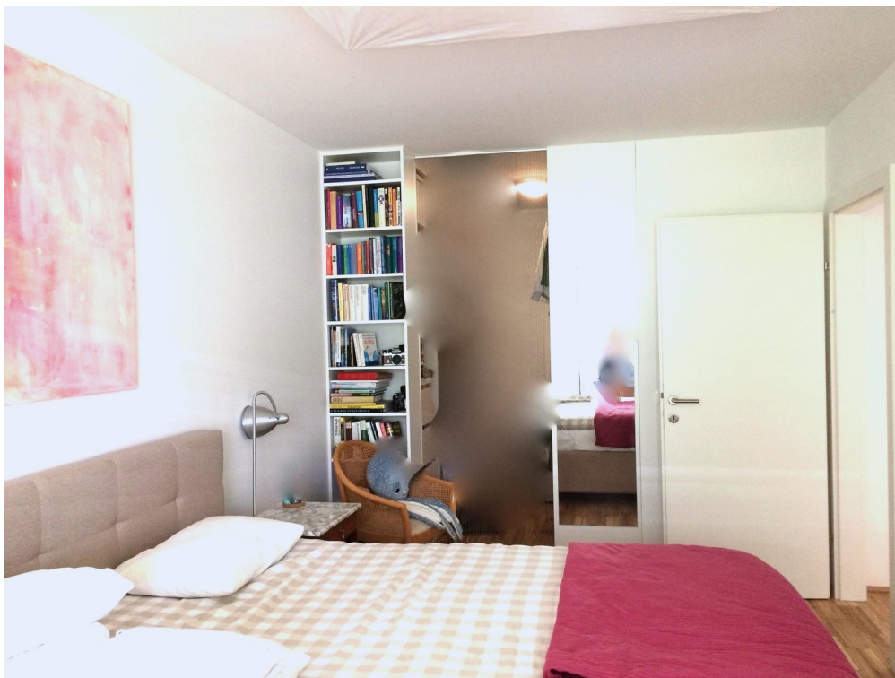
SZ1 & Garderobe Einrichtungsbeispiel