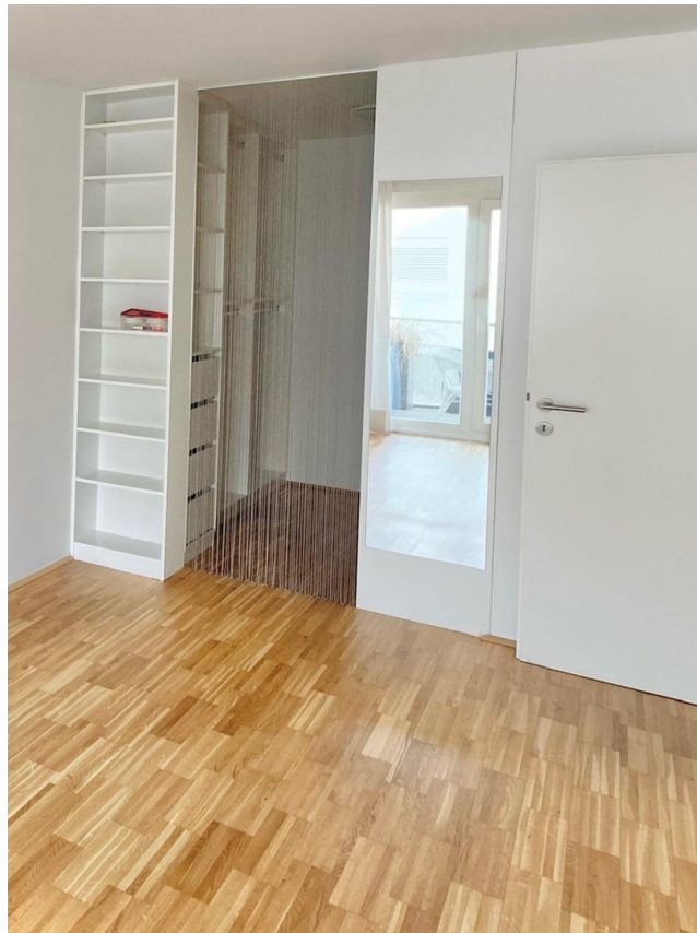
begehbare Garderobe SZ1