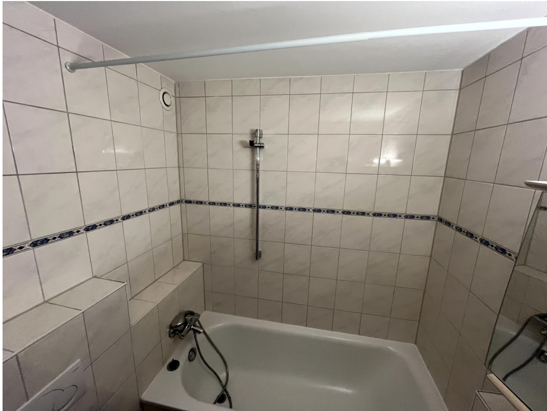
Bad und WC