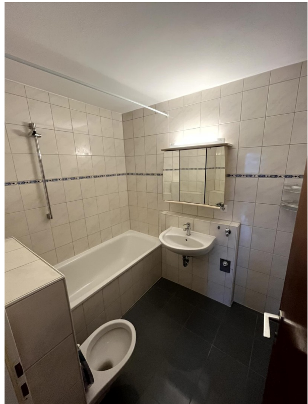
Bad und WC