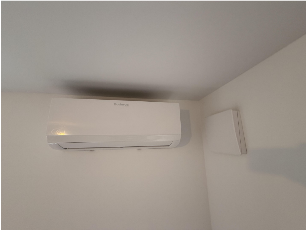
Klimaanlage und Lüftung