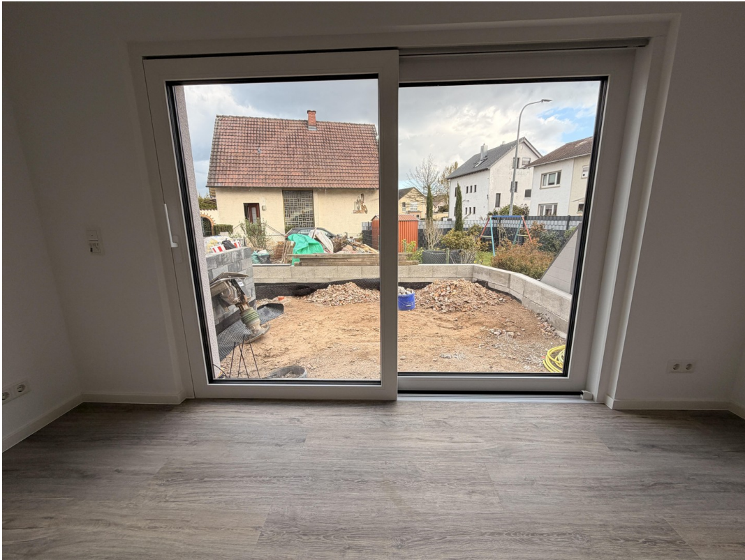
Wohnzimmer m. Blick Terrasse