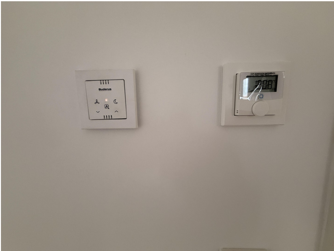
Lüfter und Temperaturregelung