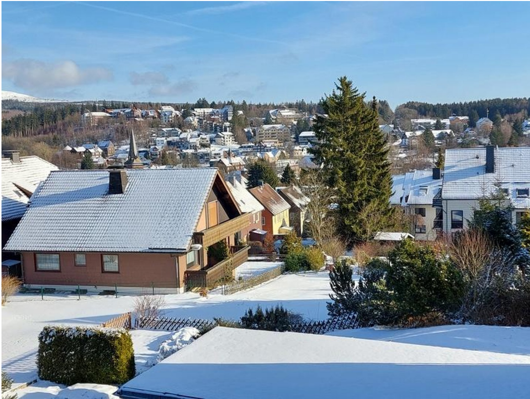
Zu jeder Jahreszeit schön