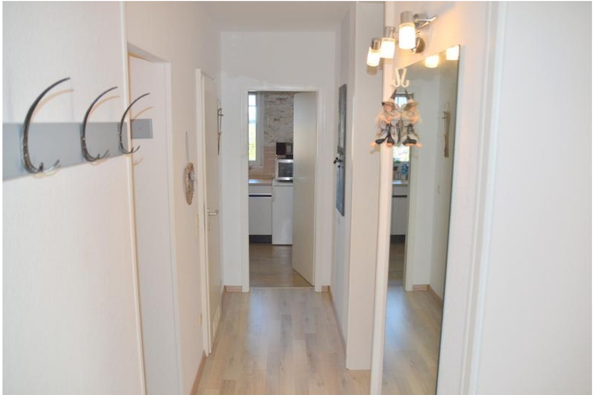
Flur mit Abstellraum