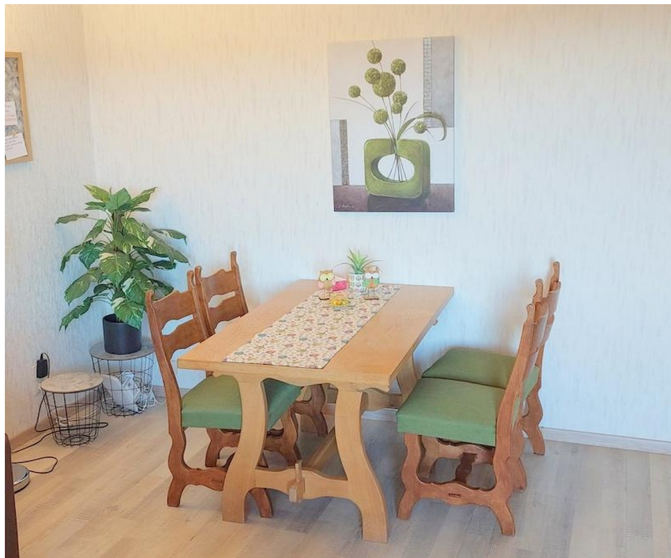
Wohnzimmer mit Essbereich