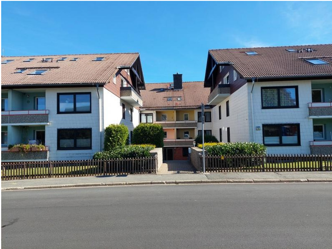
Hausansicht von der Straße