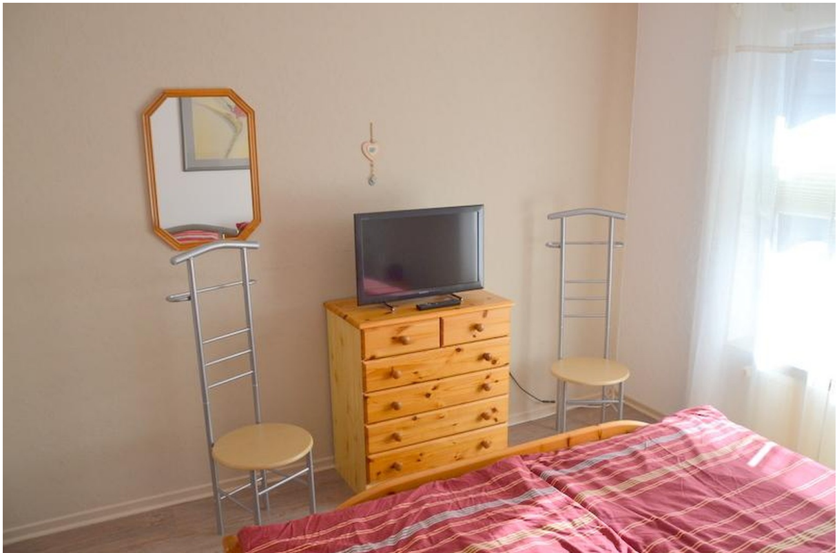
Schlafzimmer mit TV