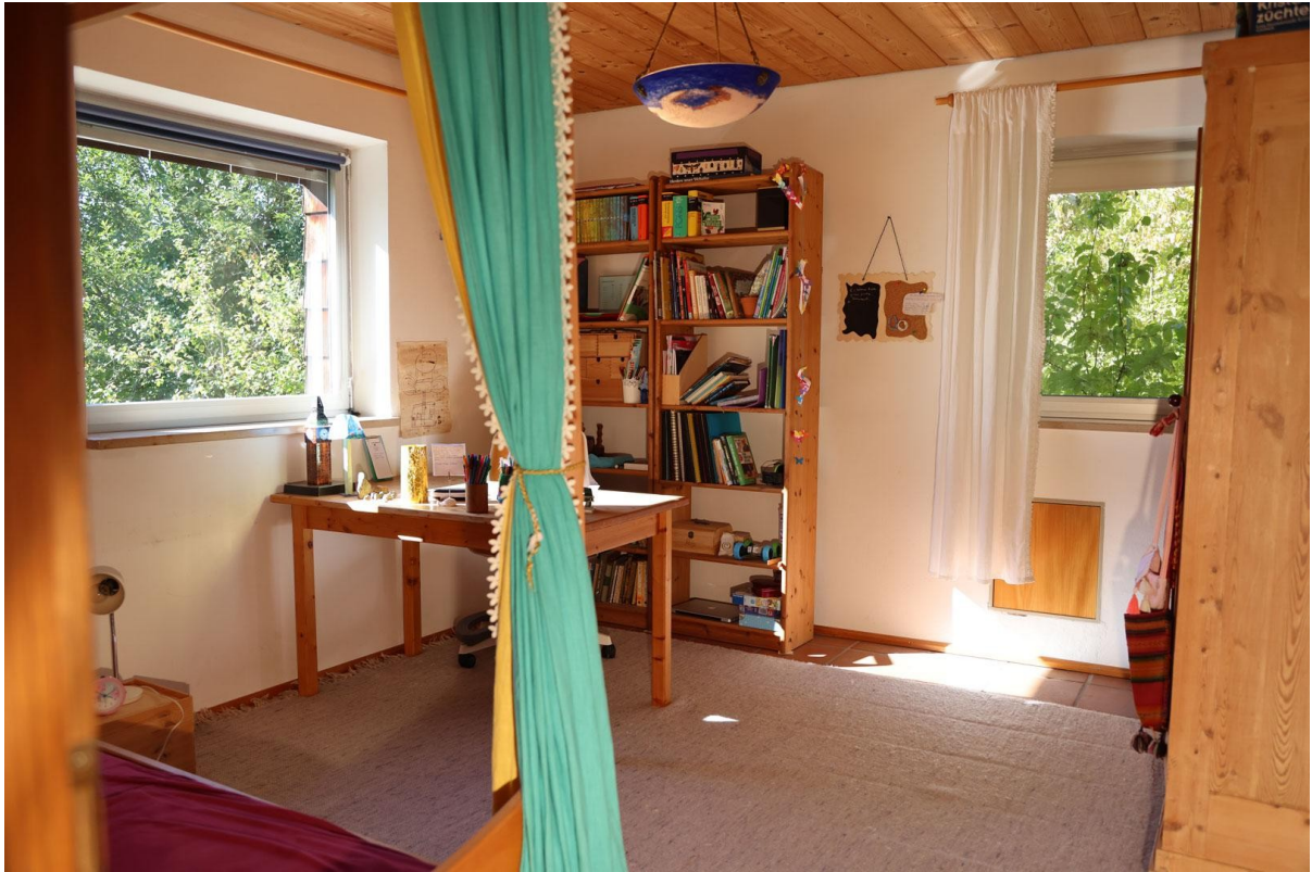
Zimmer 2 (Ansicht 2) Ebene 3