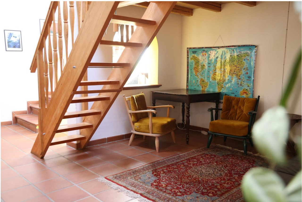
Wohnzimmer (Ansicht 5) Ebene 2