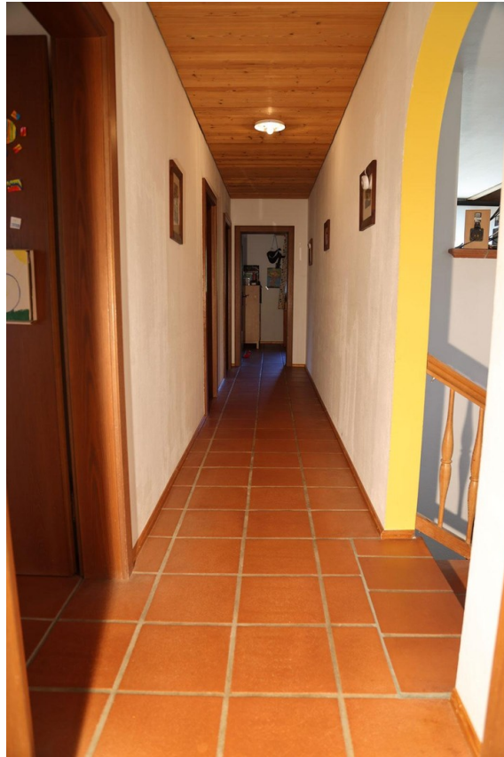
Gang Ebene 3