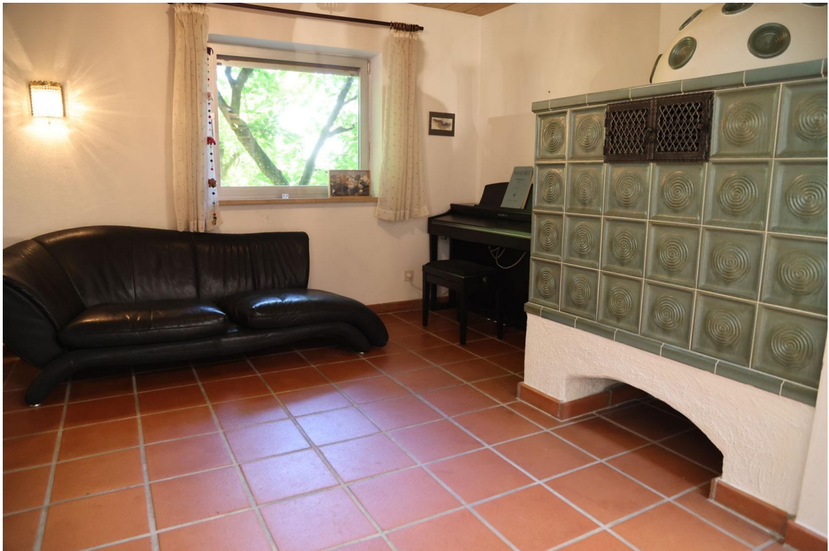
Kaminzi. Ebene 2