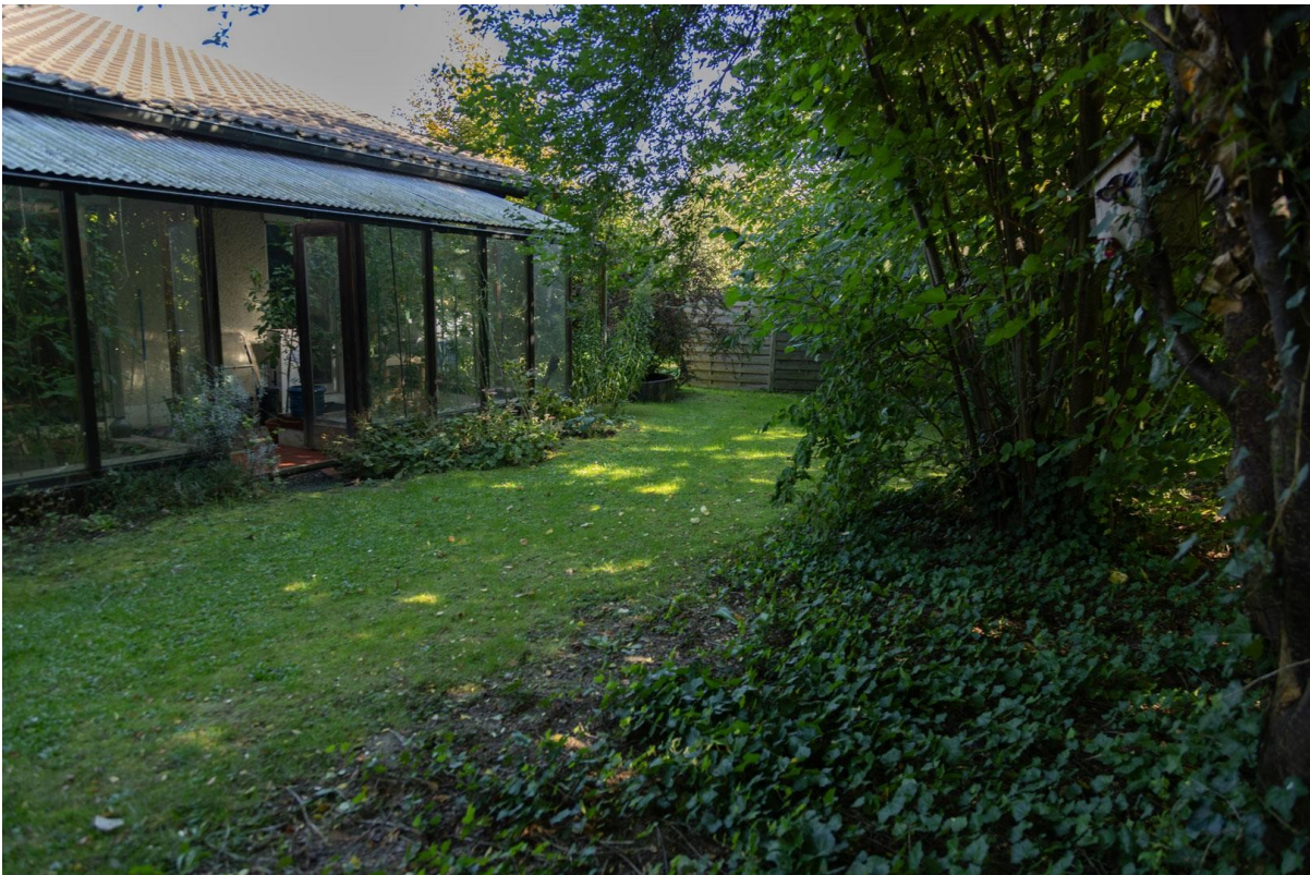
Wintergarten (Ansicht 1)