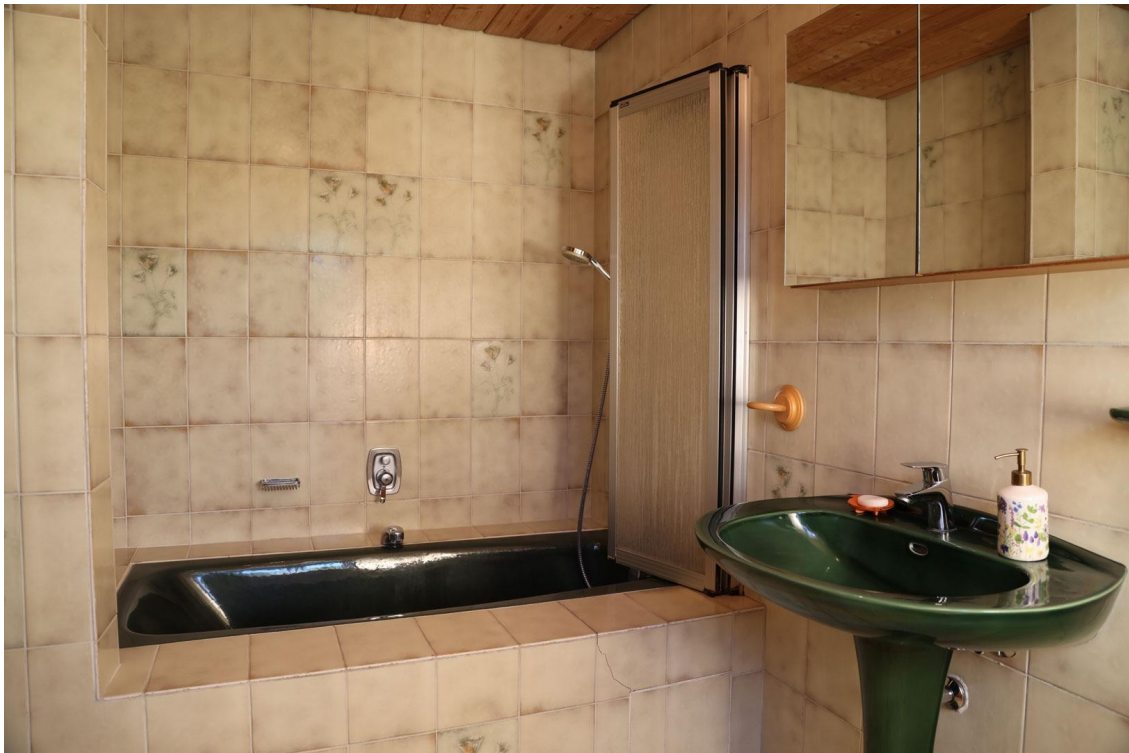
Bad (Ansicht 2) Ebene 3