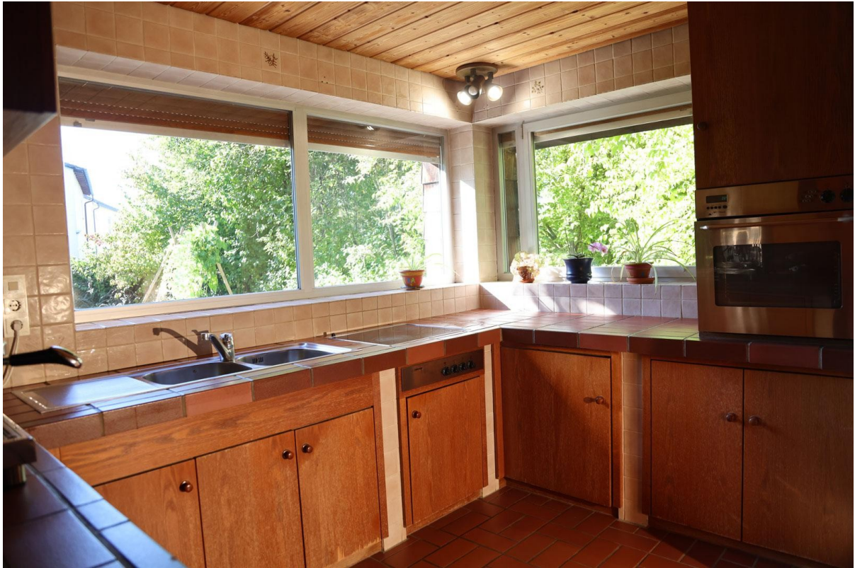
Küche (Ansicht 1) Ebene 1