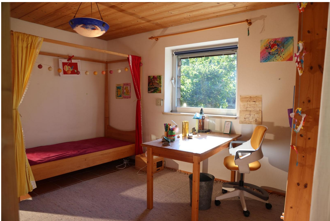
Zimmer 2 (Ansicht 1) Ebene 3