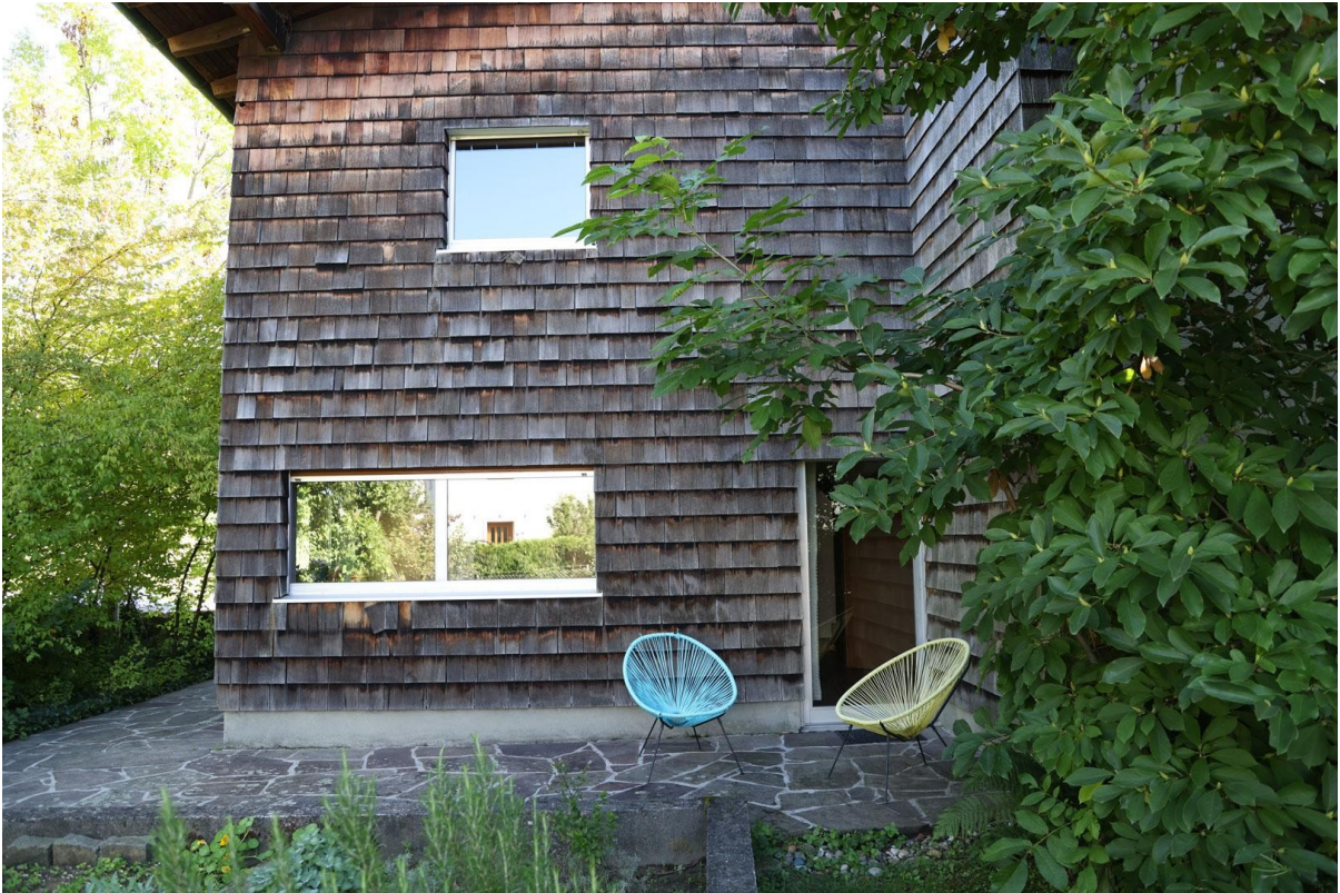
Terrasse 1 West