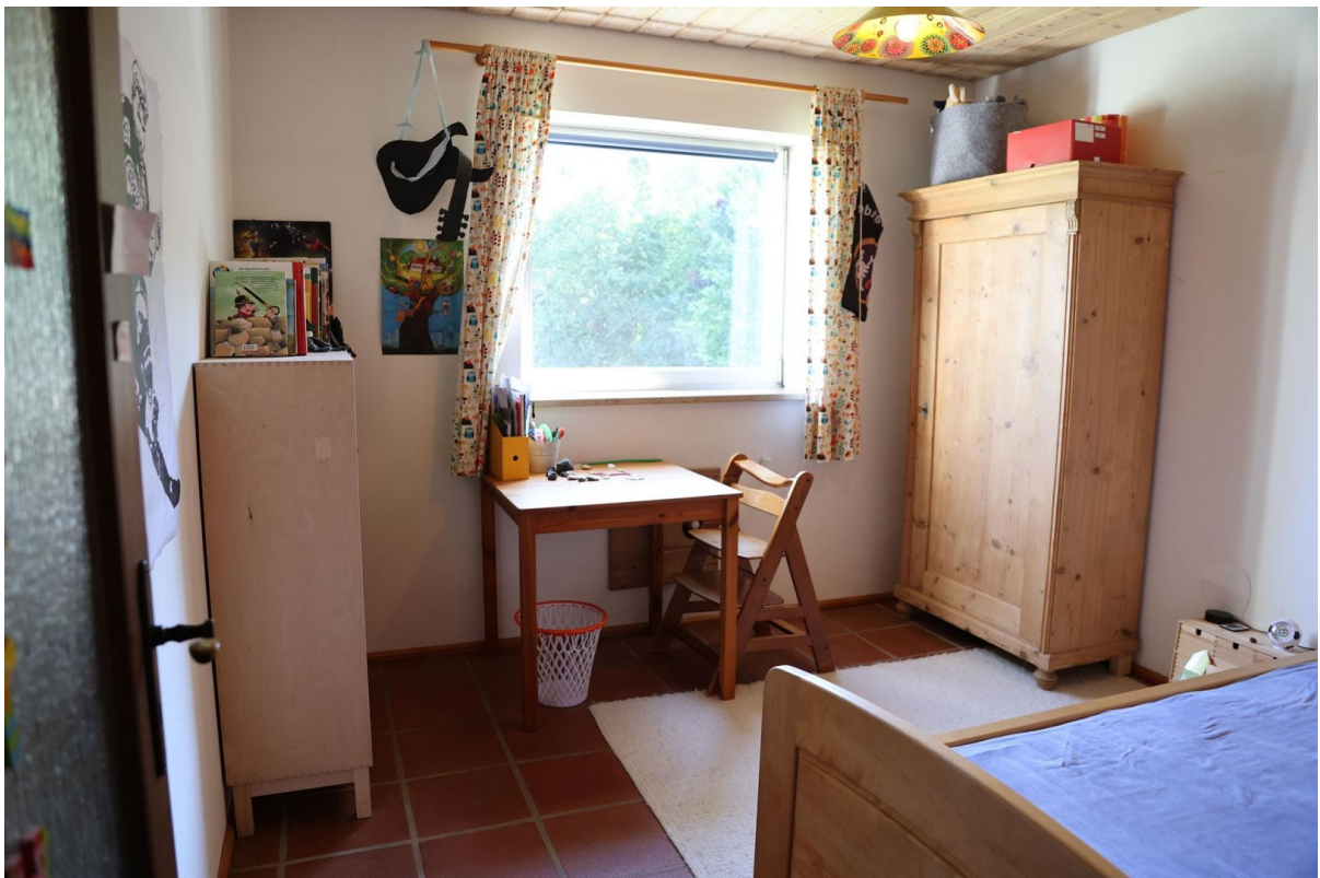
Zimmer 1 Ebene 3