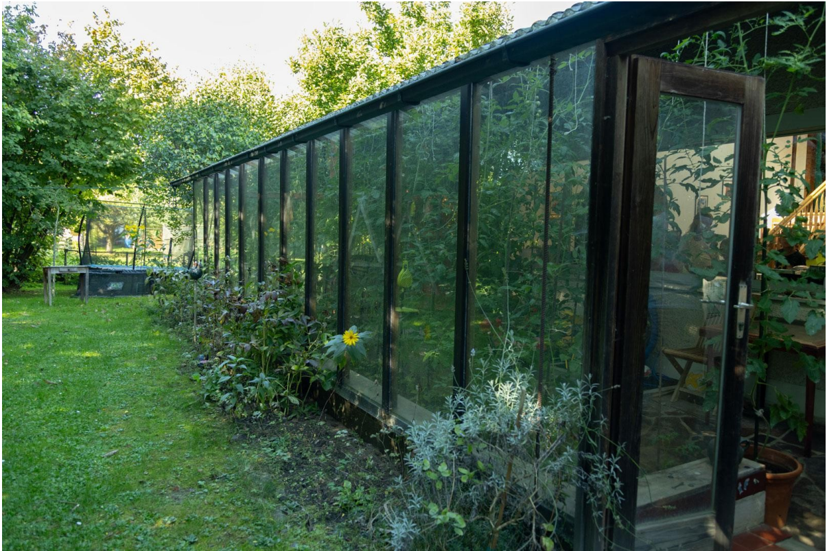
Wintergarten (Ansicht 2)