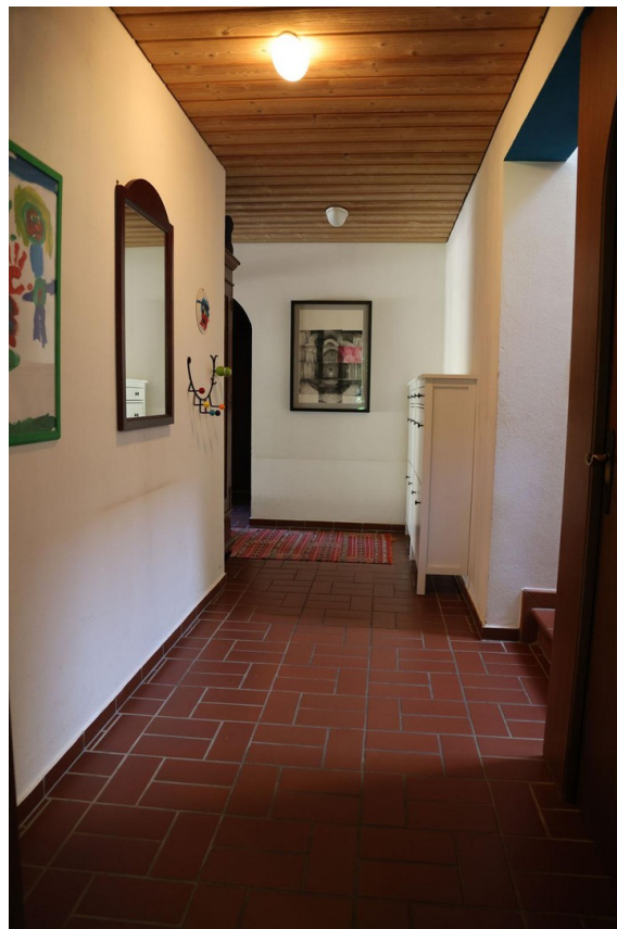
Diele Ebene 1