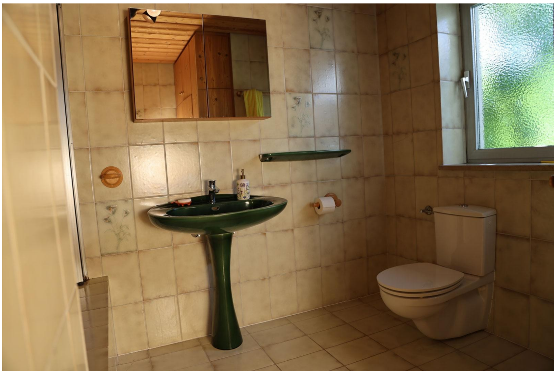
Bad (Ansicht 1) Ebene 3