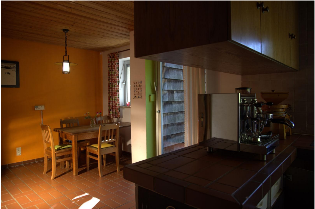
Essbereich Ebene 1