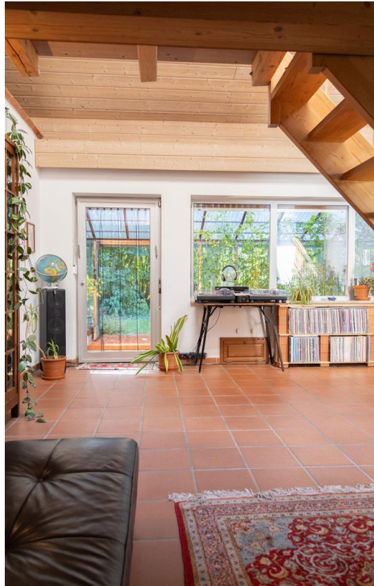
Wohnzi. (Ansicht 4) Ebene 2