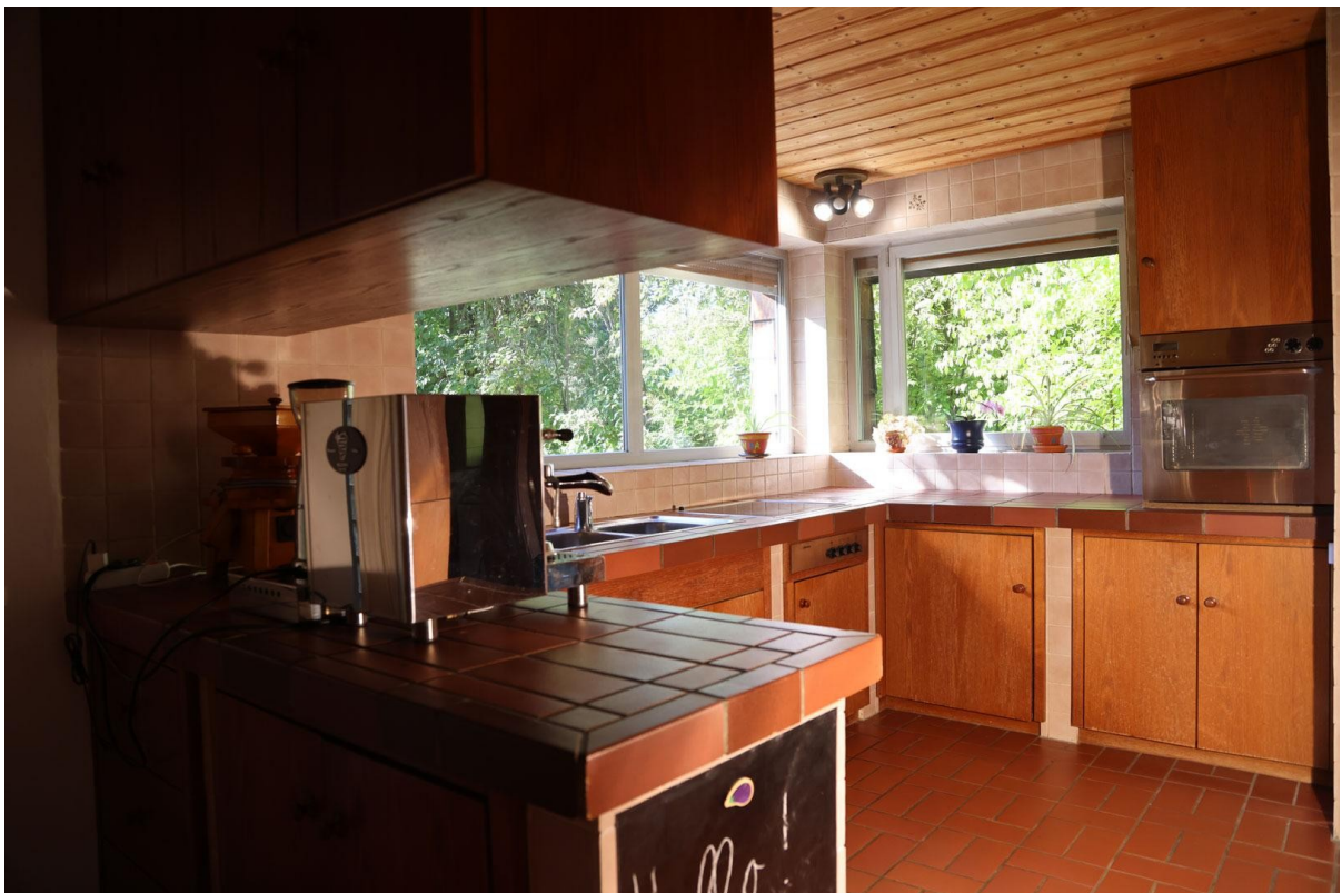
Küche (Ansicht 2) Ebene 1