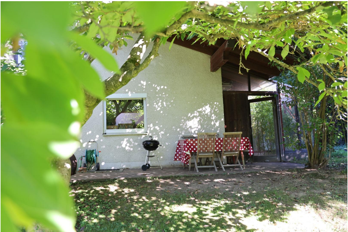
Terrasse 2 West