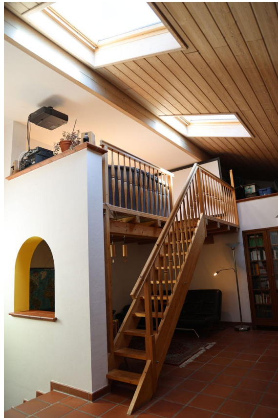
Wohnzi., Aufgang zur Galerie