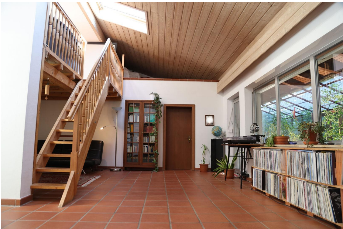
Wohnzi. (Ansicht 2) Ebene 2