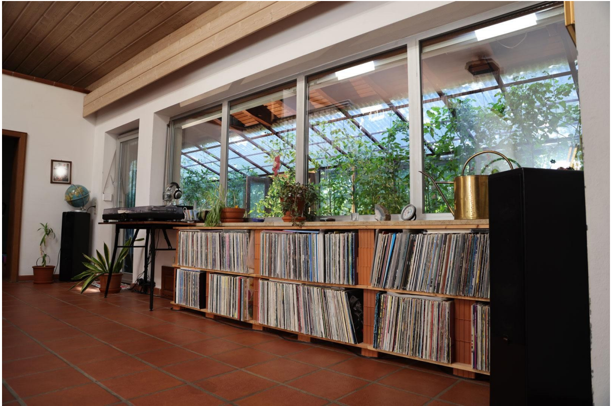
Wohnzi. (Ansicht 3) Ebene 2