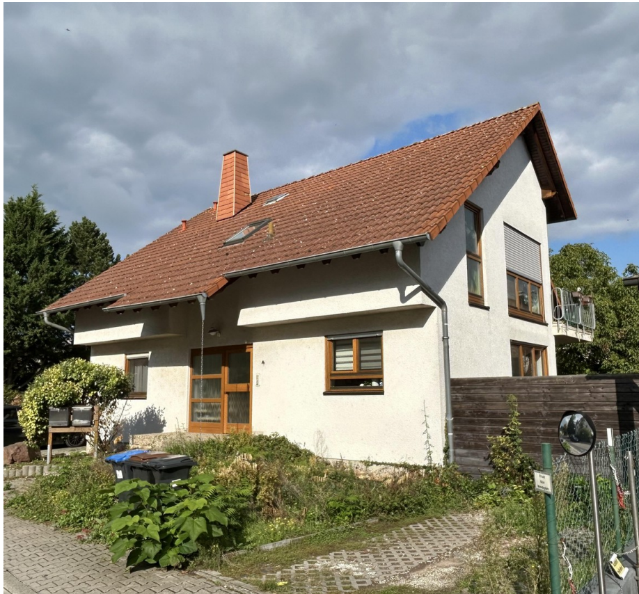
Ansicht von Südwesten