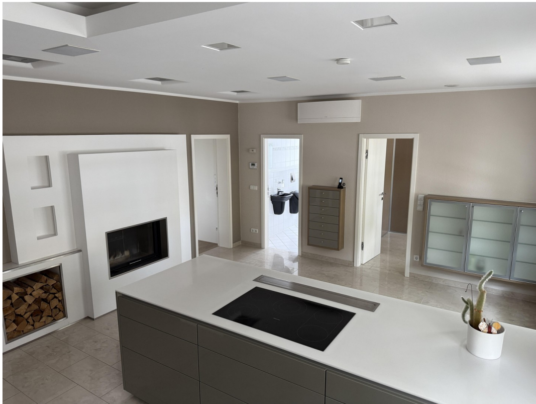
Wohnküche - Eingangsbereich