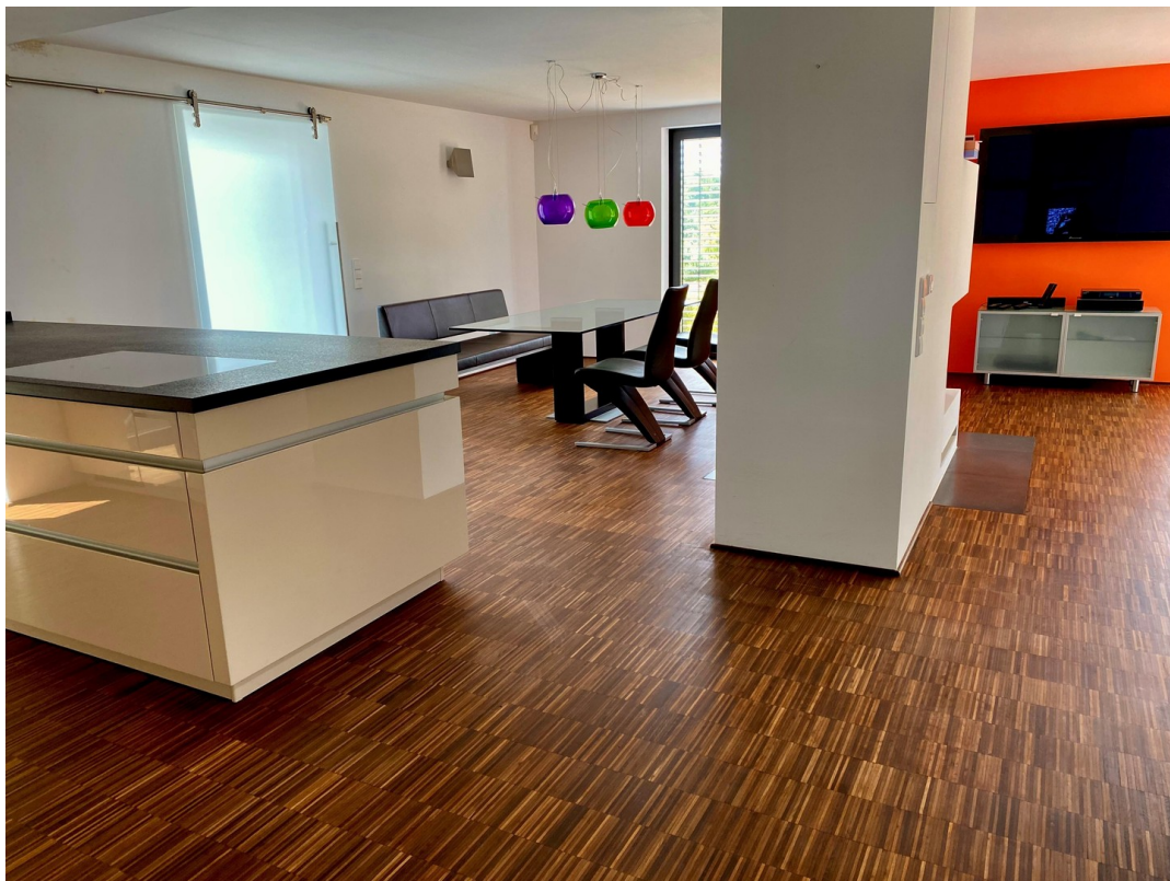
Sicht in Küche und Esszimmer