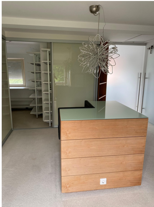
Ankleide- und Schuhschrank