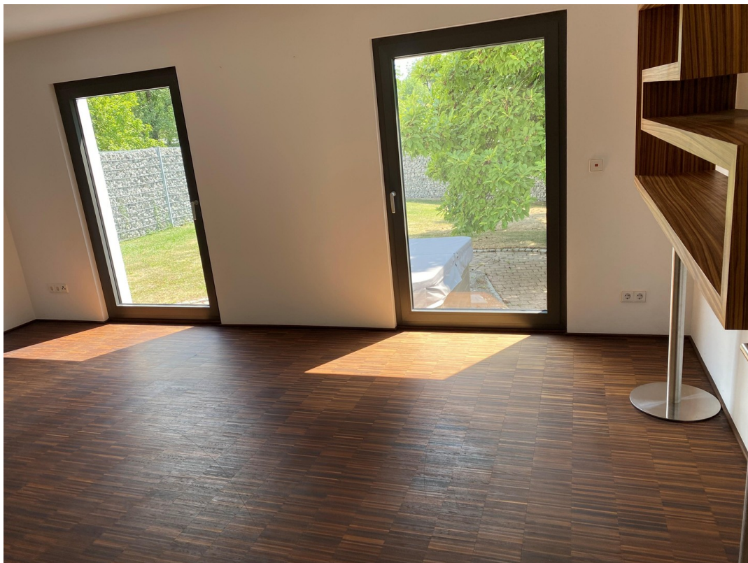
Wohn oder Fernsehzimmer