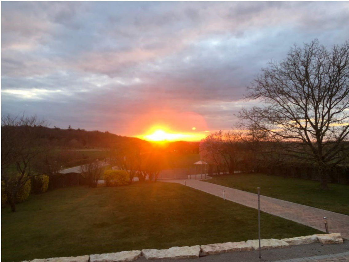
Sonnenuntergang aus dem SZ