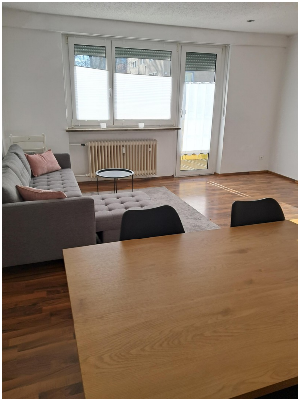
Wohnzimmer mit Balkon