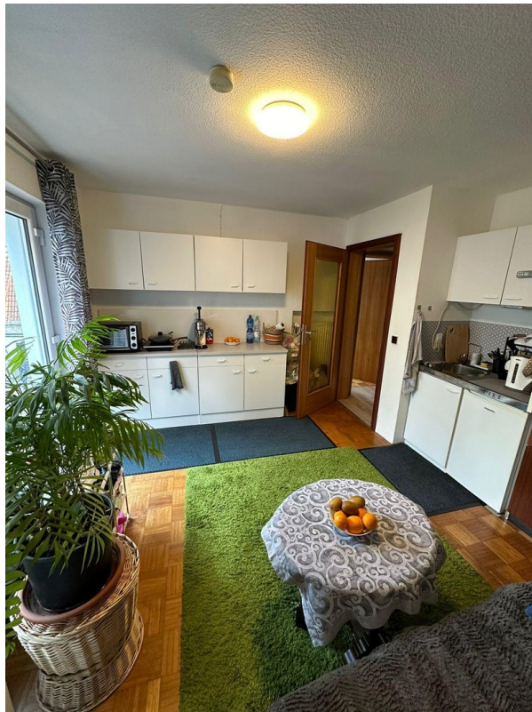
A-EG Ost Wohnküche+Eingang/Ter