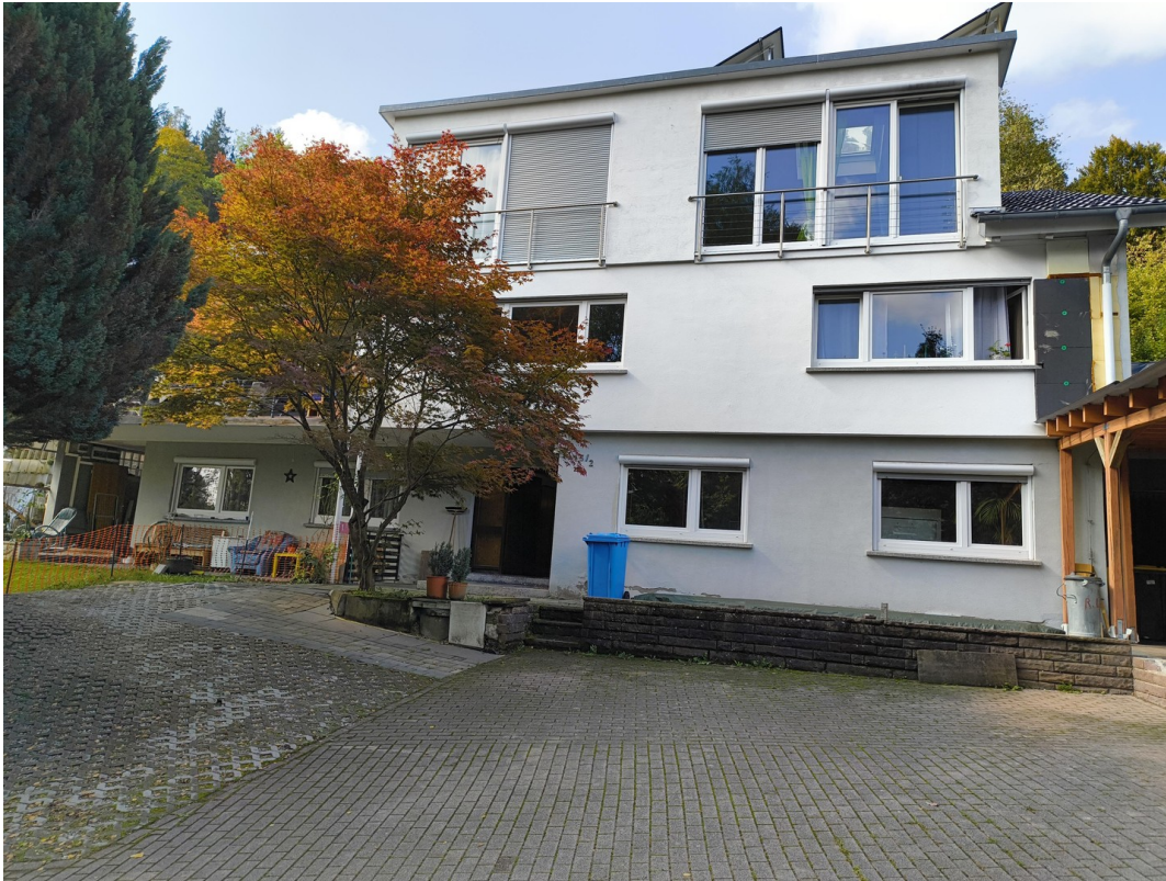
A-Haus Ansicht vorne