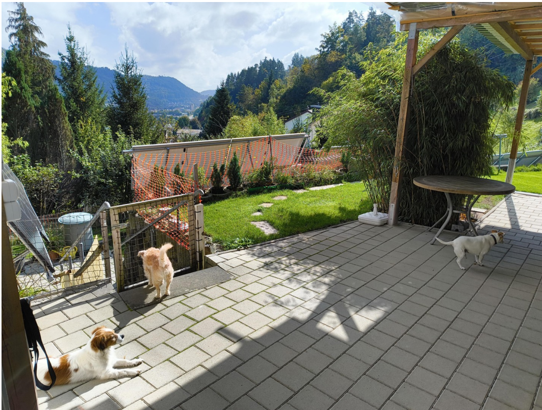
A-EG SüdWest Terrasse Blick