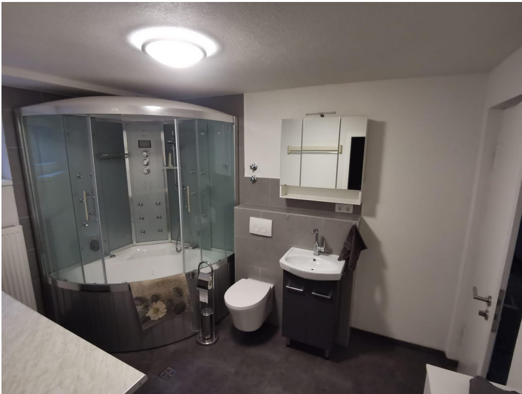
Bad UG links