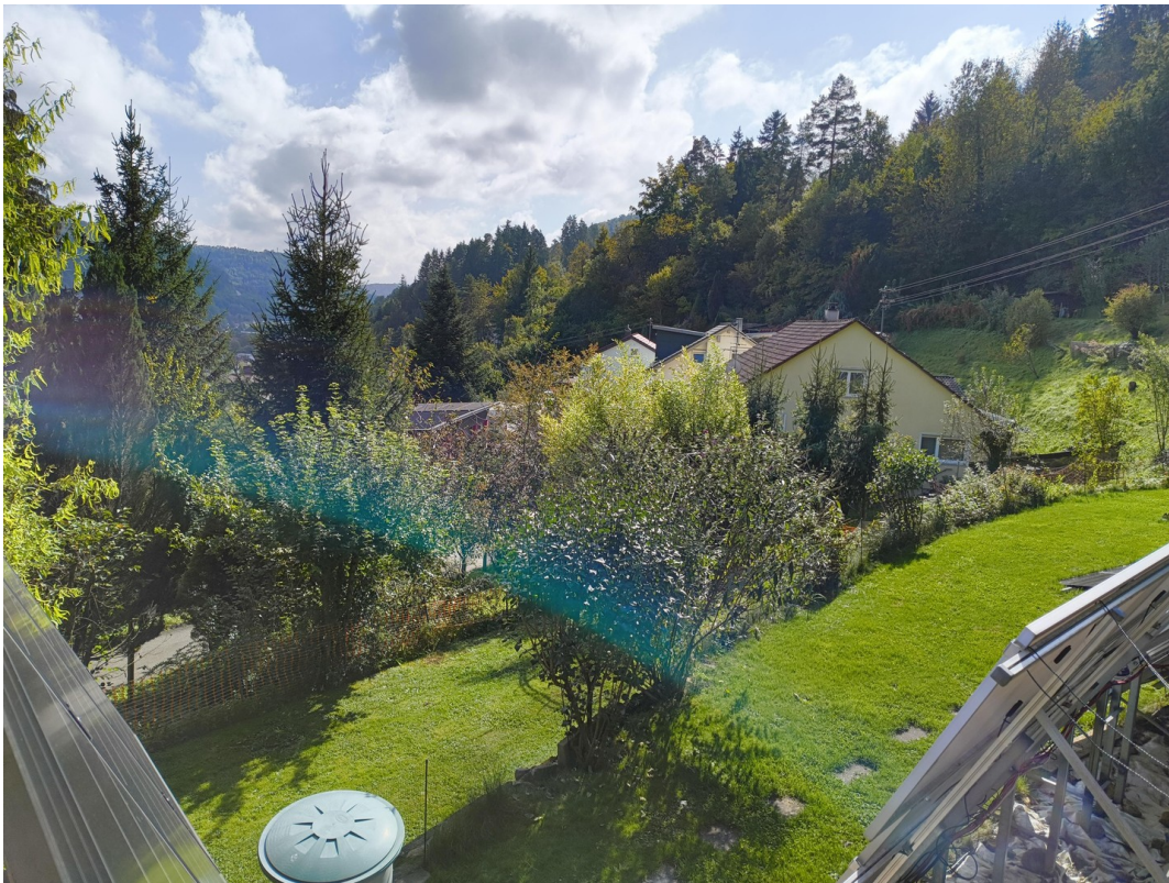
A-DG SüdWest Balkon