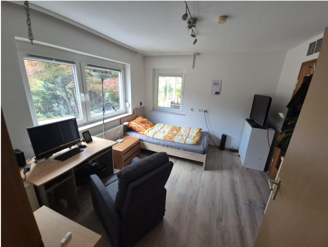
A-UG re WZ