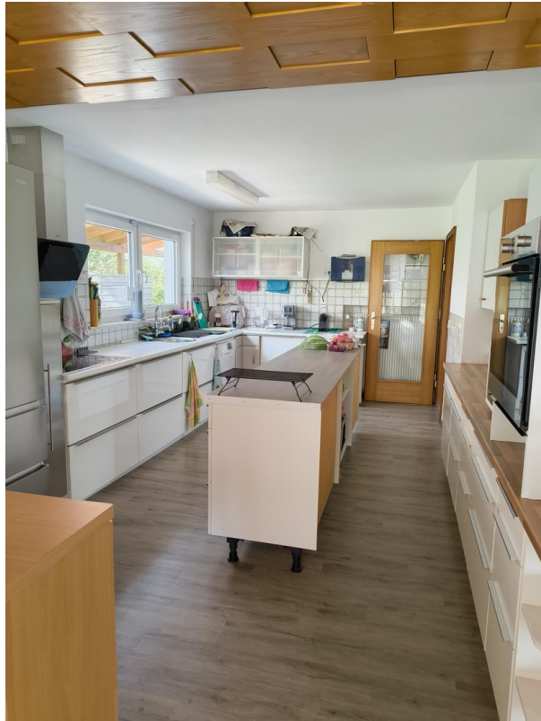
A-EG Küche zu Türe