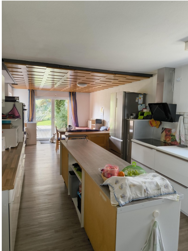
A-EG Küche, Eßzi