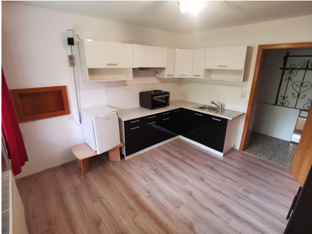
Küche UG links