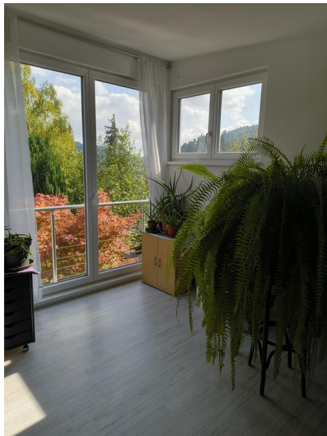
A-DG WZ Ecke