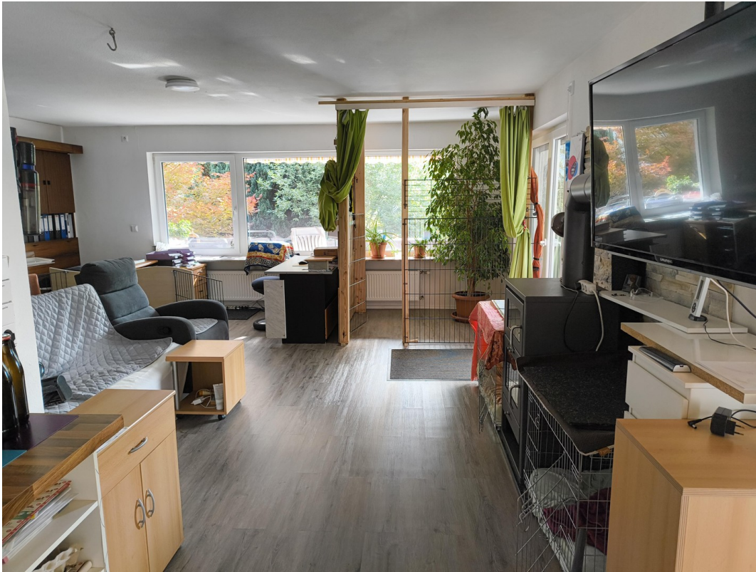
A-EG von EZ zu WZ+Büro