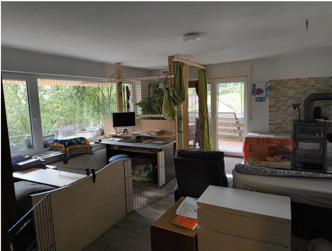
A-EG WZ, Büro - Balkon