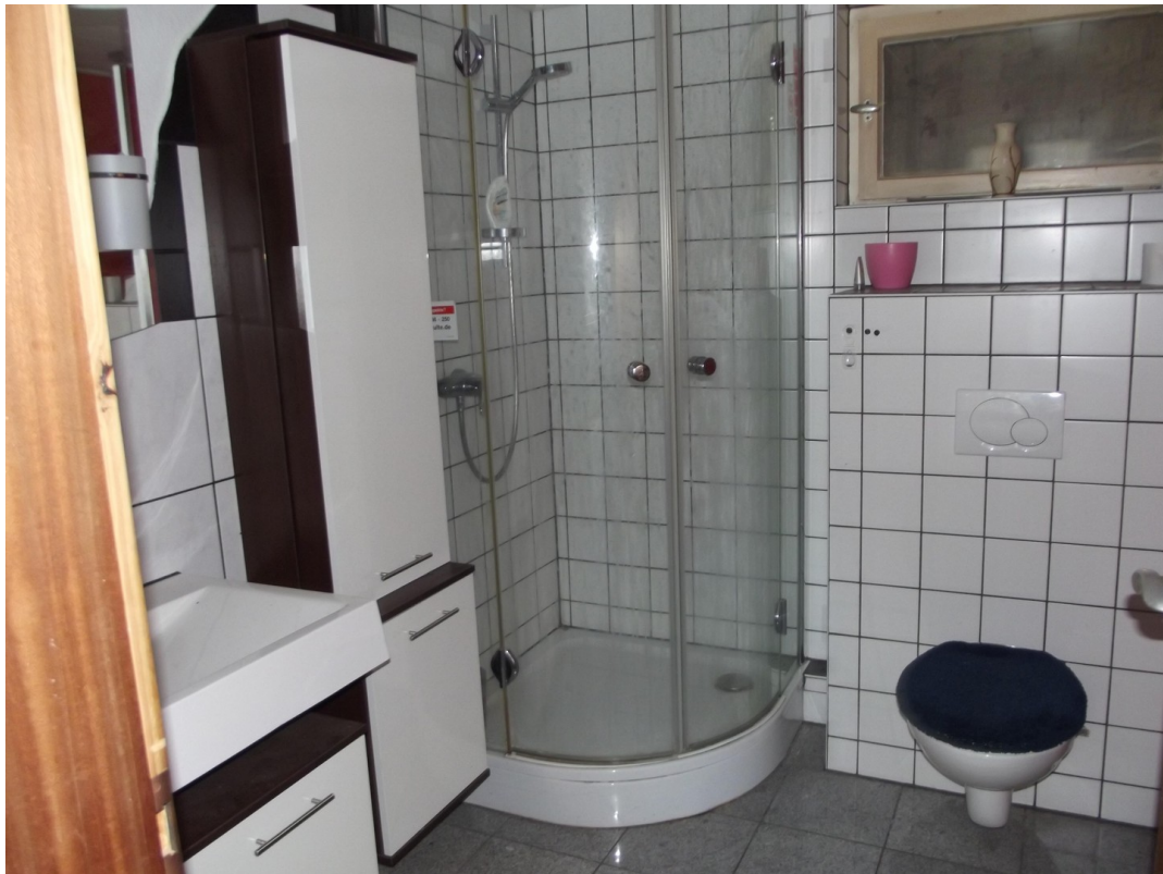
Bad UG rechts