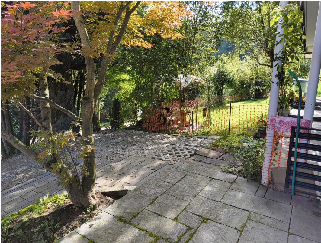
A-Stellp. Garten UG