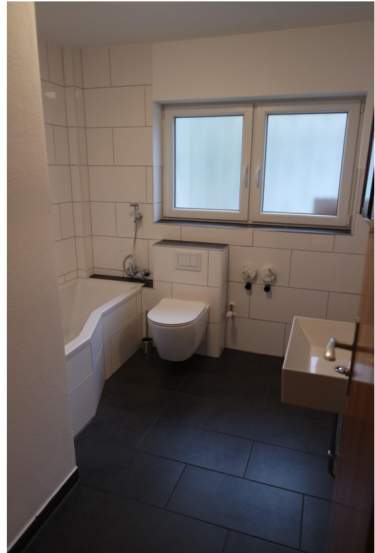
Bad Ost-Wohnung EG