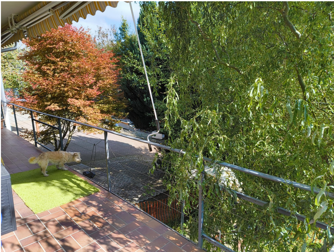
A-EG S-Ost Balk.+Stellplätze