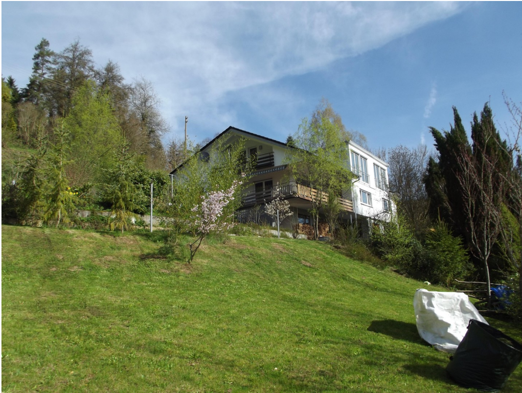
Haus von unterer Zufahrt 2015