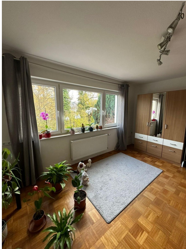
A-EG Ost SZ