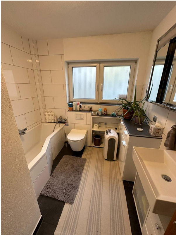
A-EG Ost Bad