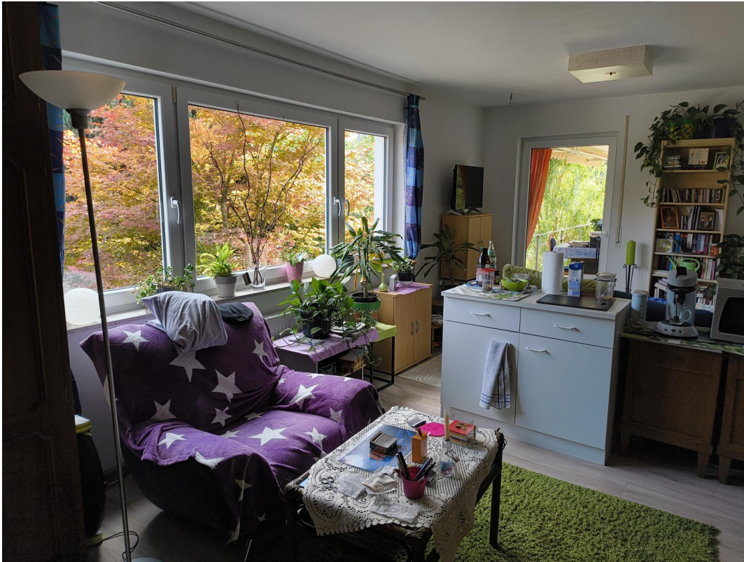
A-EG SZ zZ. als 1-Zi-W genutzt