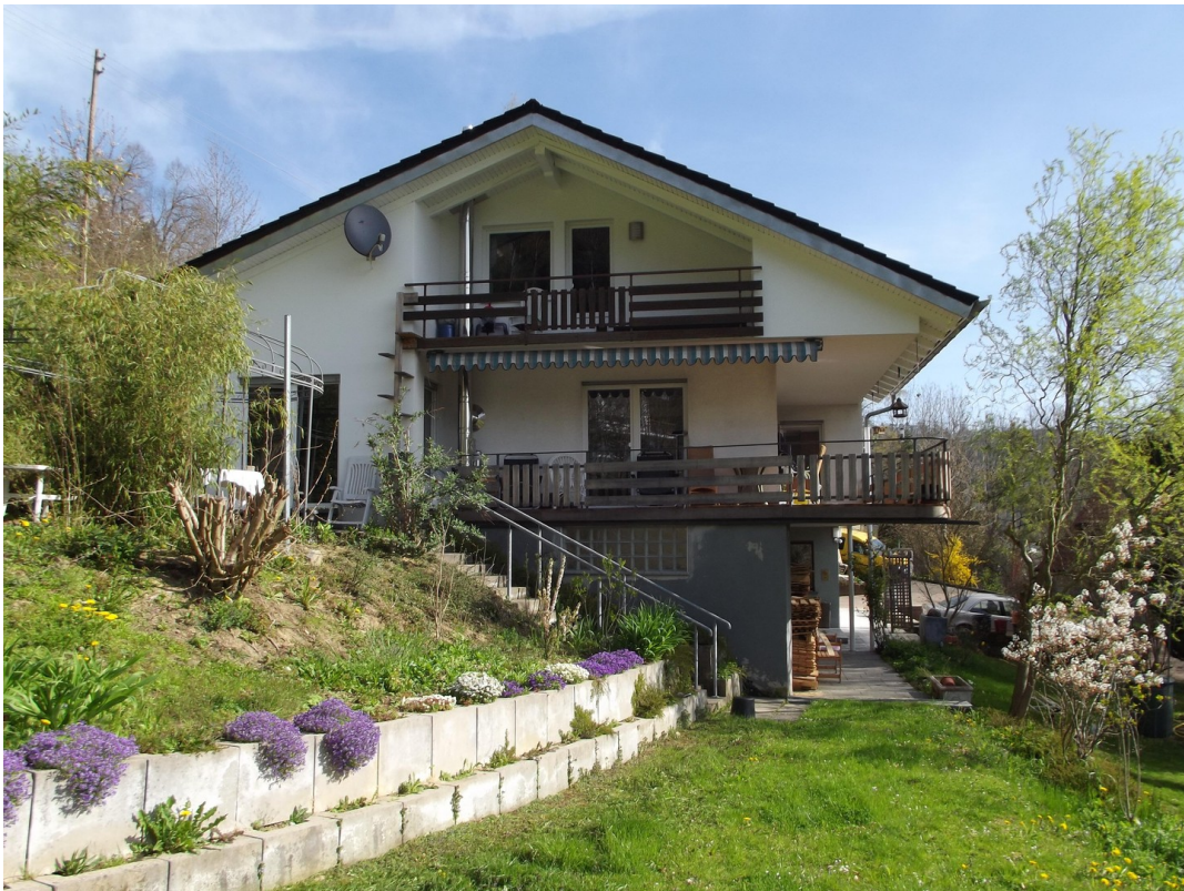
Haus Südseite 2015