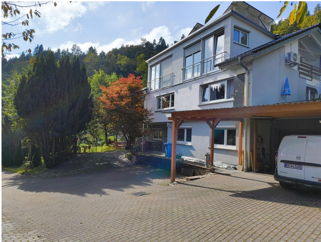
A-Haus Ansicht leicht seitlich