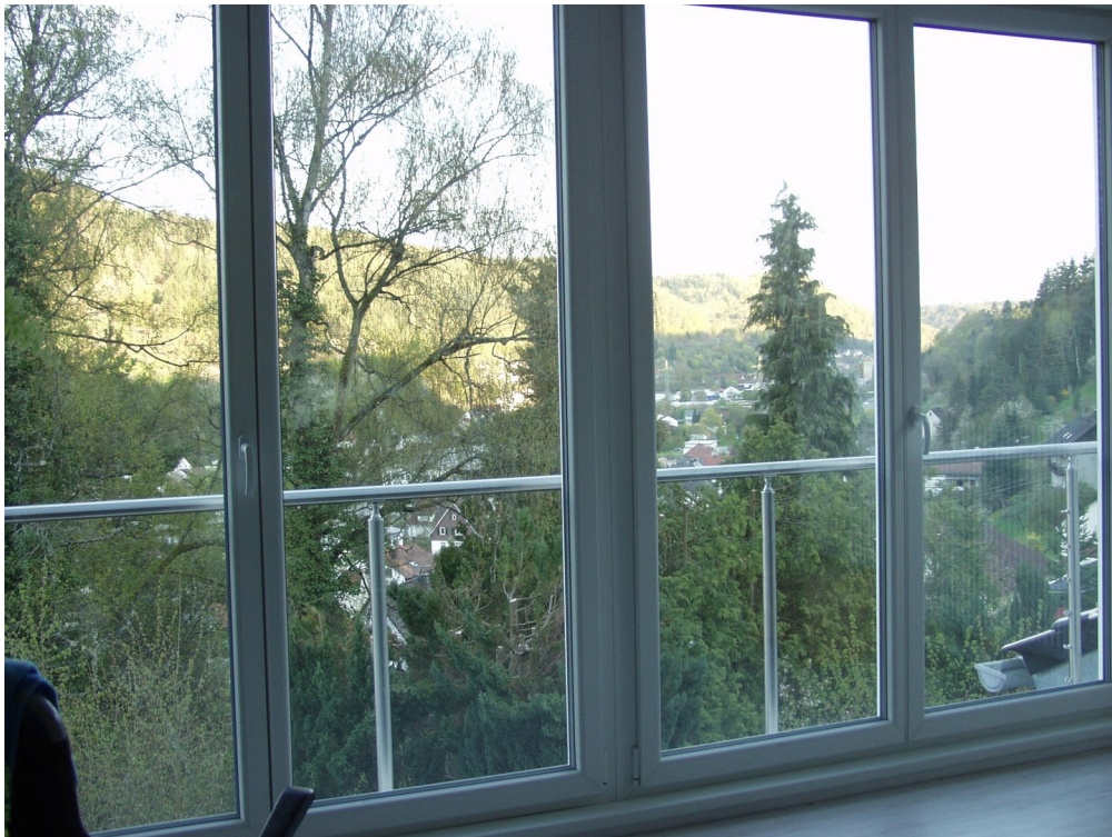
A-DG WZ Blick