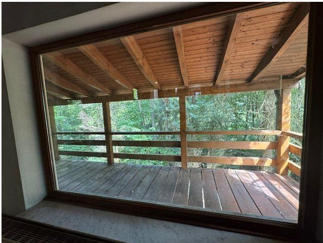
Blick auf dem Balkon