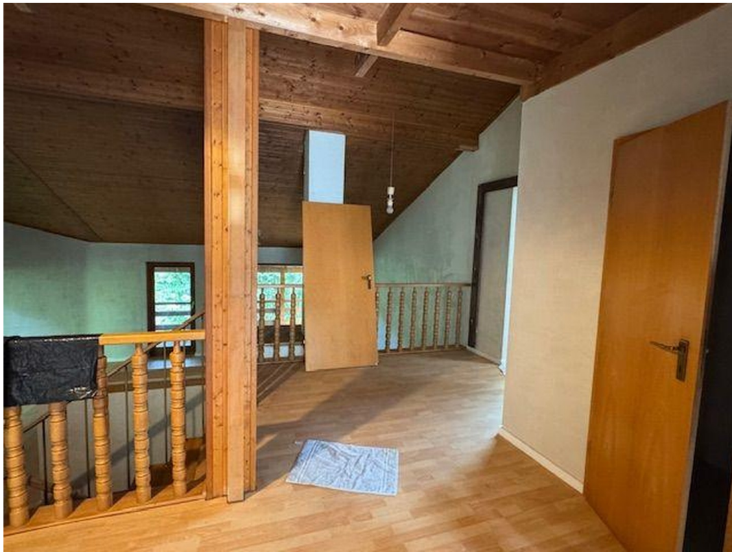
Blick in den oberen Bereich