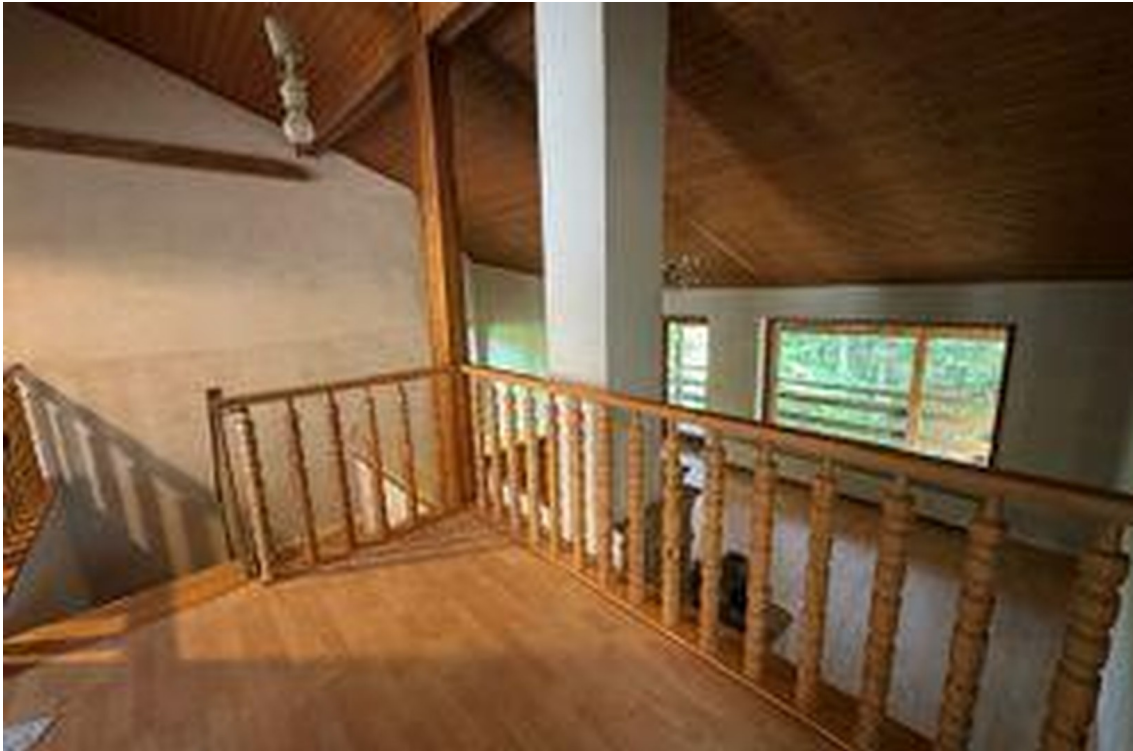
Blick in den Wohnbereich