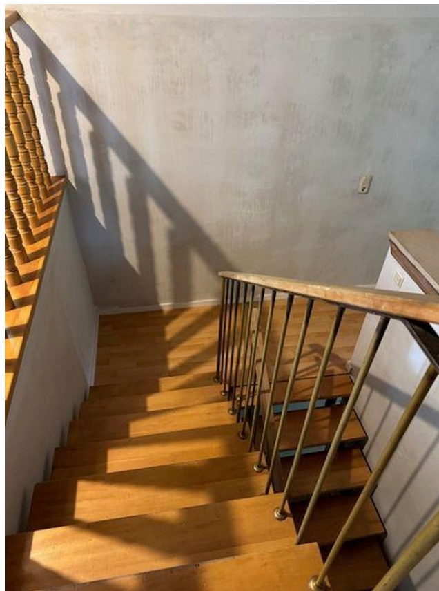
Treppe zum Wohnbereich