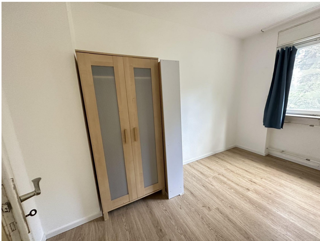
ca. 14m2 Zimmer