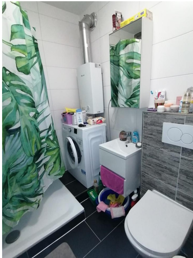
Dusche + WC