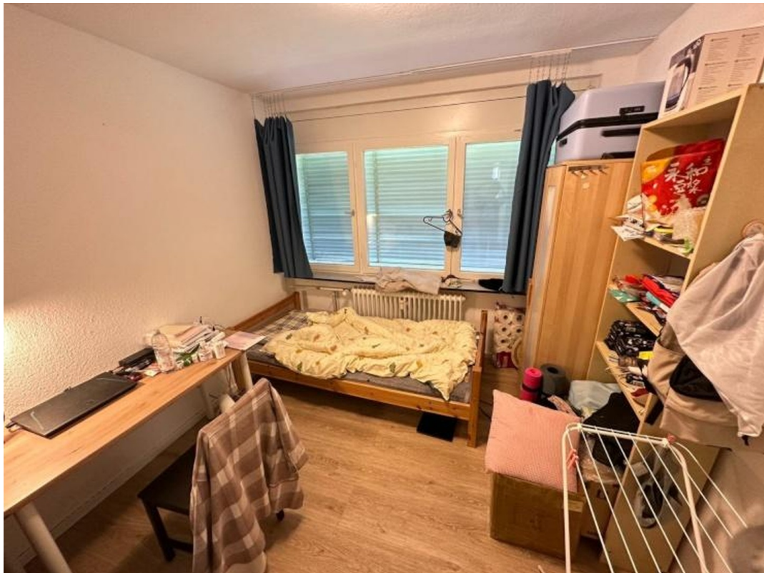
ca. 10m2 Zimmer