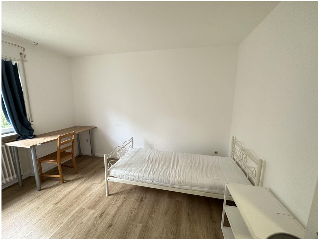
ca. 14m2 Zimmer