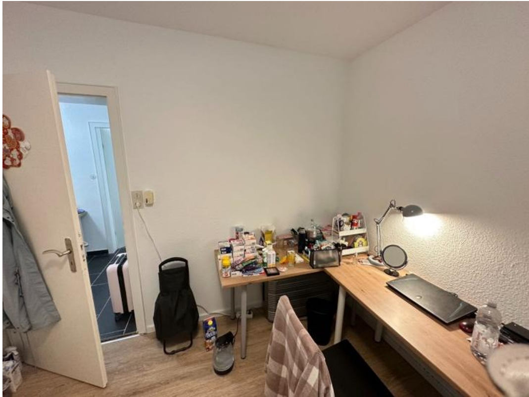
ca. 10m2 Zimmer