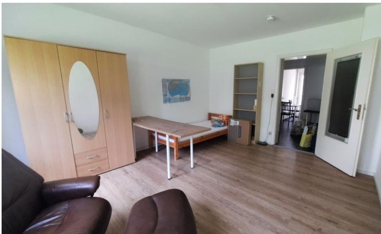
ca. 17m2 Zimmer