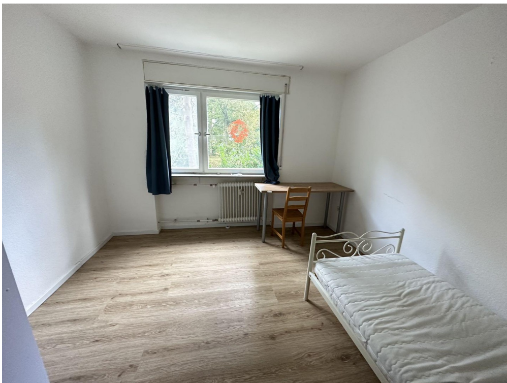
ca. 14m2 Zimmer