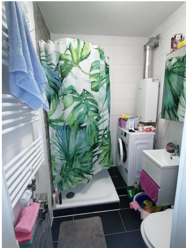
Dusche + WC