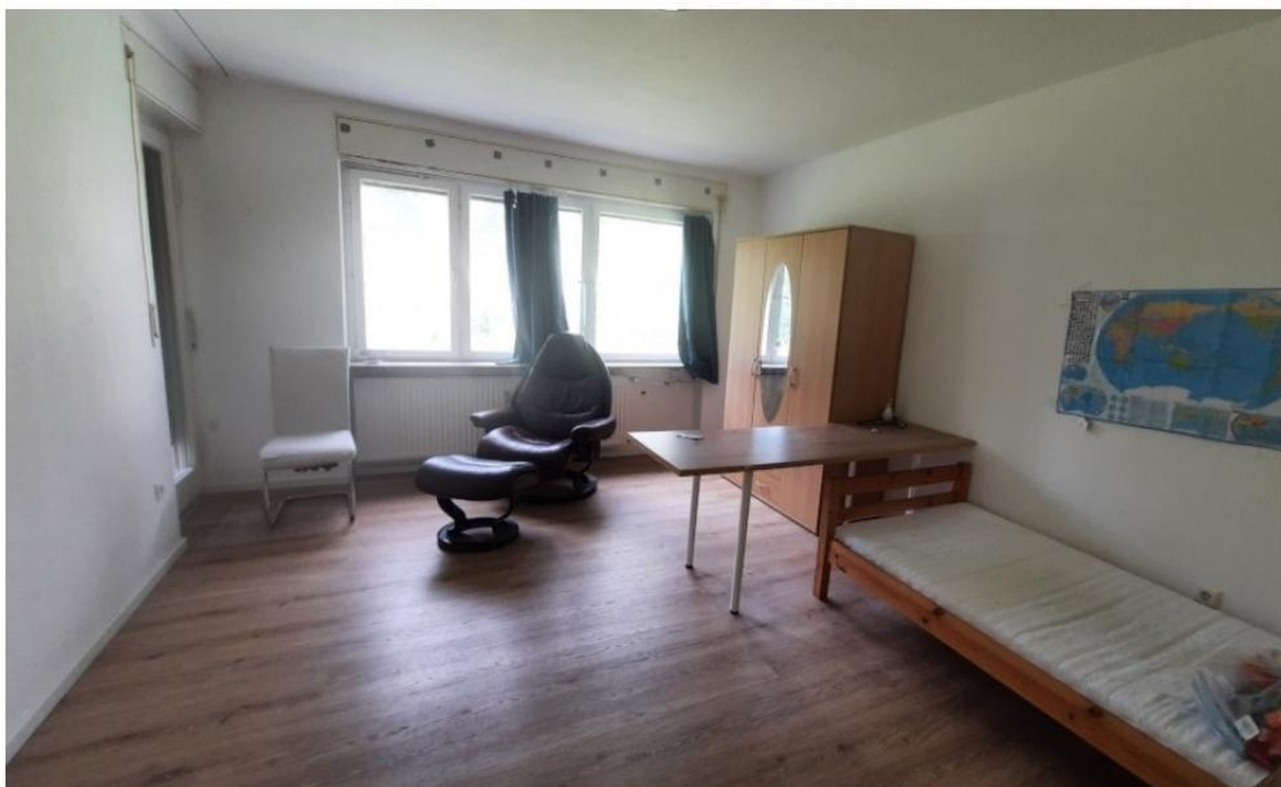
ca. 17m2 Zimmer