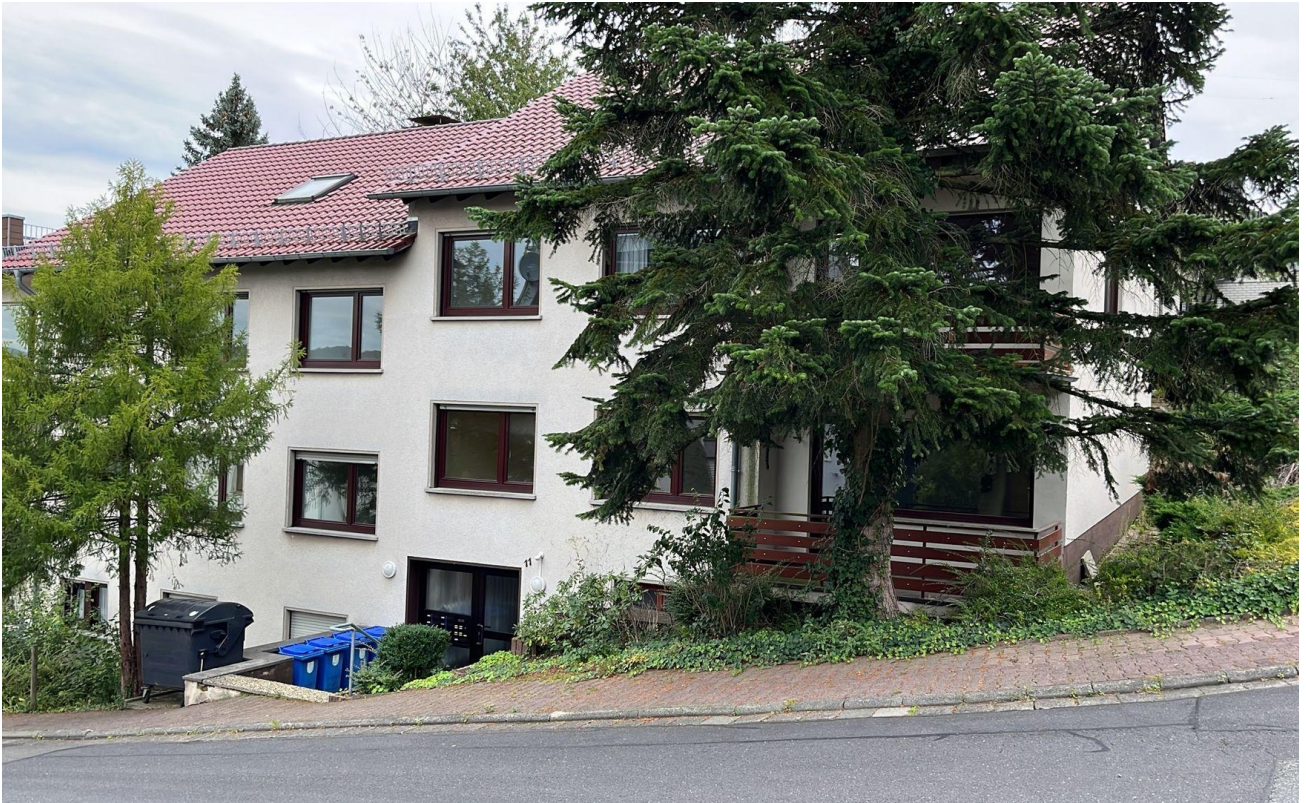
Blick auf das Haus