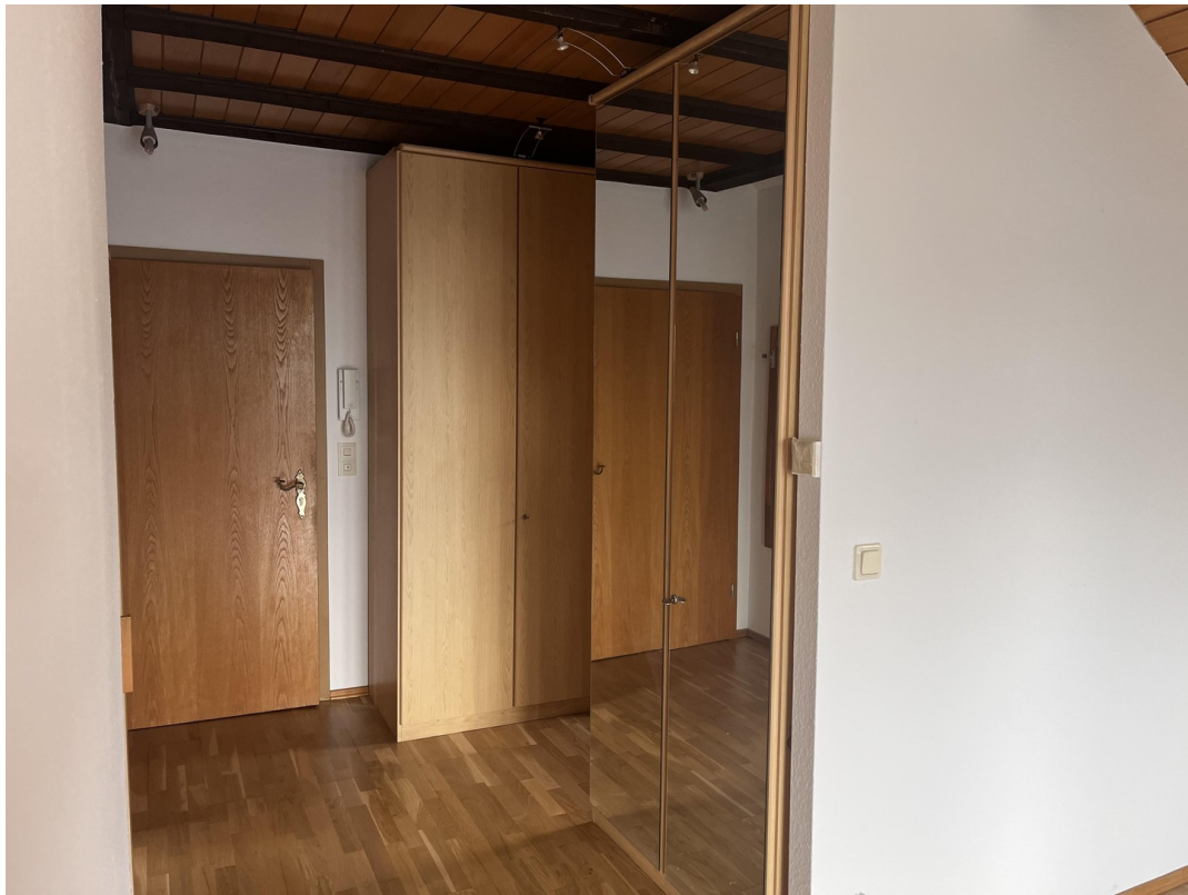
Diele mit Schränke