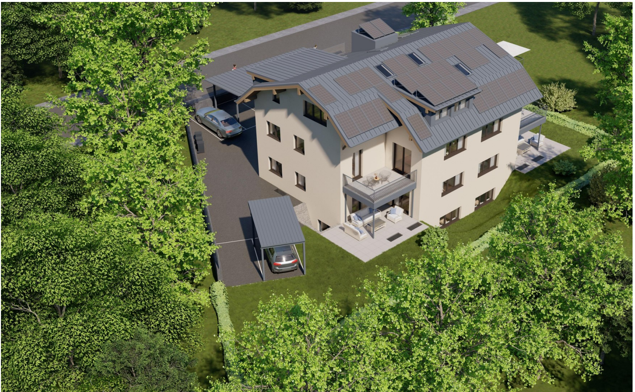
Ansicht Garten 2