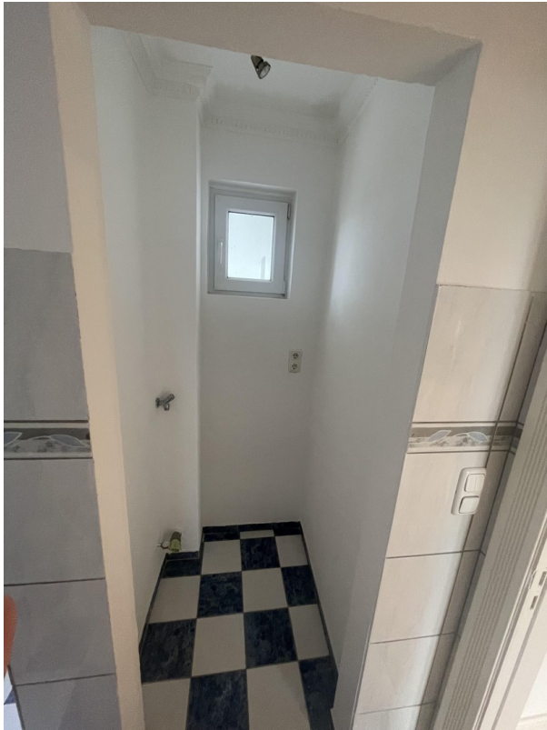
Anschluss für die Waschmaschine