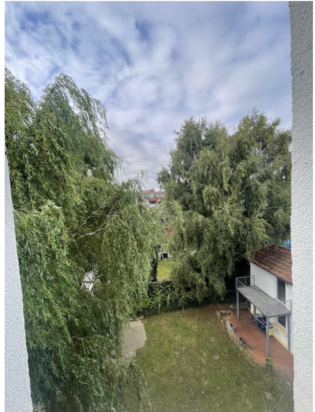
Blick aus dem rückw. Fenster