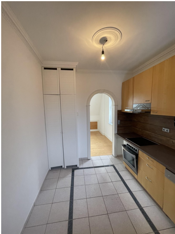
Blick aus der Küche