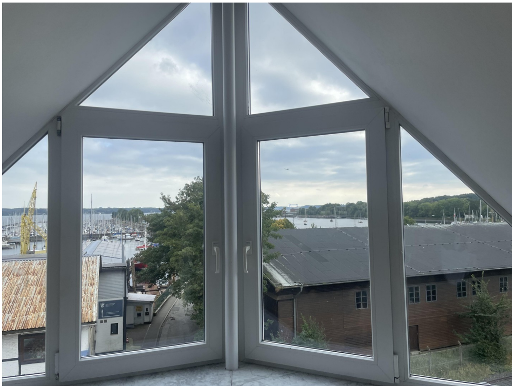
Blick aus dem Schlafzimmer