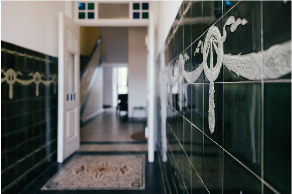
Alte Kacheln und Terrazo