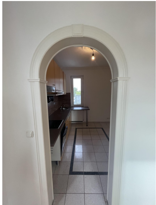
Durchgang zur Küche