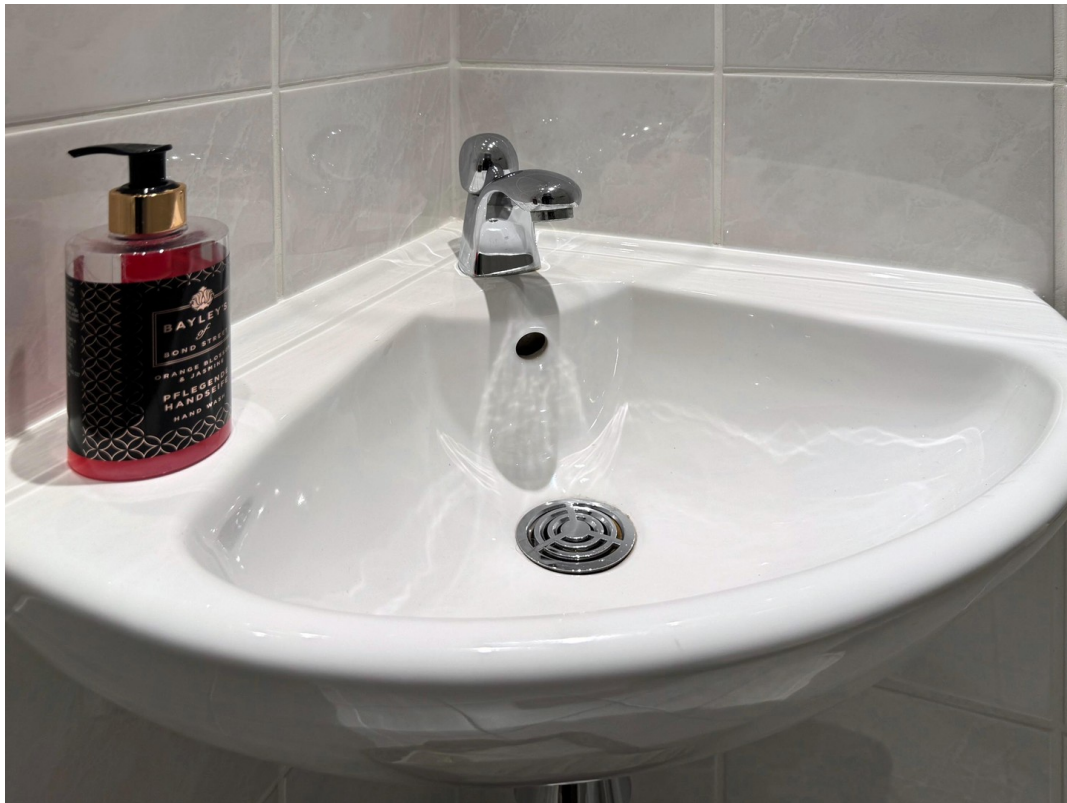
Detail Gäste WC