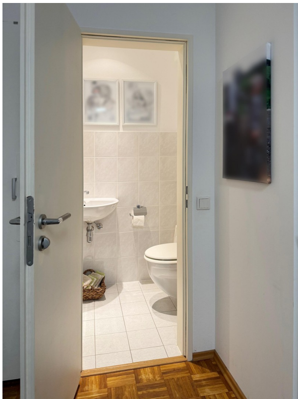
Diele Blick Gäste WC