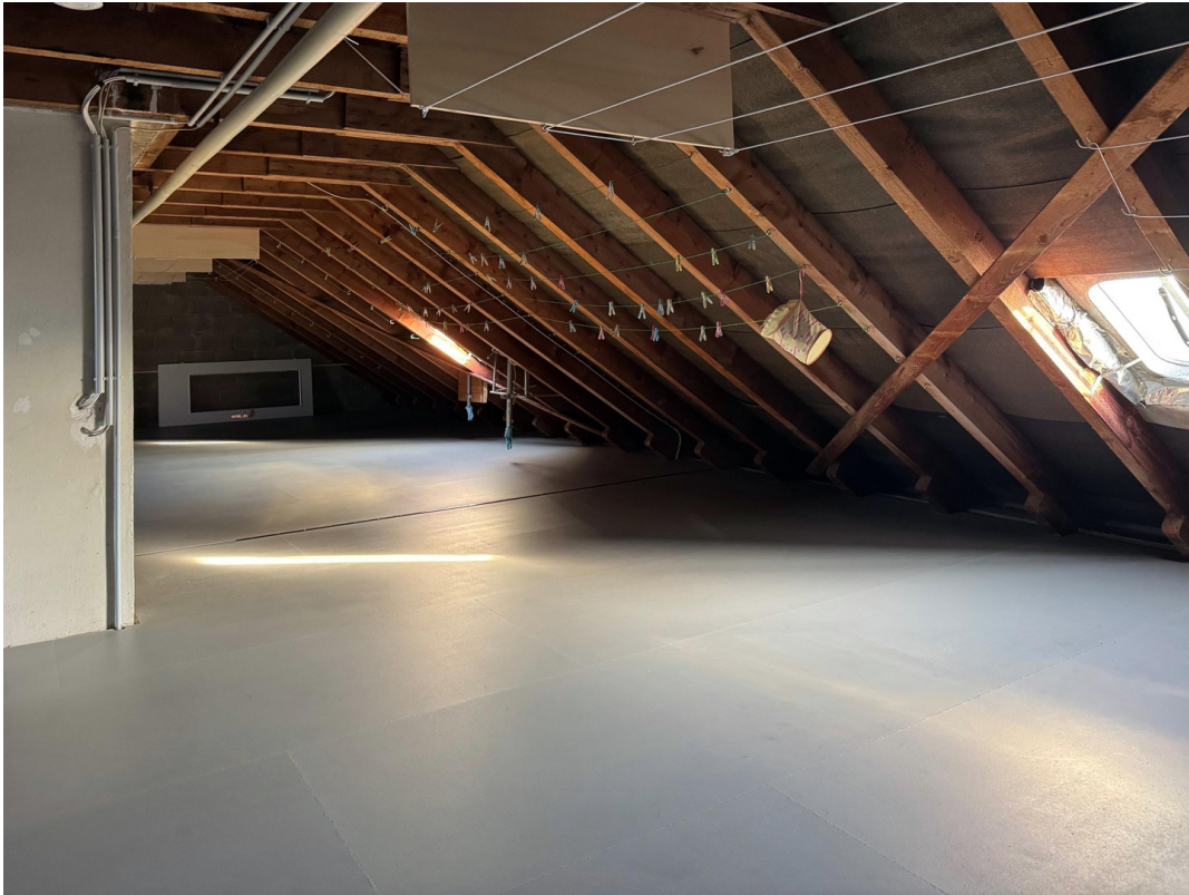
Top gepflegter Trockenspeicher