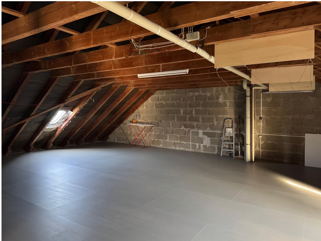
Top gepflegter Trockenspeicher