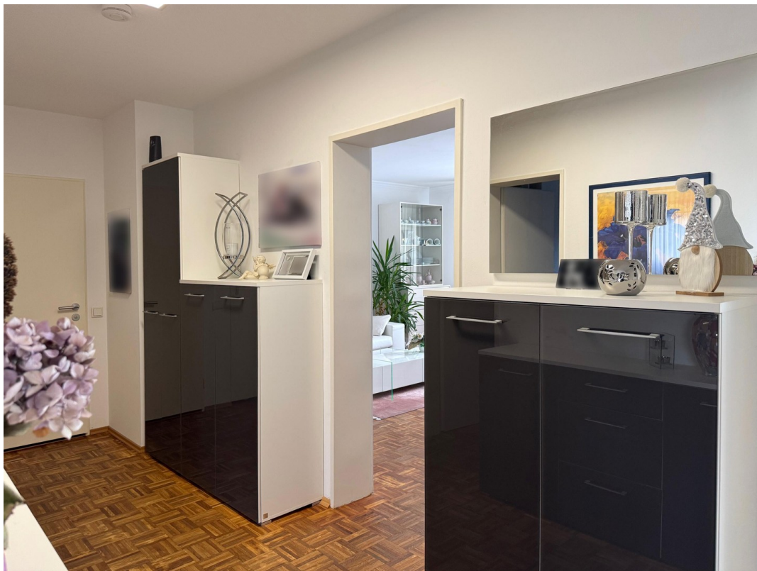
Diele Blick Wohnzimmer