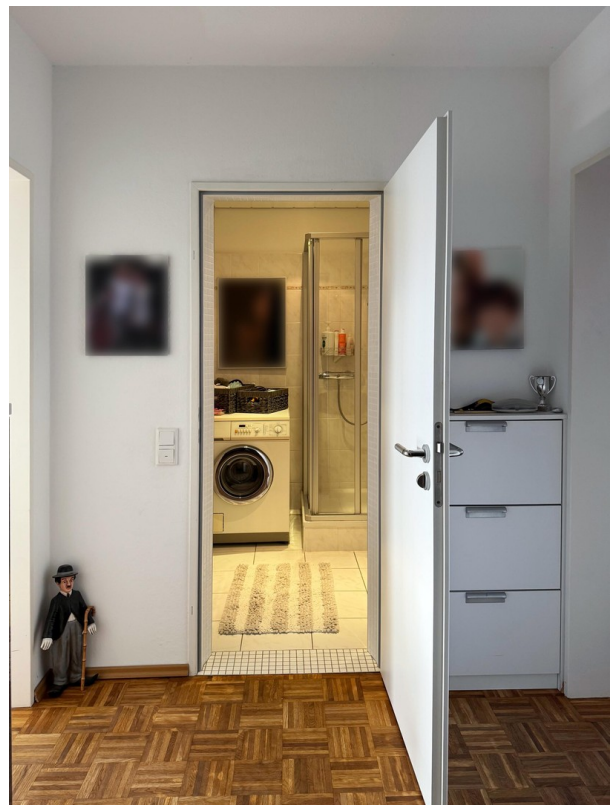
Diele Blick Duschbad