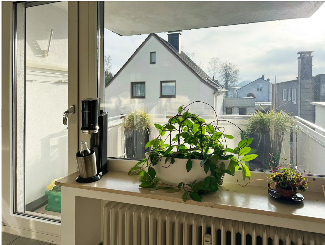
Küche Blick Balkon