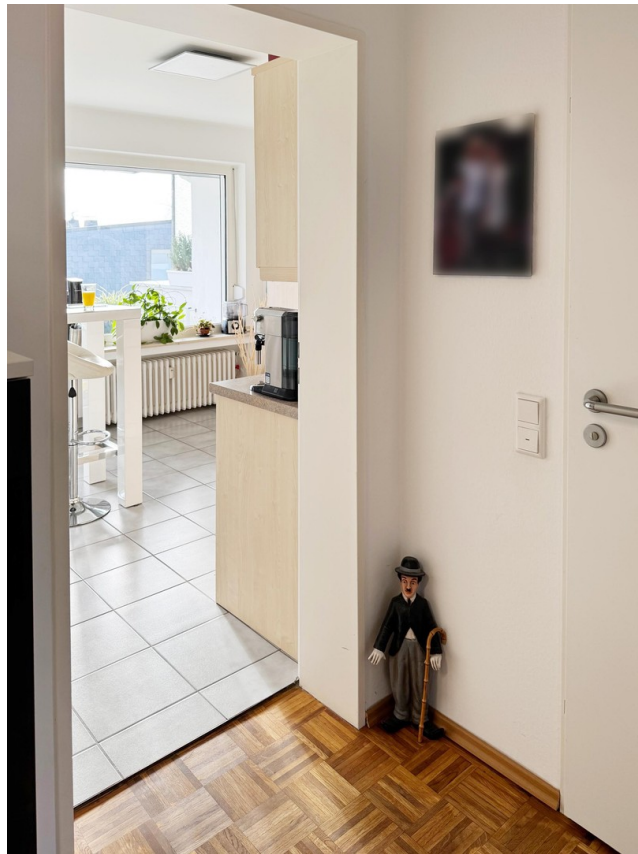
Diele Blick Küche