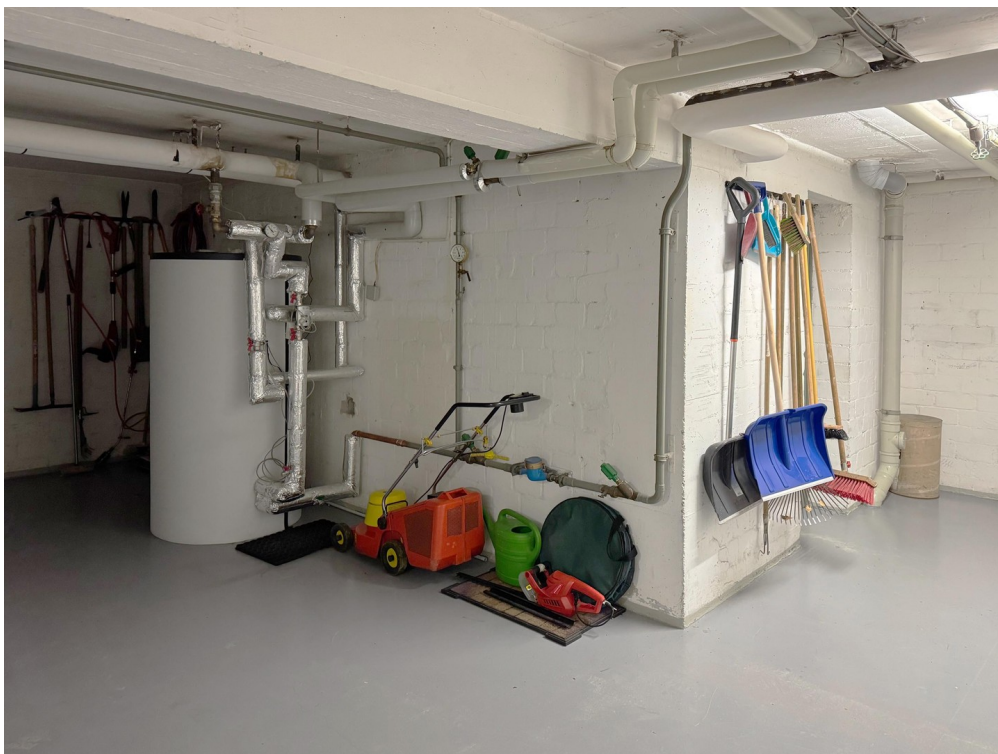
Top gepflegter Kellerbereich