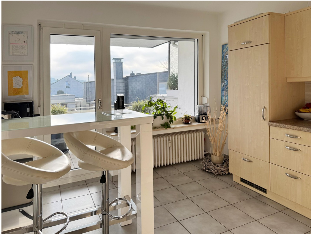
Küche Blick Balkon