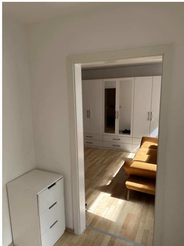
Blick von Flur in Wohnbereich