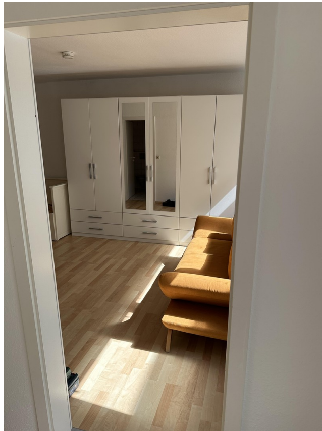
Blick von Flur in Wohnbereich