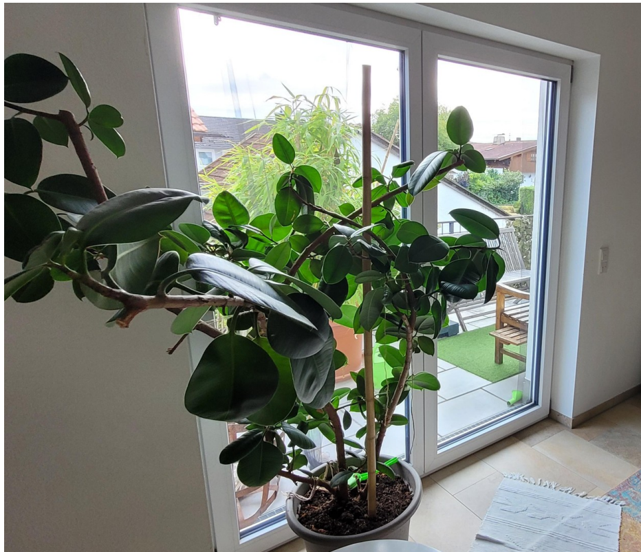
Blick auf Südbalkon