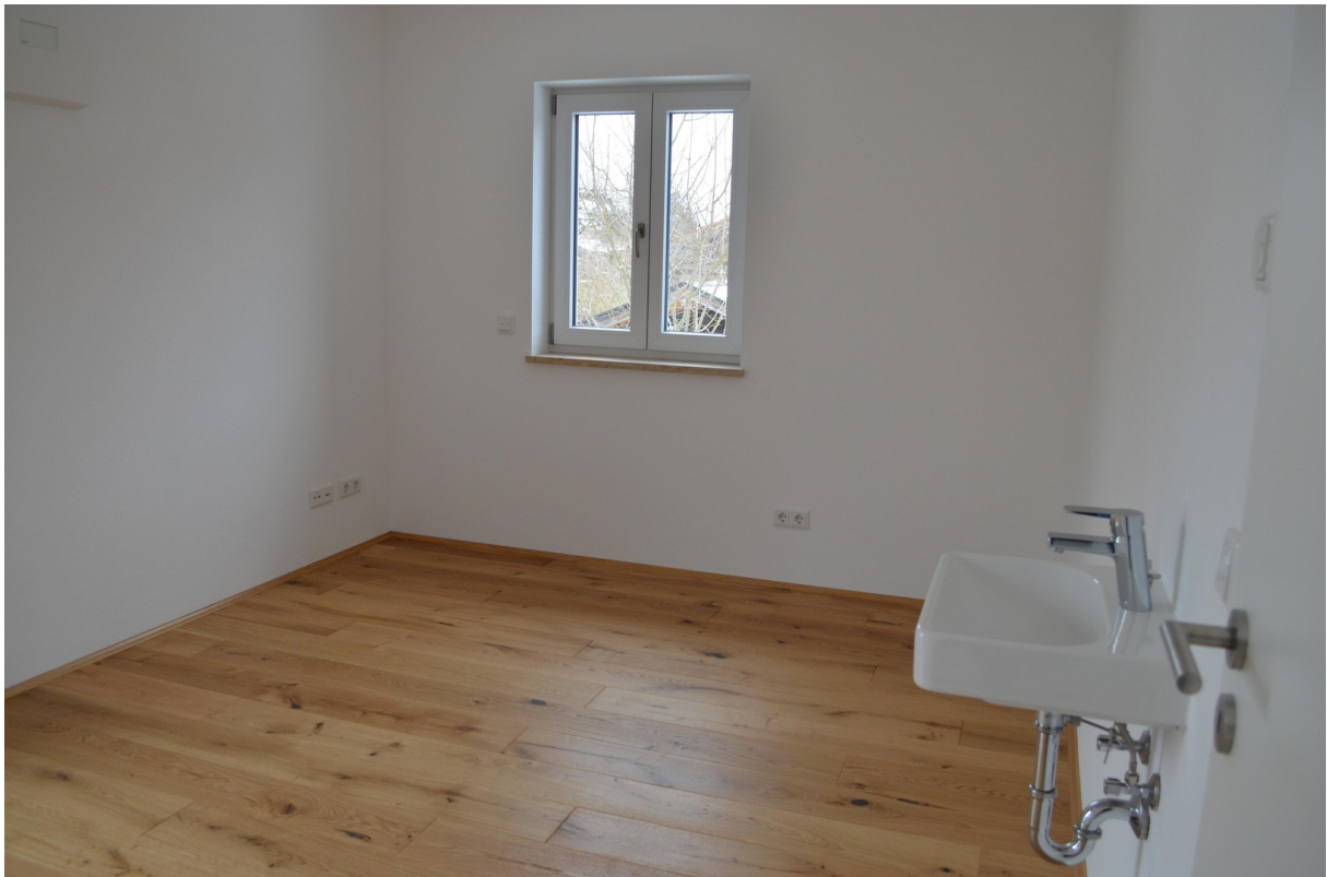
Ein von zwei Schlafzimmer