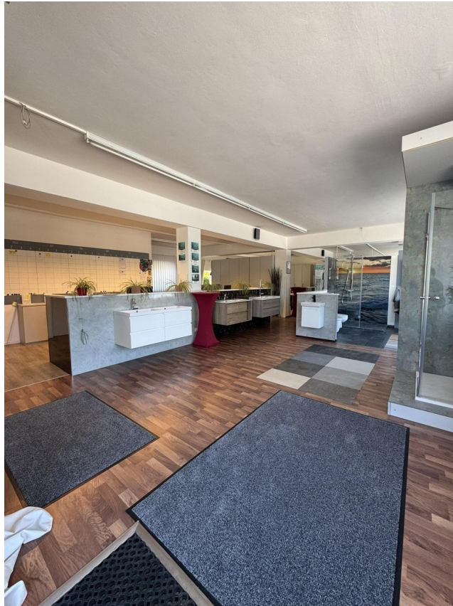
Ladenfläche EG Ansicht 1