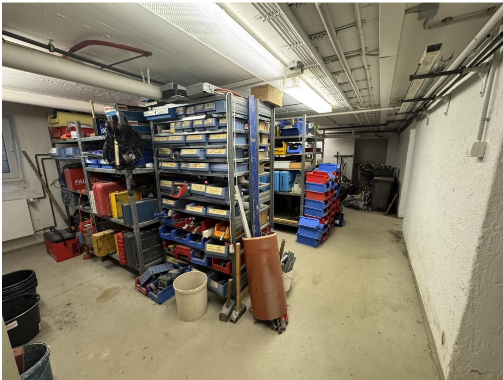
Lagerfläche im UG