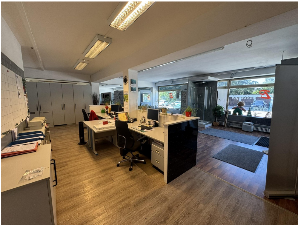
Ladenfläche EG Ansicht 2