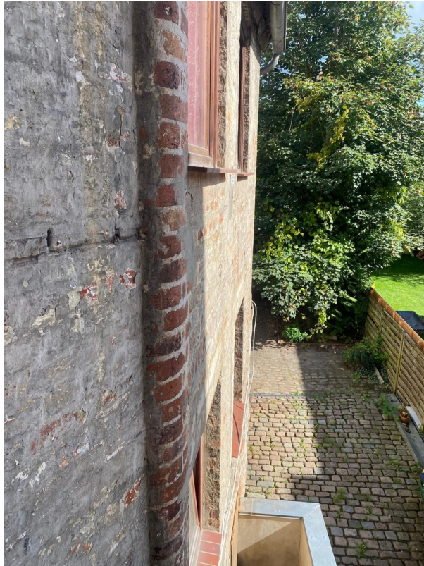
Blick zum Garten