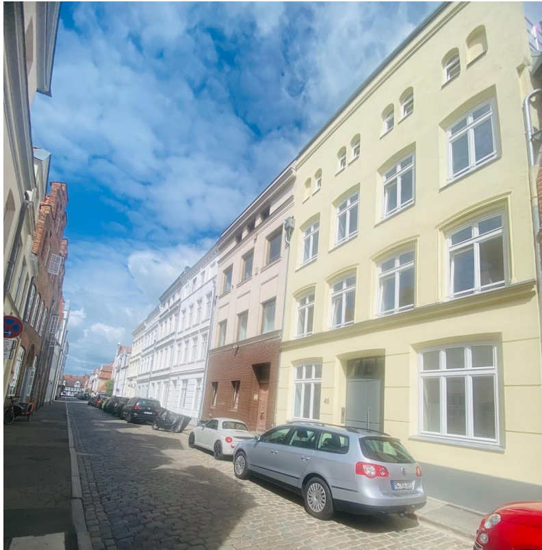
Altstadt von Lübeck