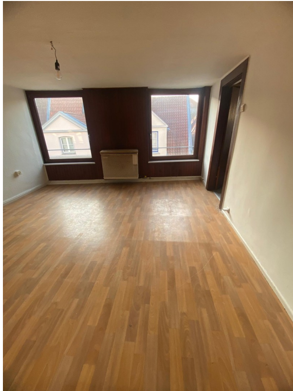
Blick zur Straße