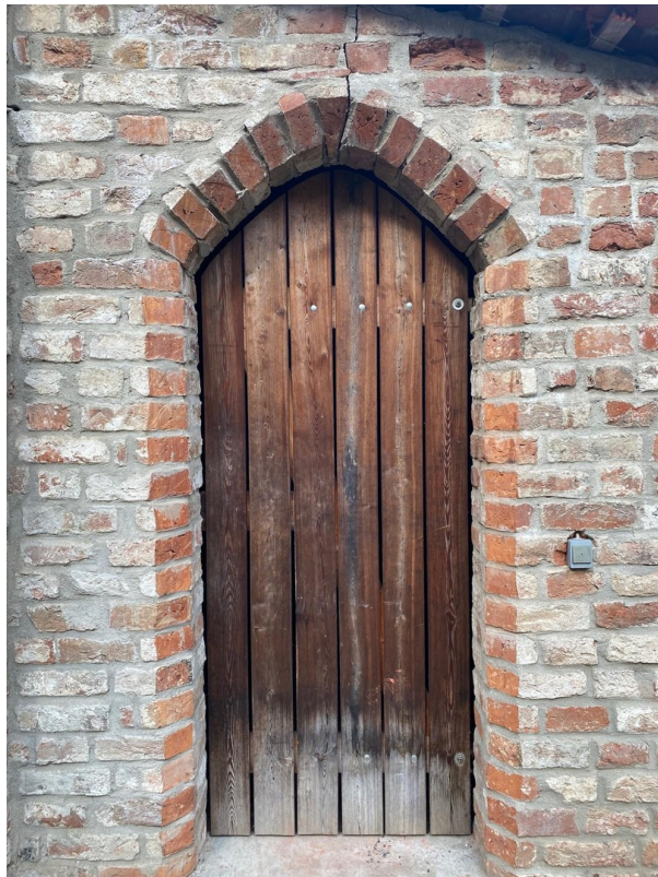
Fahrradunterstand im Garten