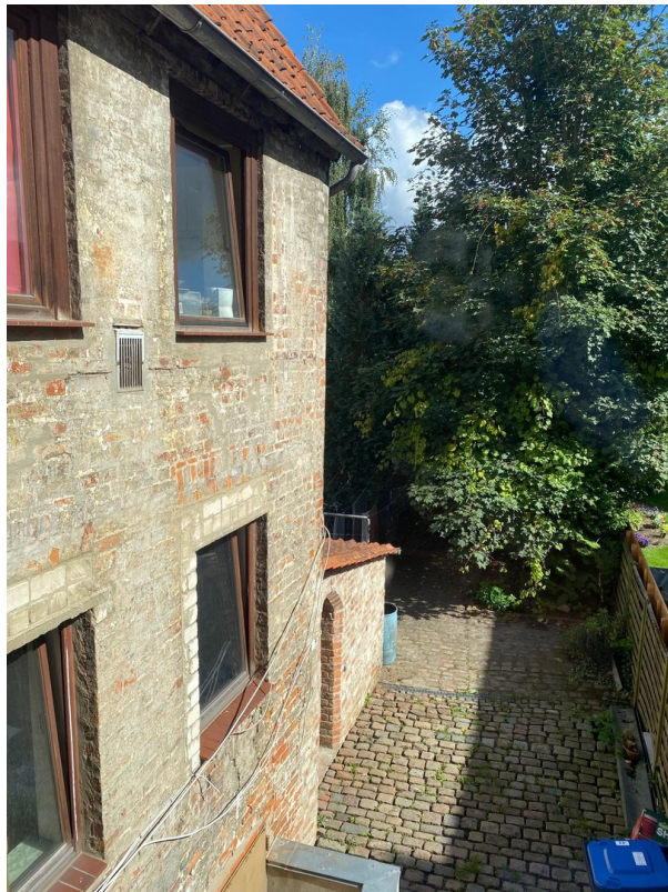
Blick zum Garten