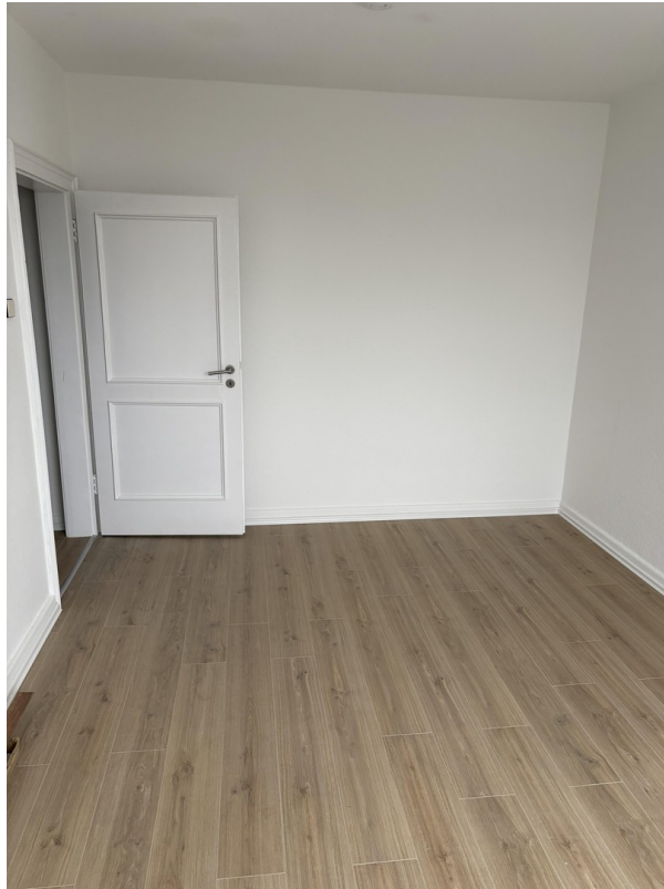
Zimmer 1 (Bild 2)