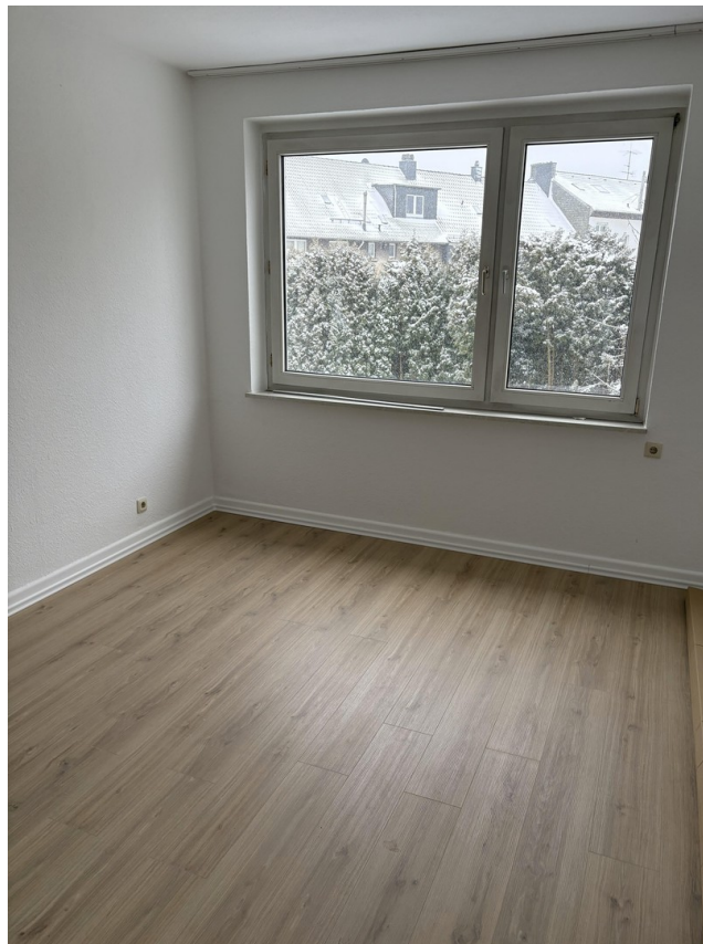
Zimmer 1 (Bild 1)