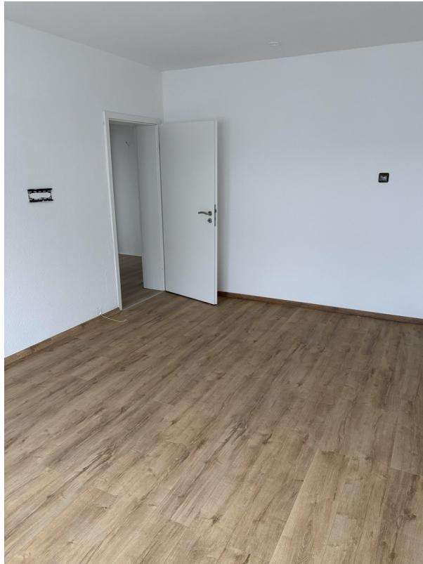
Zimmer 3 (Bild 2)