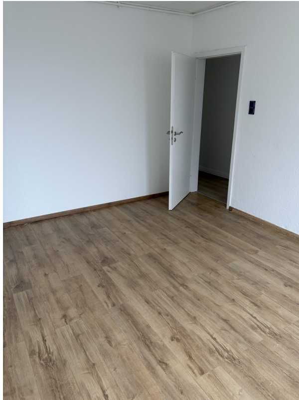
Zimmer 2 / Wohnküche (Bild 2)