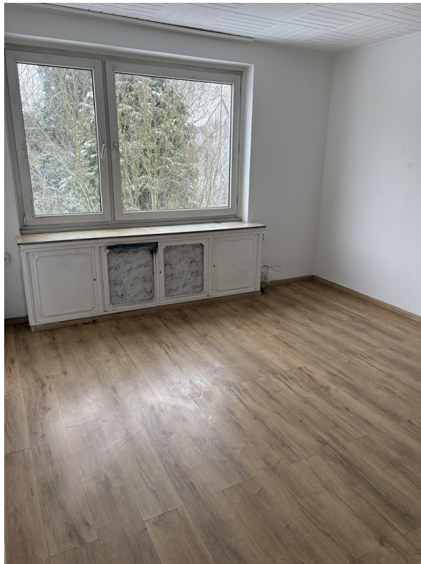
Zimmer 2 / Wohnküche (Bild 1)