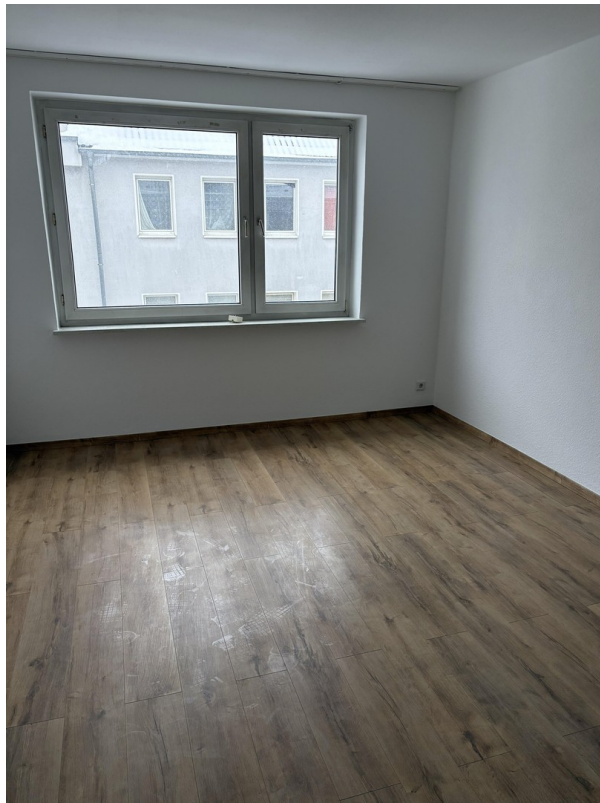
Zimmer 3 (Bild 1)