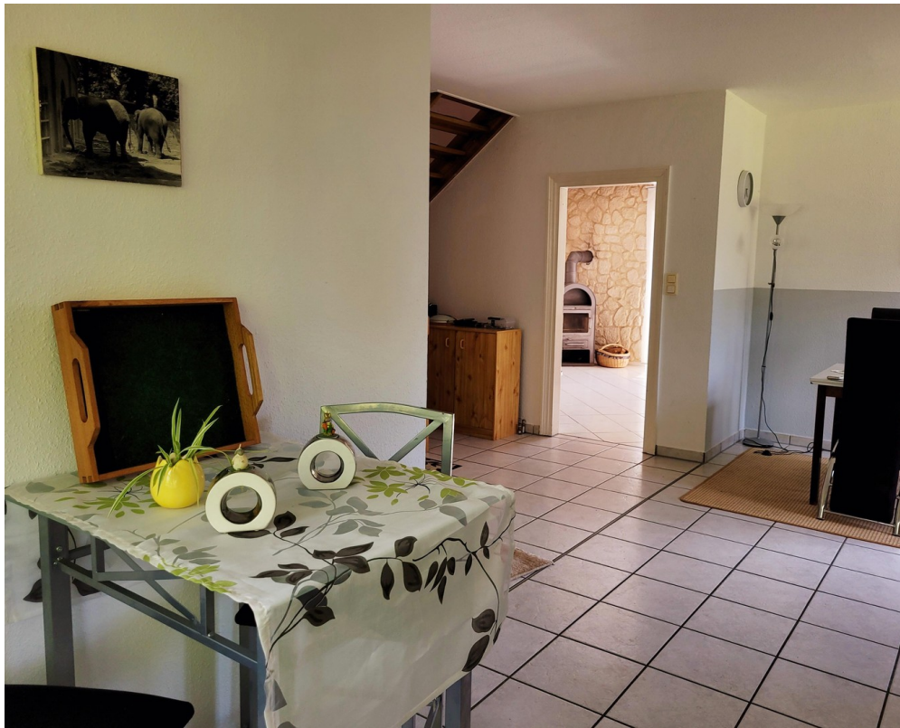
Sitzplatz in der Küchenecke