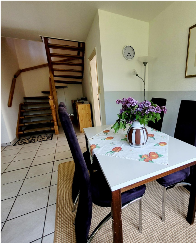
Essbereich und Treppenhaus