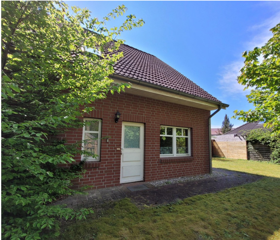
Nordseite mit Hauseingang