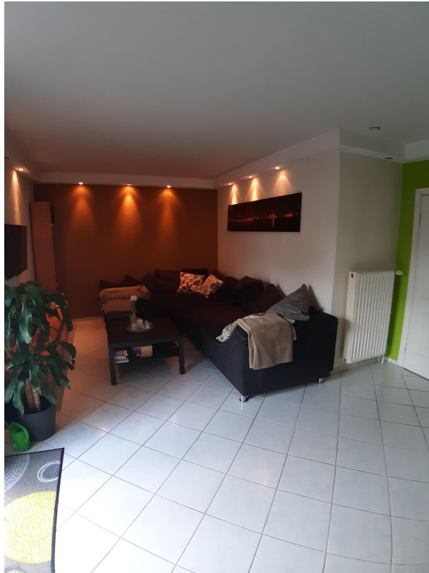
Sofaecke im Wohnzimmer