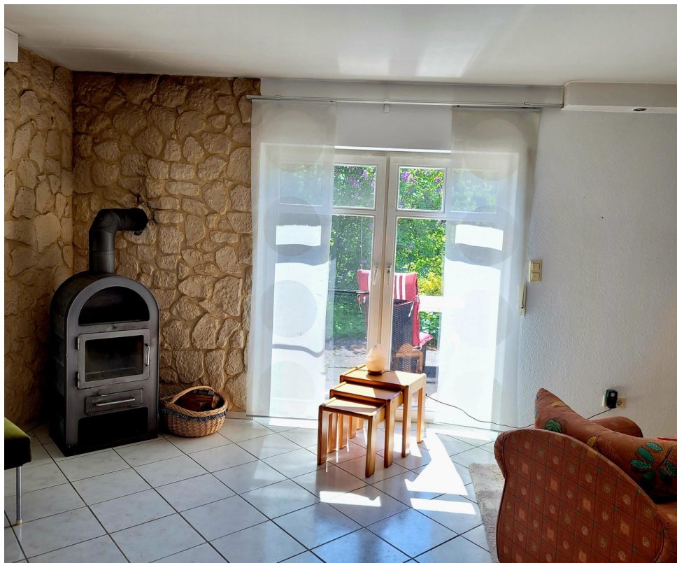
Kaminofen im Wohnzimmer