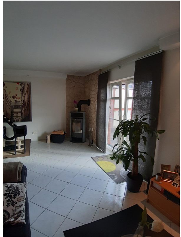
Wohnzimmer mit Terrassentür