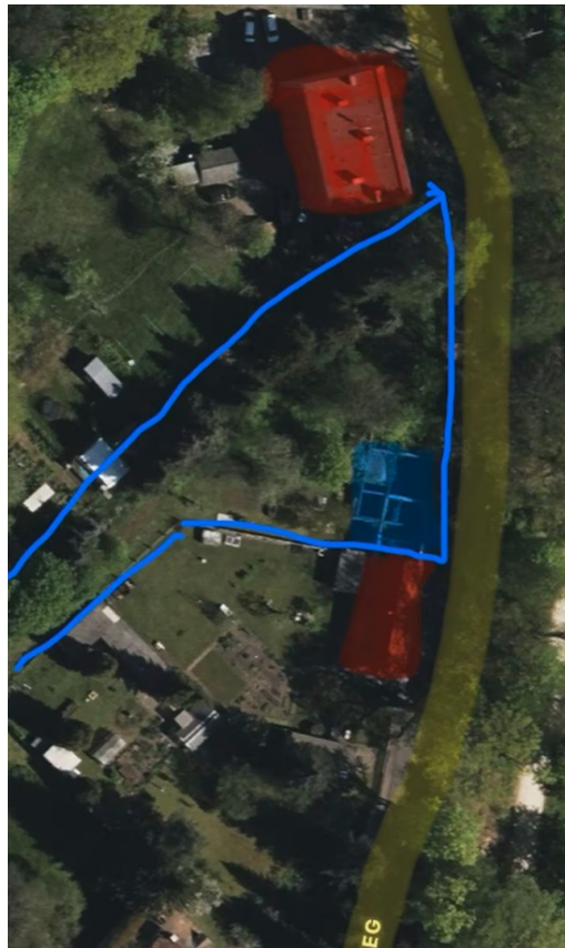
gelb Uferweg, blau Grundstück