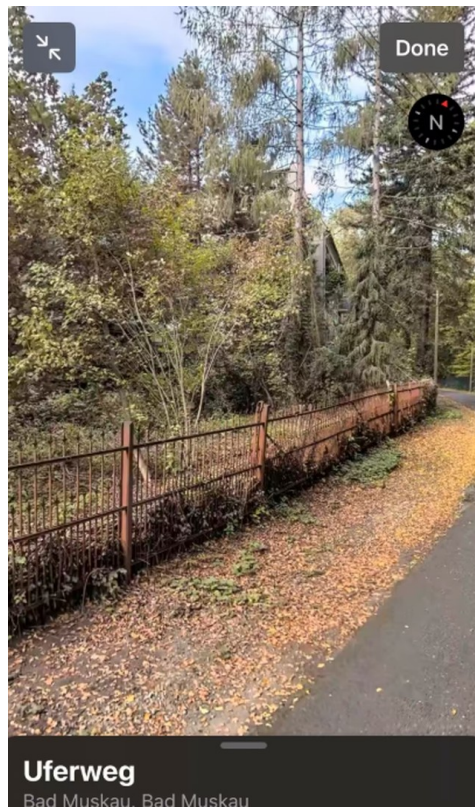
Straßenansicht Blick Norden