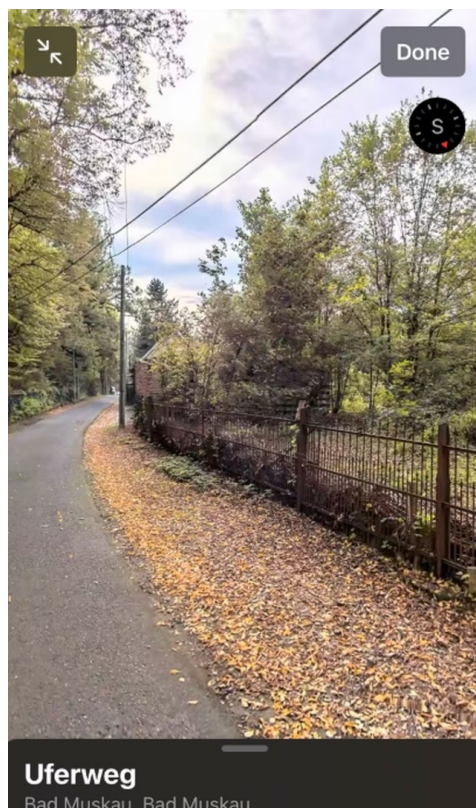
Straßenansicht Blick Süden