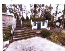
Grundstücksansicht vom See aus