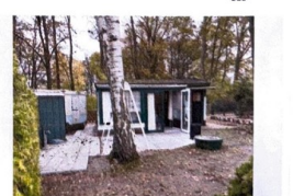
Bungalow, WC, Haus, Wohnweg