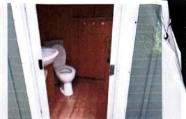
WC mit Waschbecken