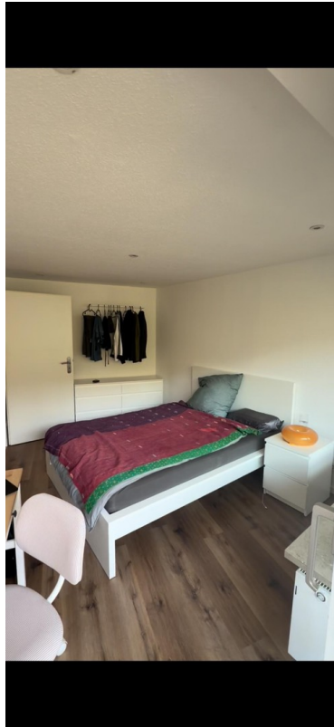
Zimmer 1 mit Balkon