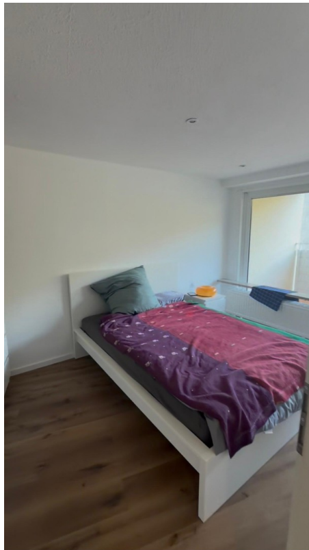
Zimmer 1 mit Balkon