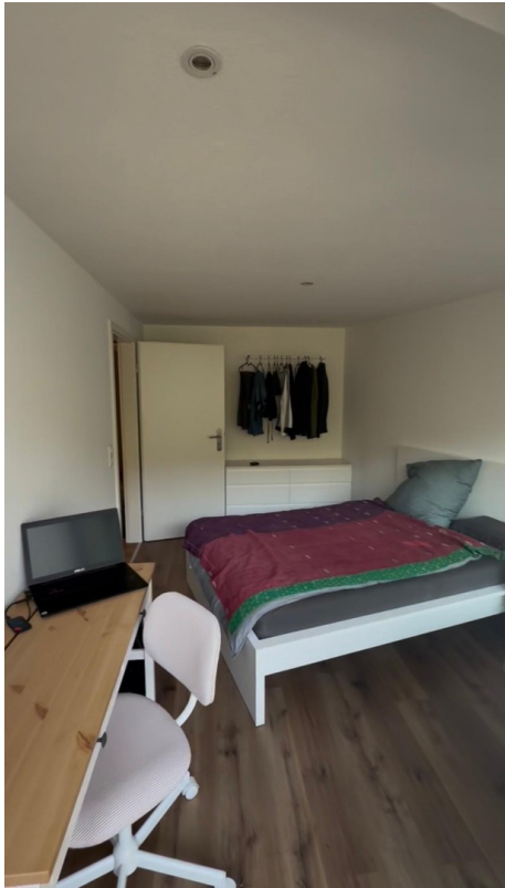
Zimmer 1 mit Balkon