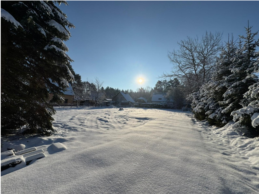
Grundstück (Stand 01/2026)