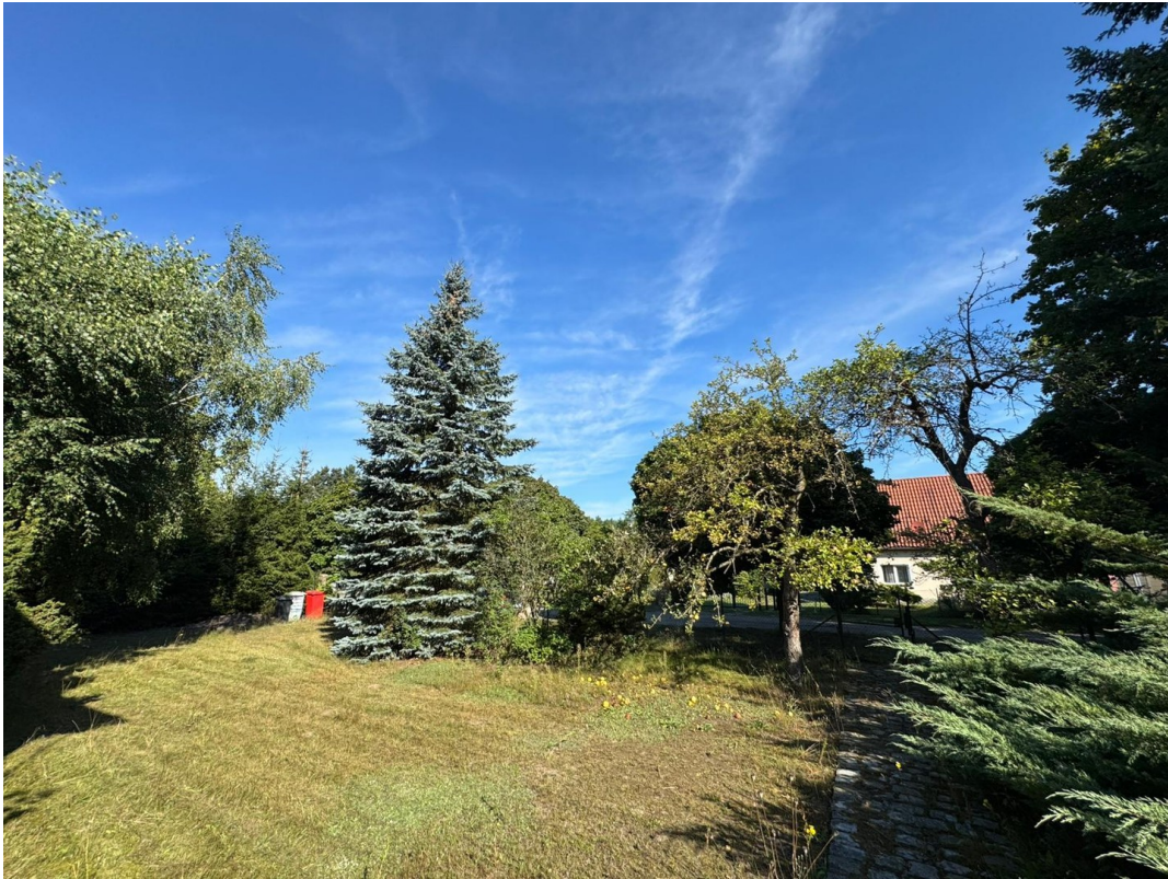
Garten (Stand 09/2025)