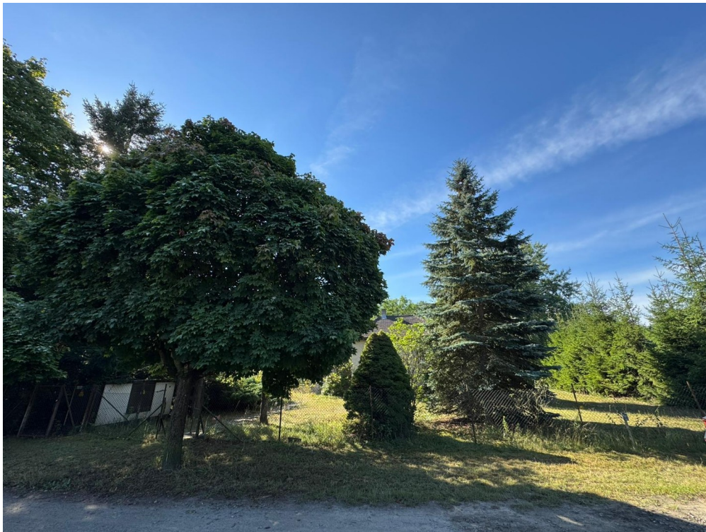
Außenansicht Straße (09/2025)