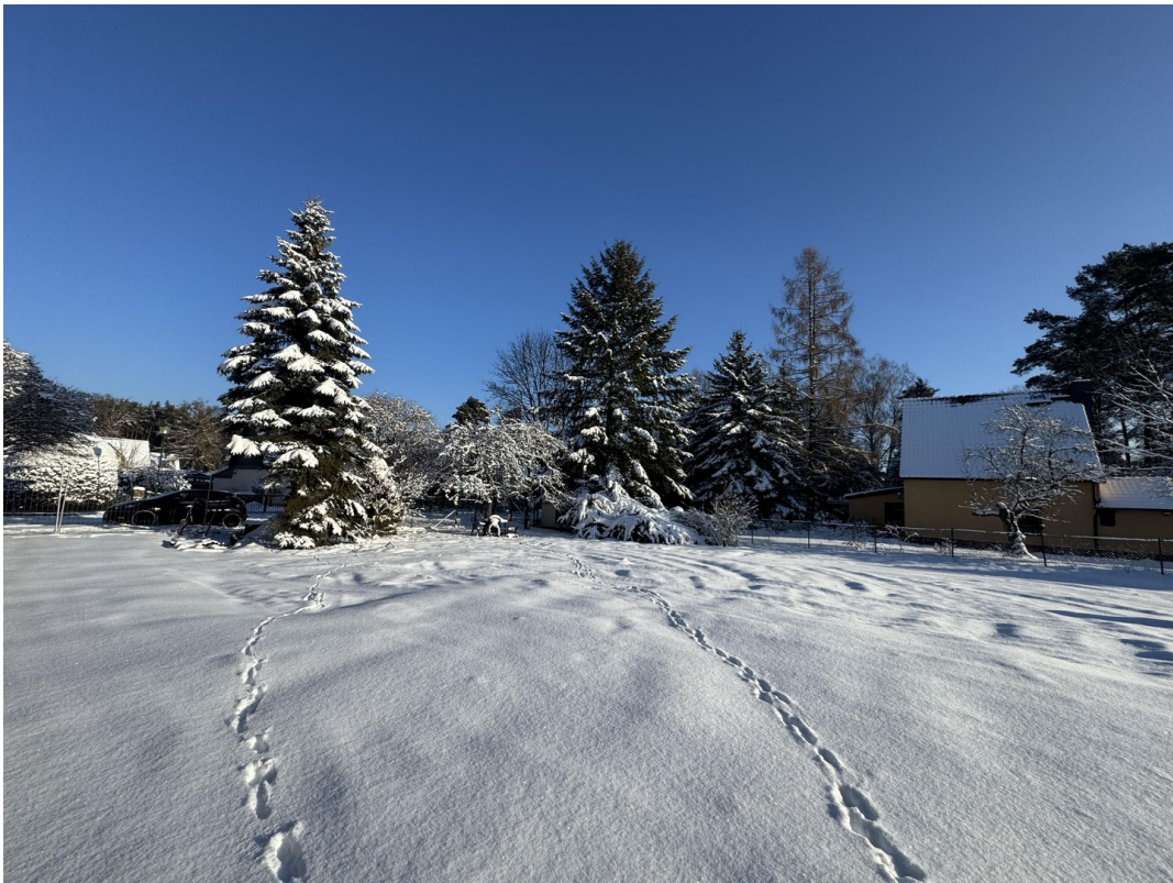
vord. Grundstück (01/2026)