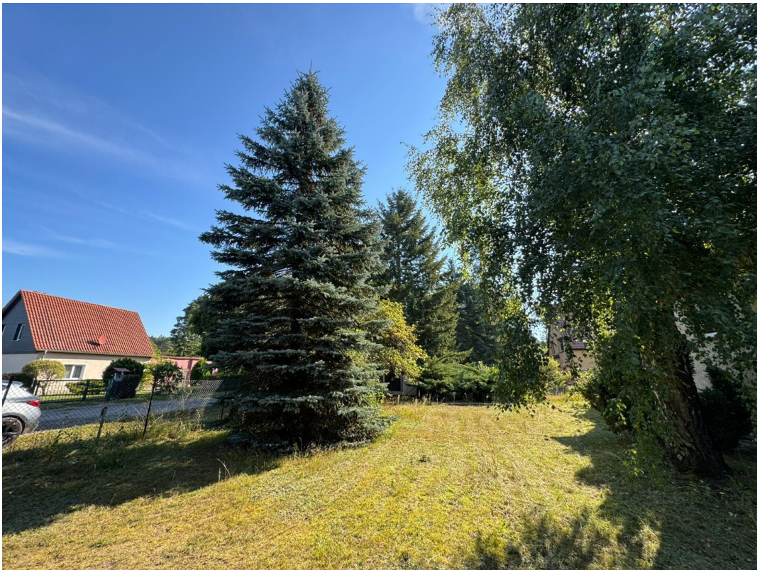
Garten (Stand 09/2025)