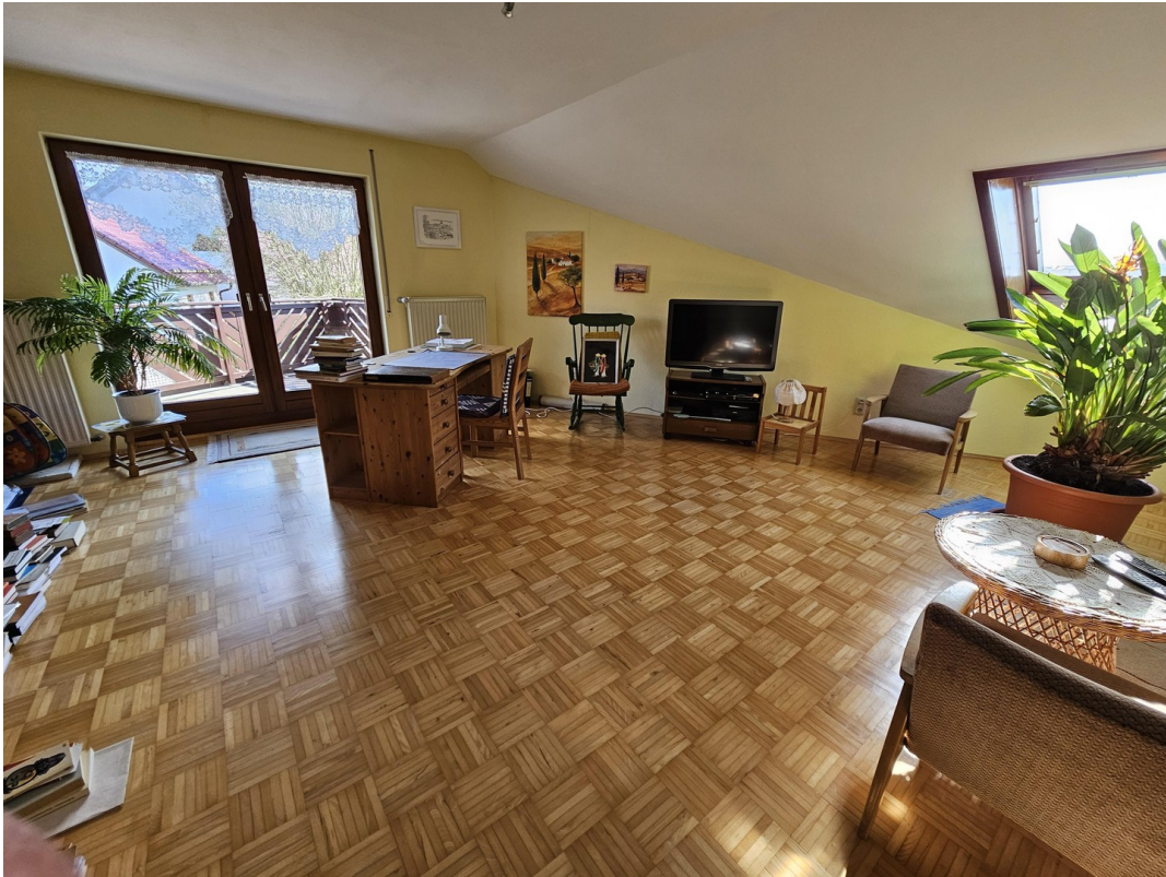
OG Schlafzimmer /Wohnzimmer