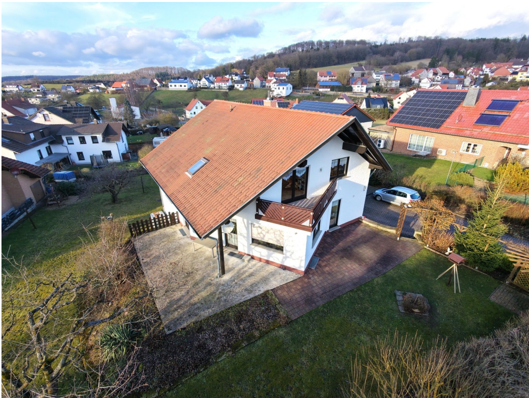
Freisitz und Balkon