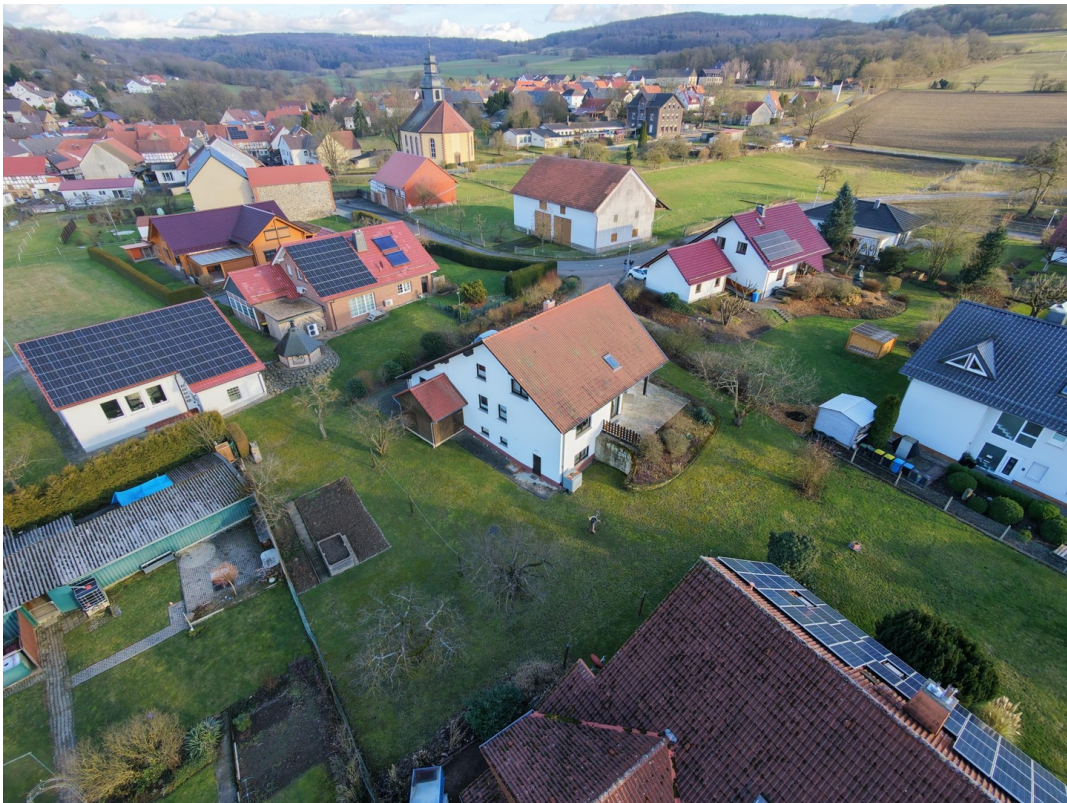
Lage und Ortsanbindung aus der