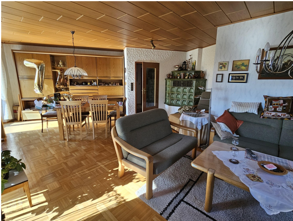
Wohnzimmer mit Kachelofen