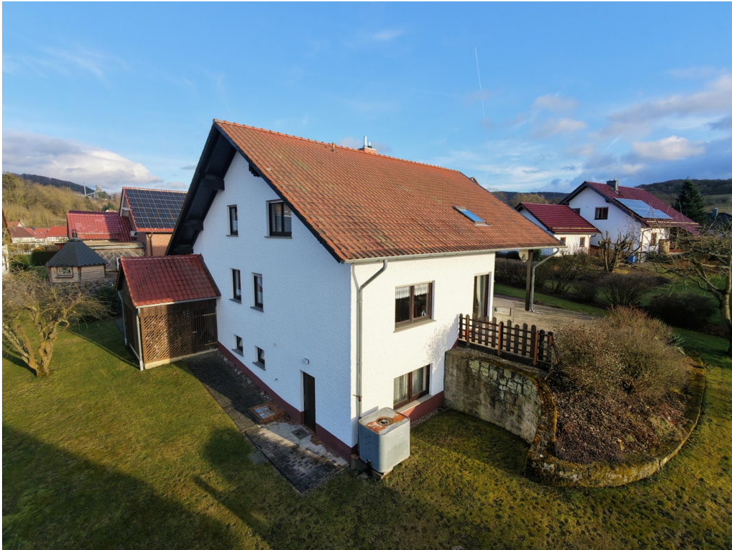
Hausfassade /Holzstall /Garten