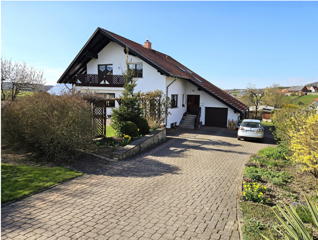
Hofeinfahrt / Hof