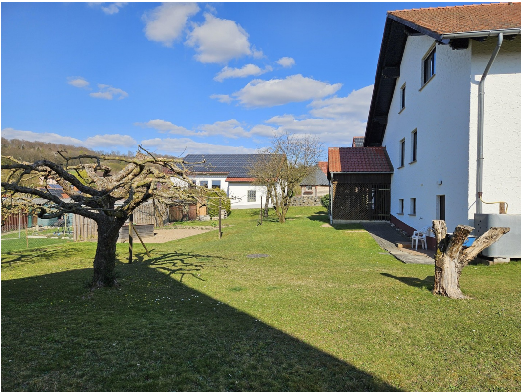
Teile des Gartens