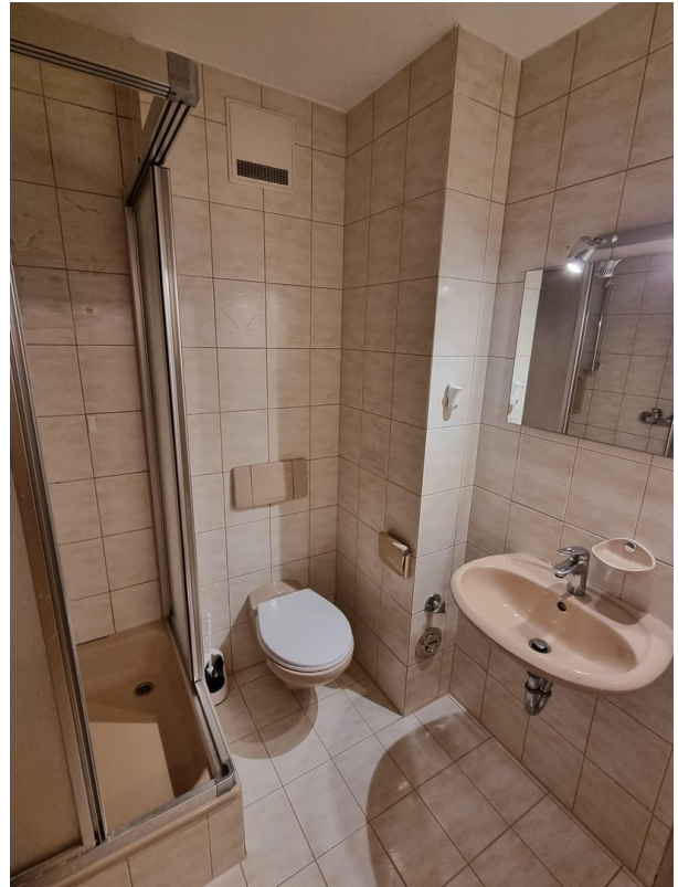
Kleines Bad mit Dusche/WC