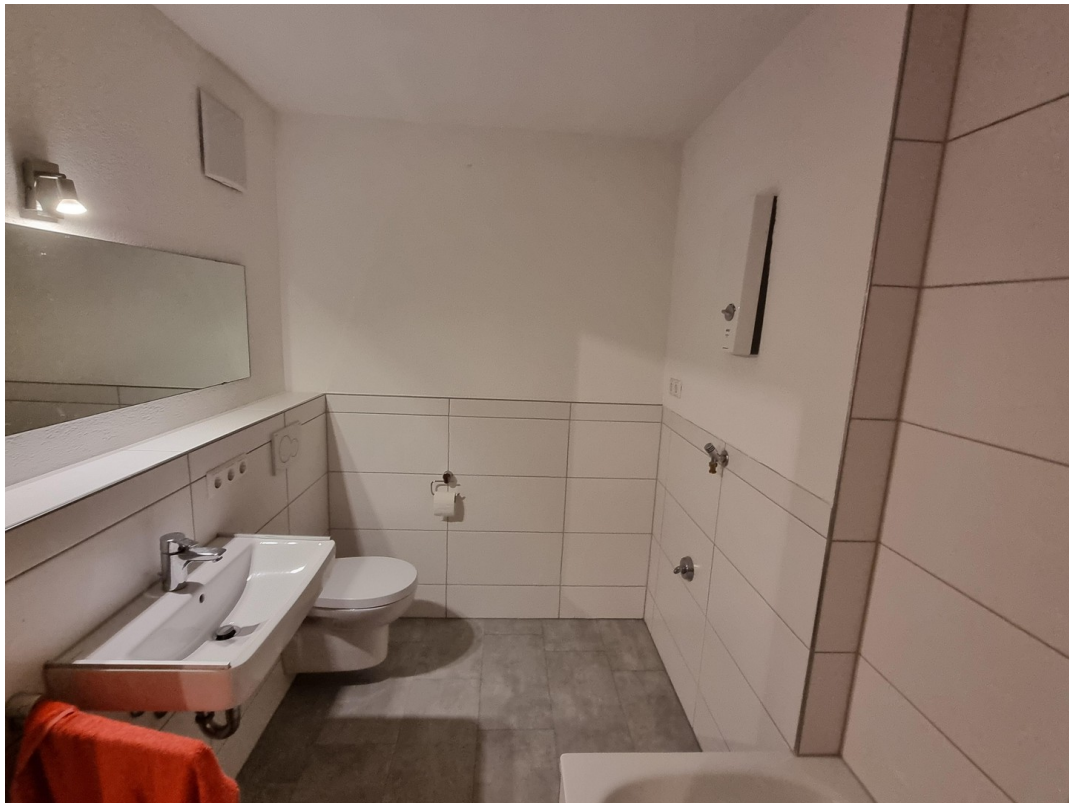
Großes Bad mit Badewanne/WC