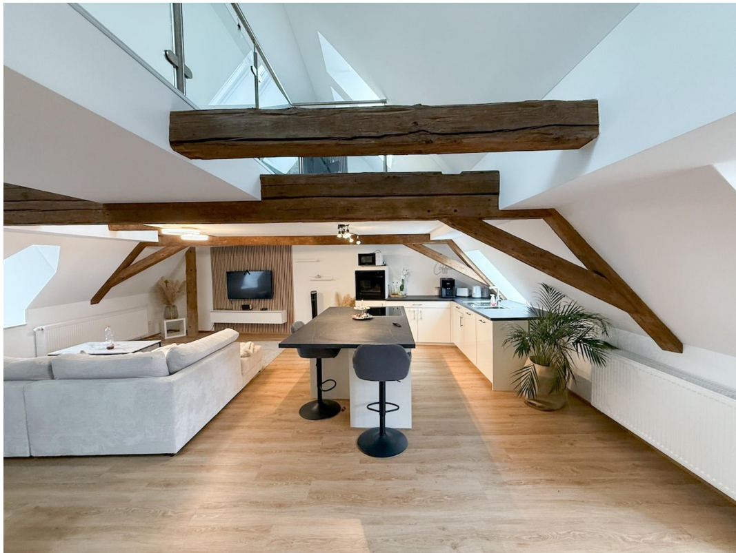
Einbauküche und Wohnbereich