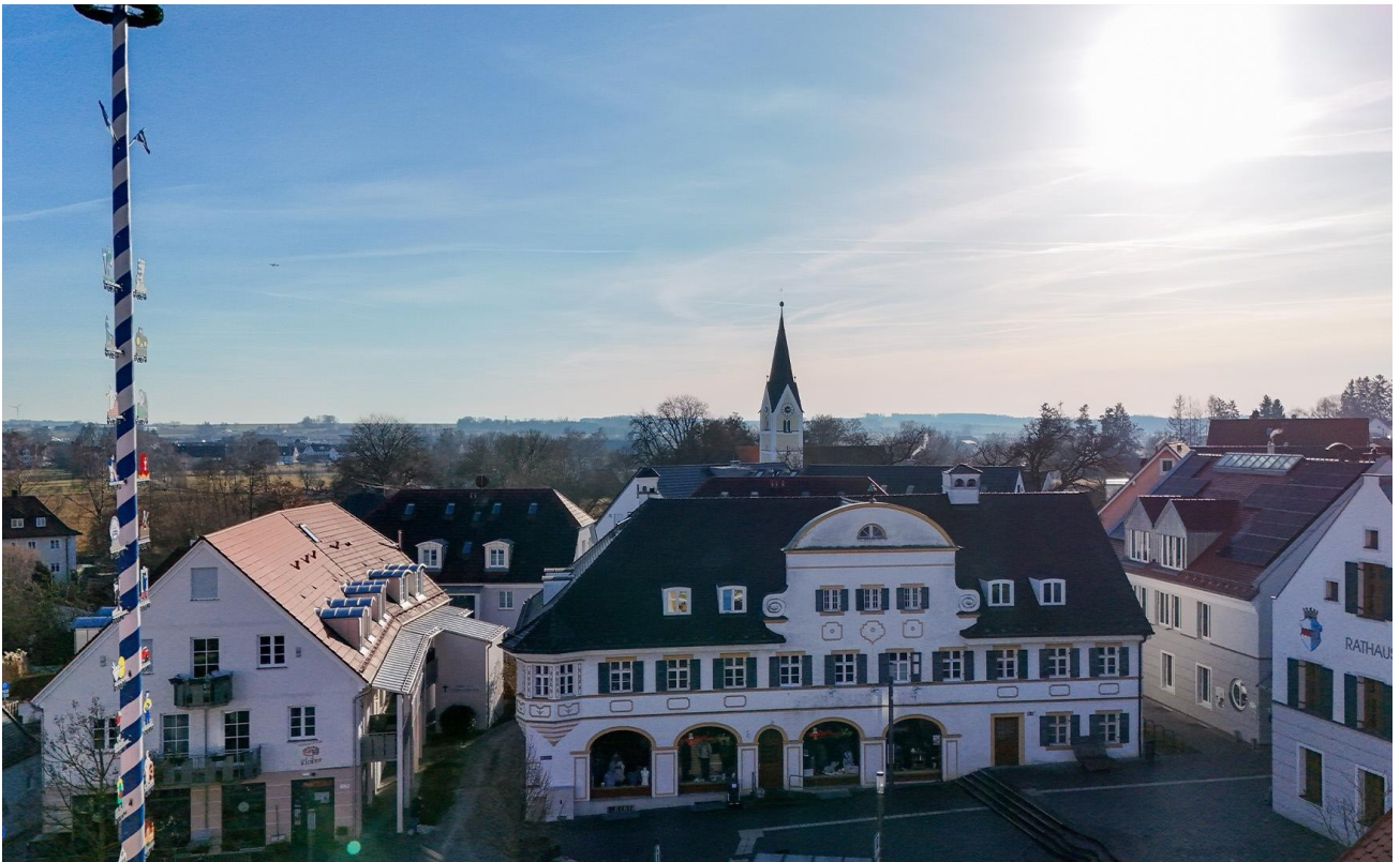
Blick auf Marktplatz