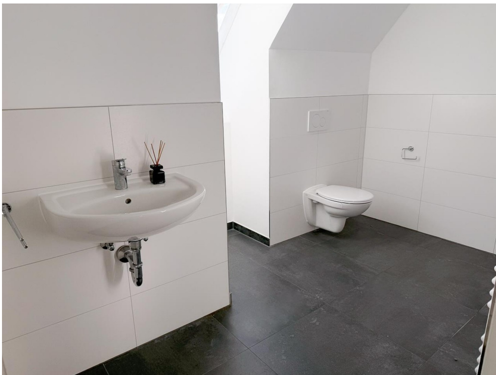
Gäste - WC