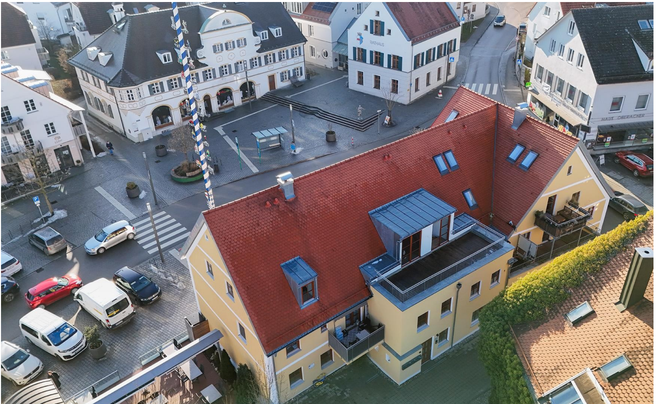
Luftbild Gebäude & Marktplatz