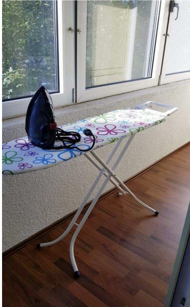
Wintergarten ausgebaute Loggia