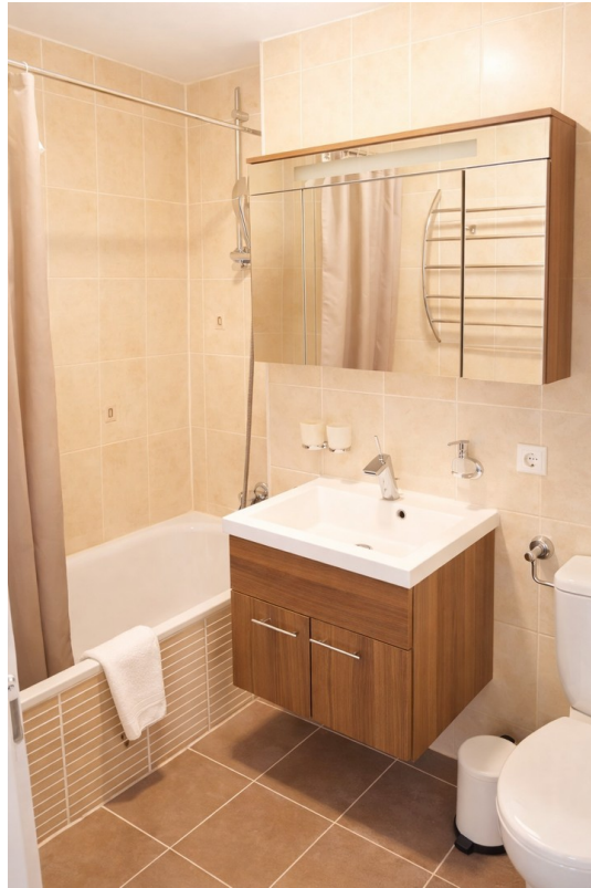
Bad mit Wanne, Spiegelschrank