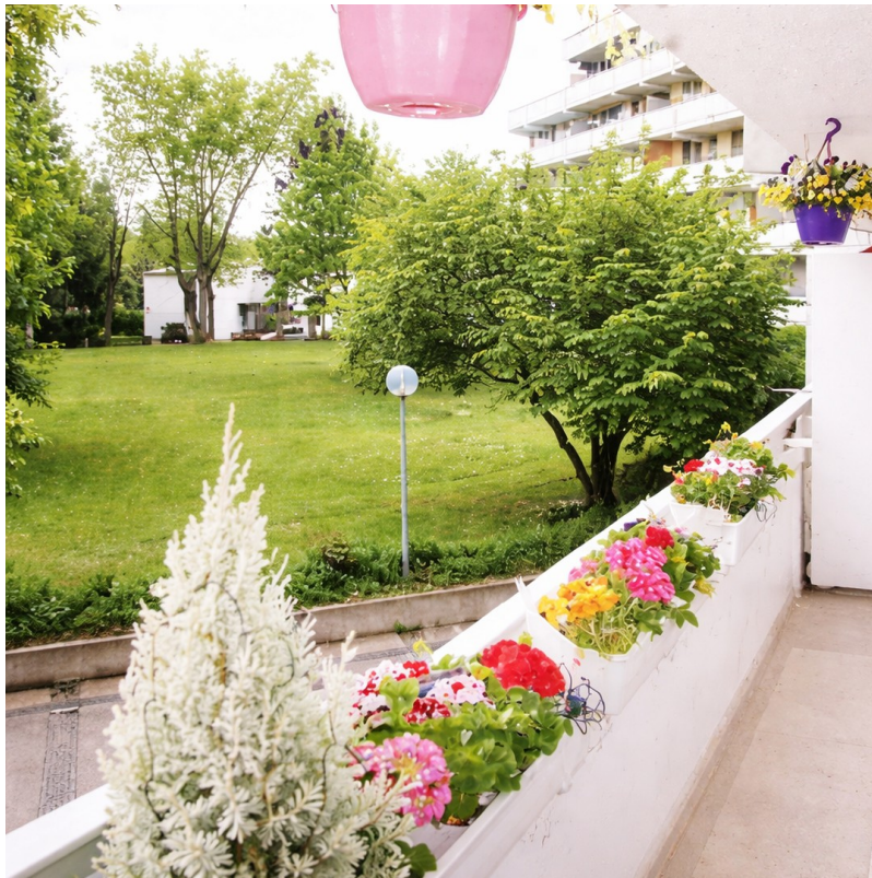
Balkon mit Blick „ins Grüne“