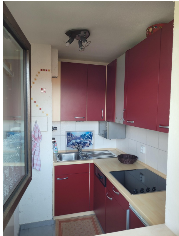
Küche vom Balkon