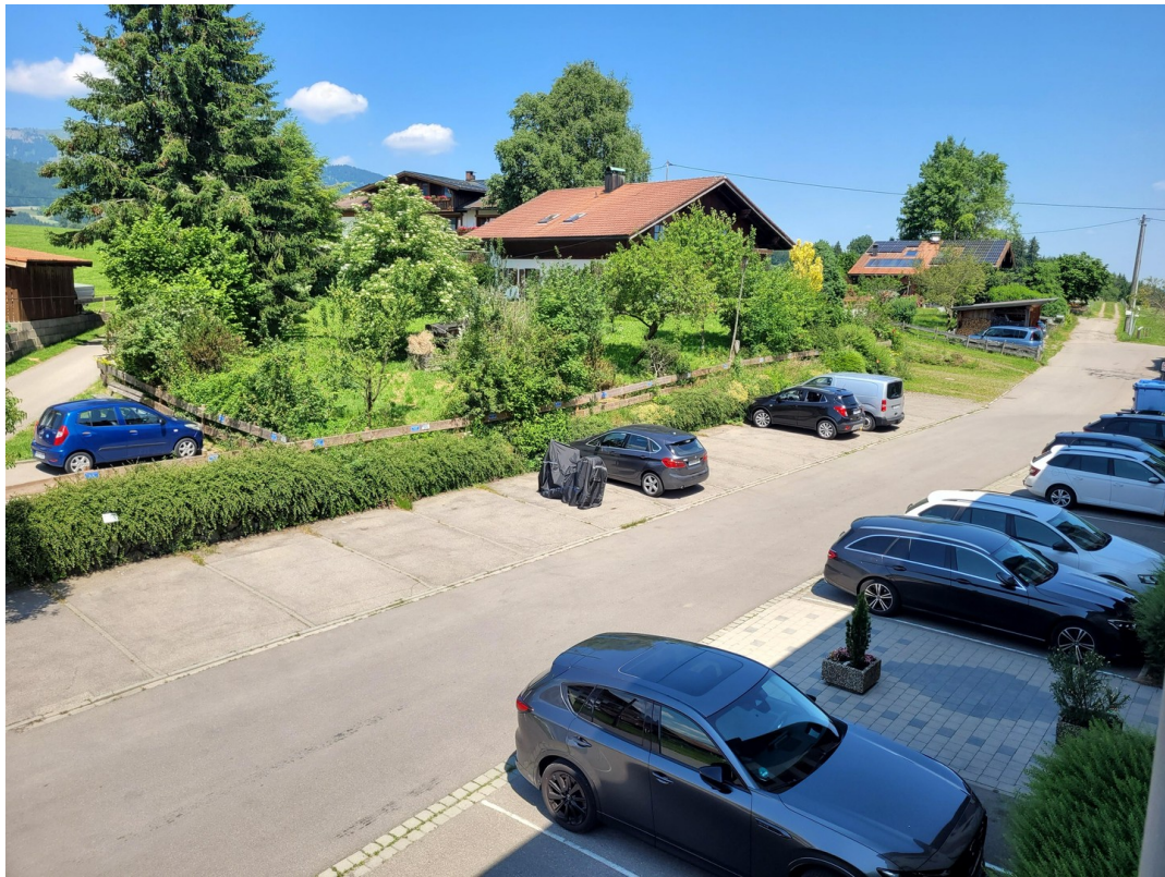
vor dem Haus