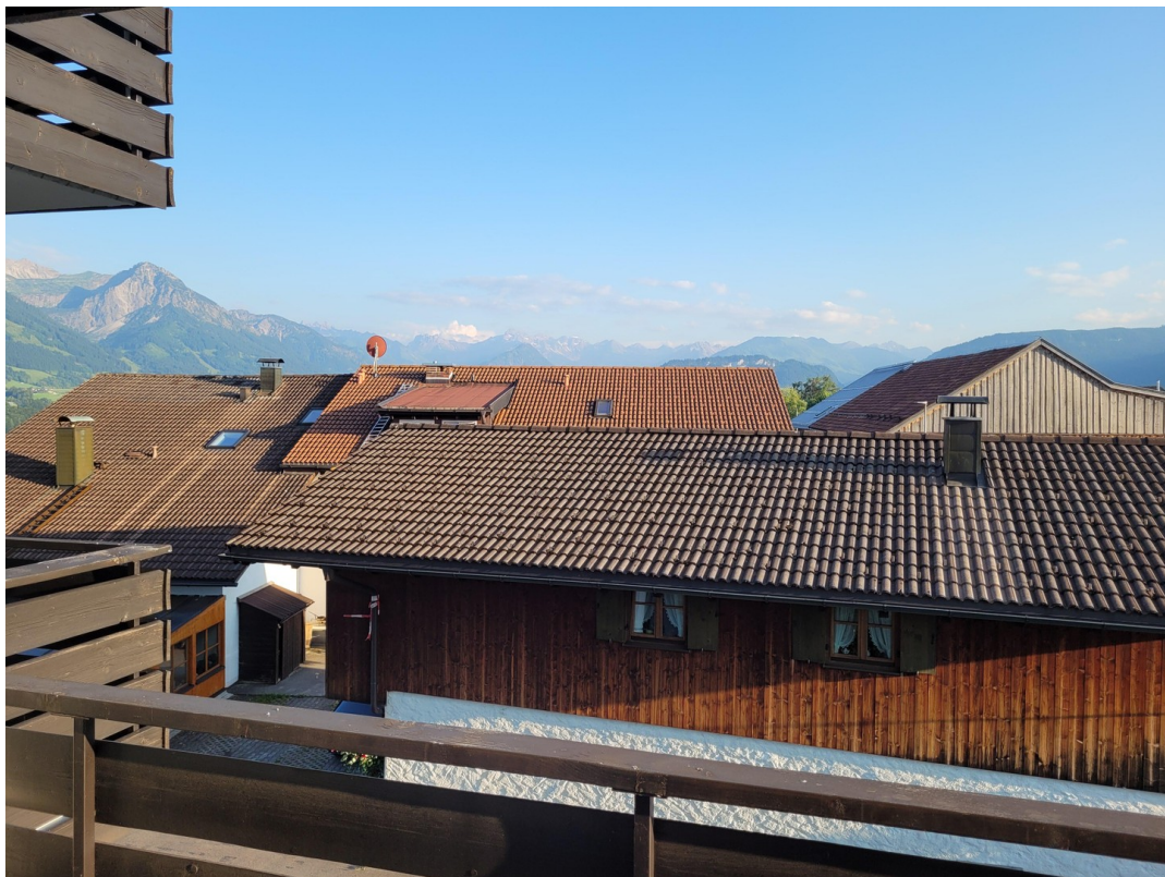
Aussicht Richtung Oberstdorf