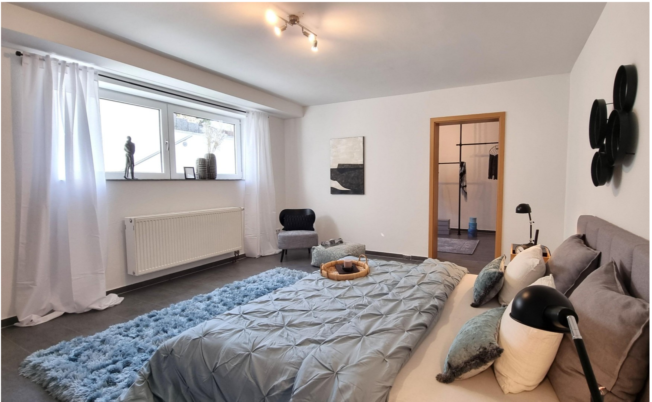
Schlafzimmer UG od. Wohnzimmer