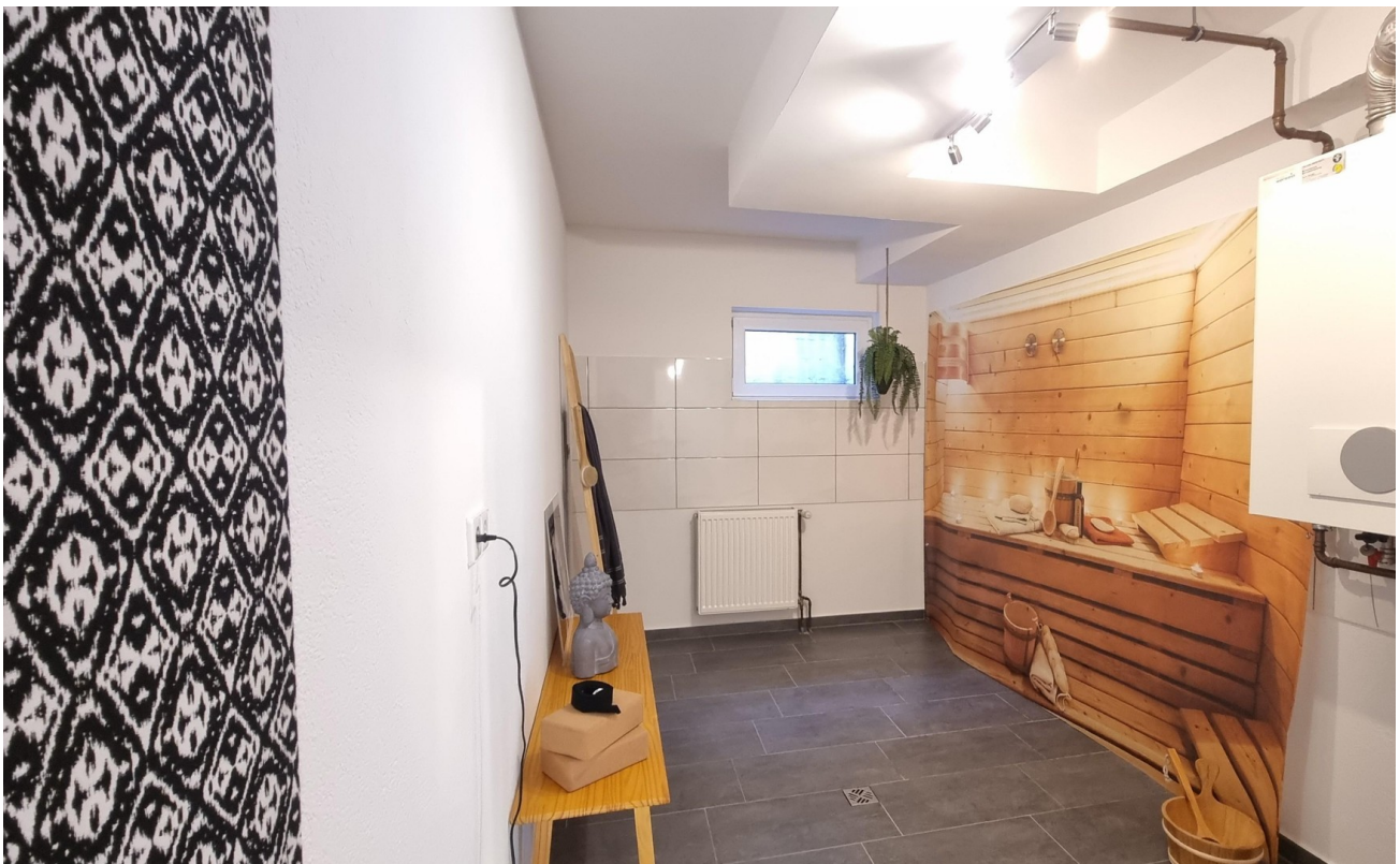
Küche UG oder angedachte Sauna