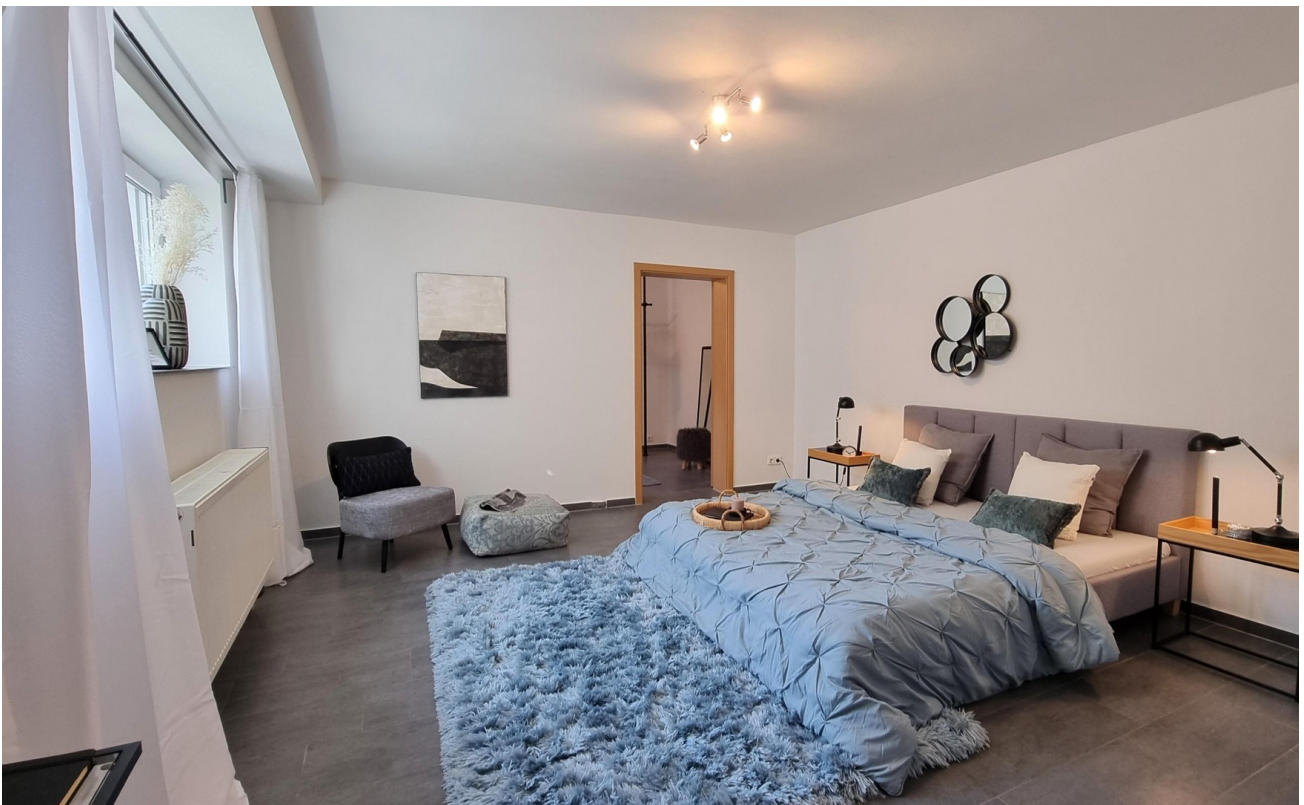
Schlafzimmer UG od. Wohnzimmer