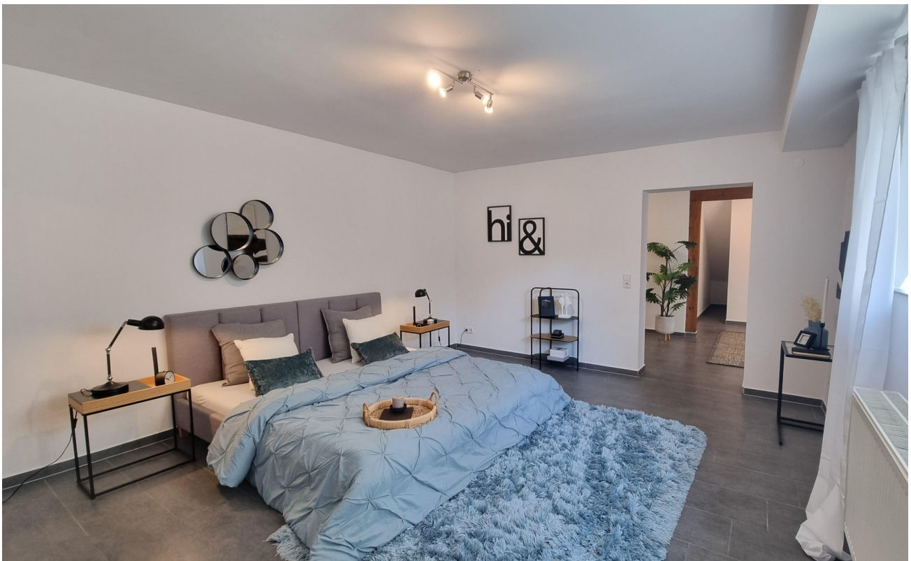
Schlafzimmer UG od. Wohnzimmer