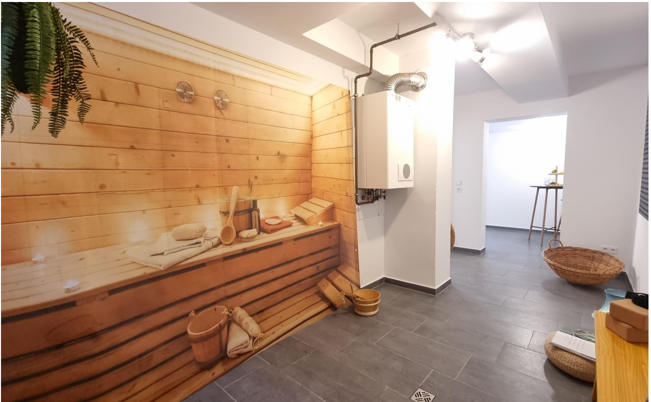
Küche UG oder angedachte Sauna