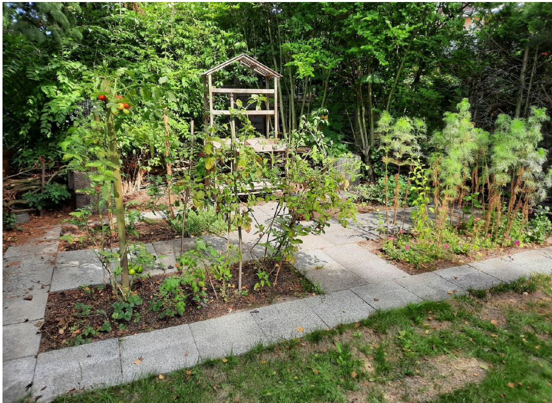
Gartenteil zur Alleinnutzung