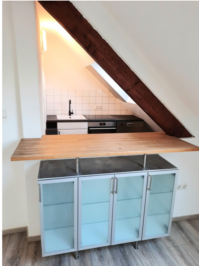
Blick in Küche