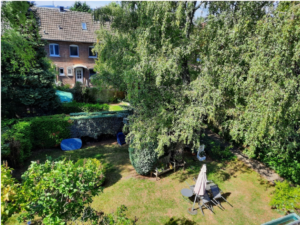
Ausblick aus der Wohnung