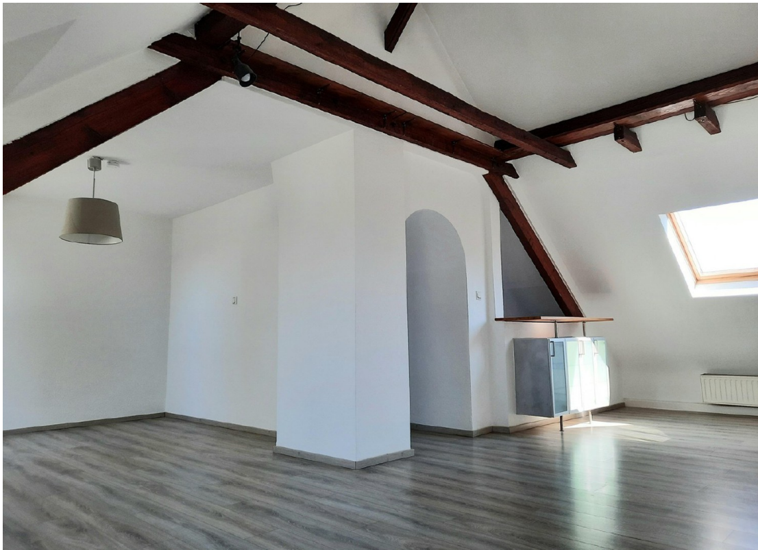
Wohnen - Essen