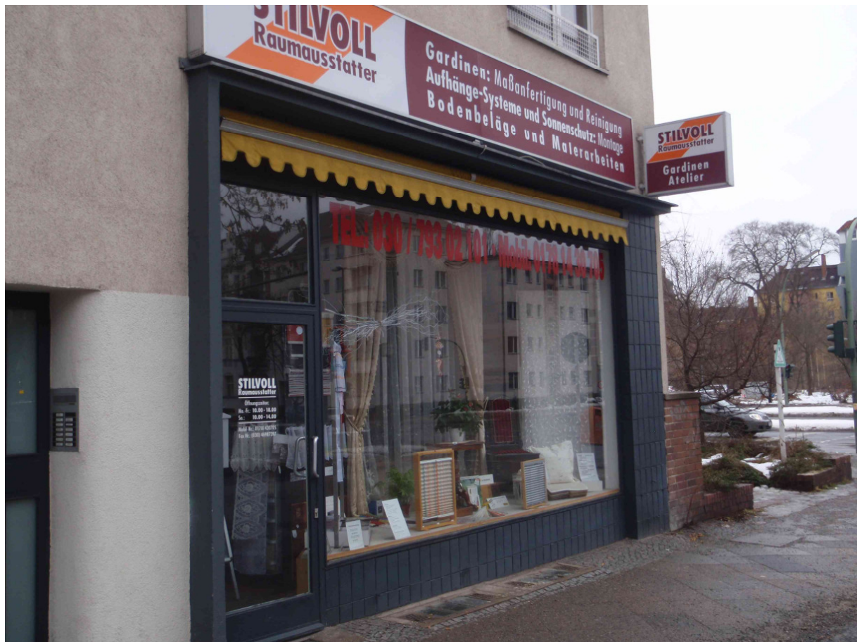
Teileigentum Nr. 3, Albrechtstraße 103, EG rechts, Außenansicht