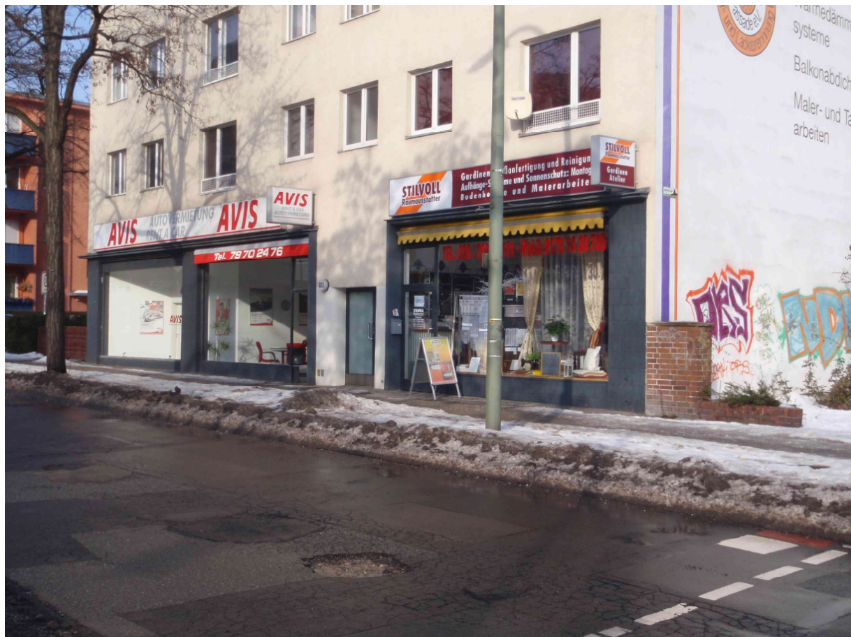
Vorderansicht EG Albrechtstraße 103