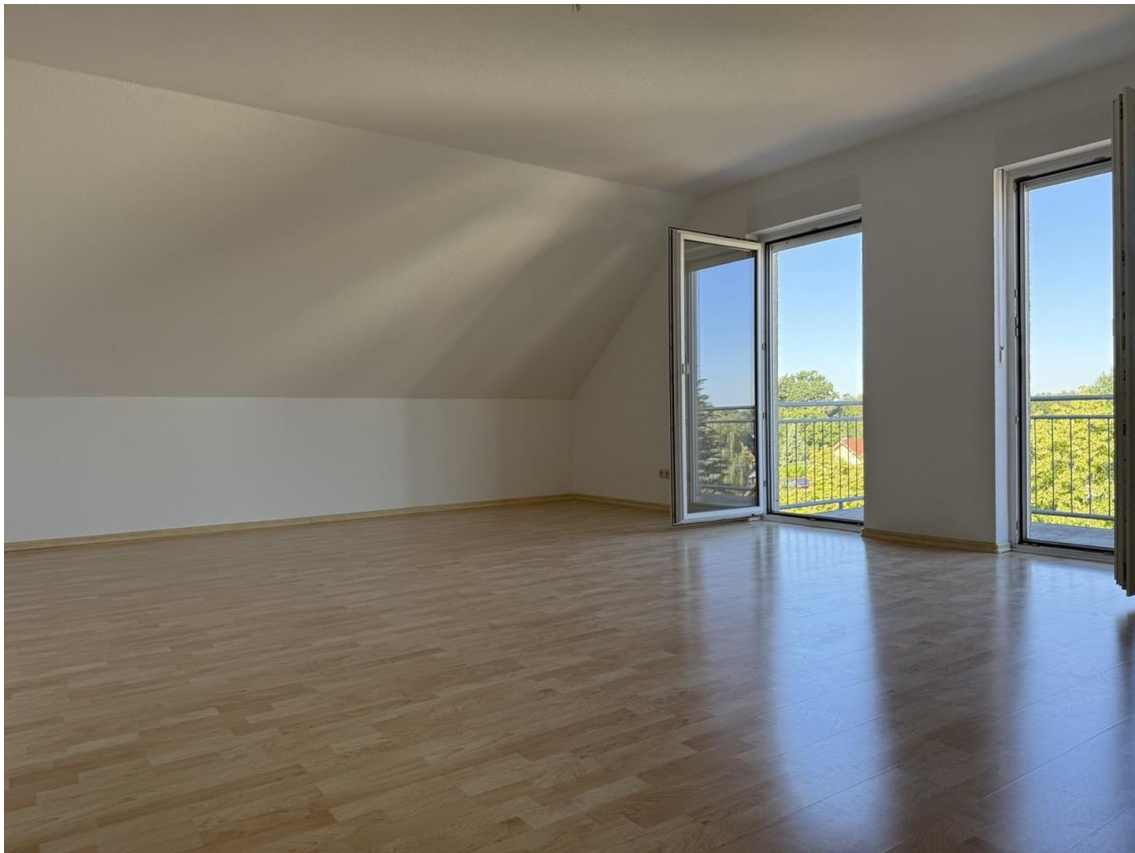
Wohn-/Essbereich mit Balkon