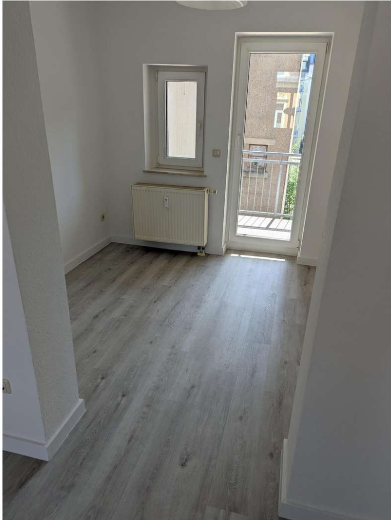
Blick zum Balkon