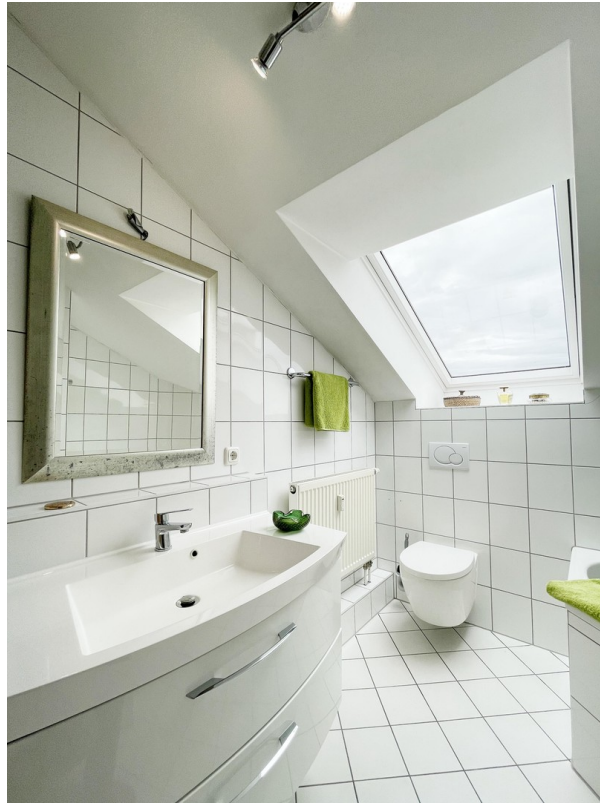
Bad nach Osten