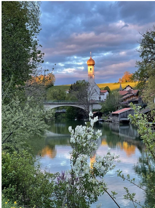
Traumhafte Lage am Tegernsee