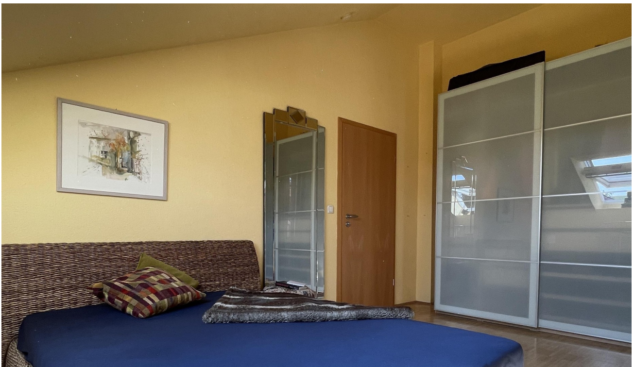
Schlafzimmer grosser Schrank