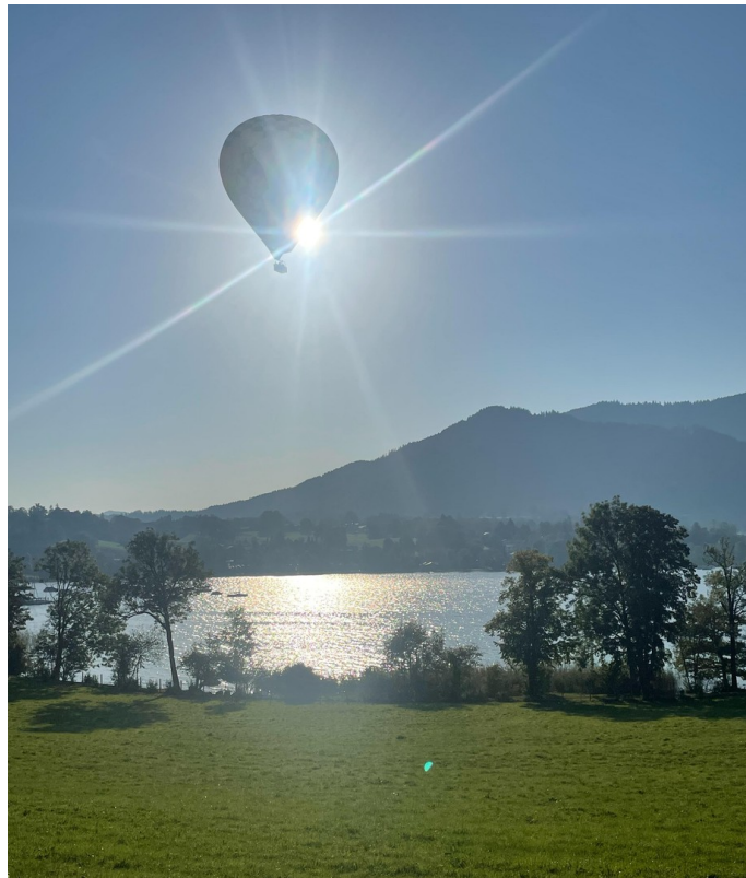
Weg Richtung Gut Kaltenbrunn