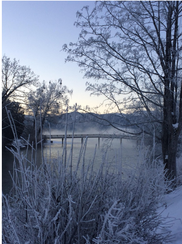
Spaziergang zum See