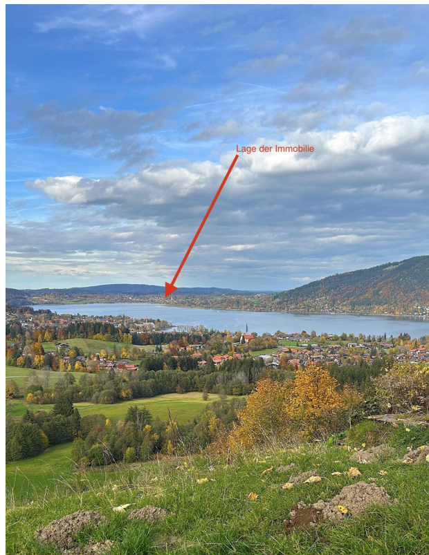
Lage der Wohnung