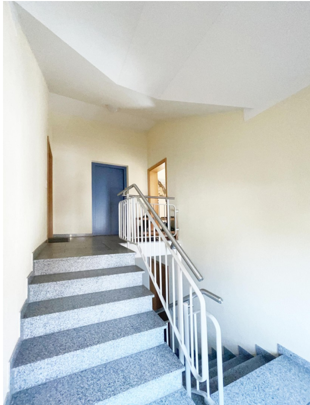
Treppenhaus zum OG