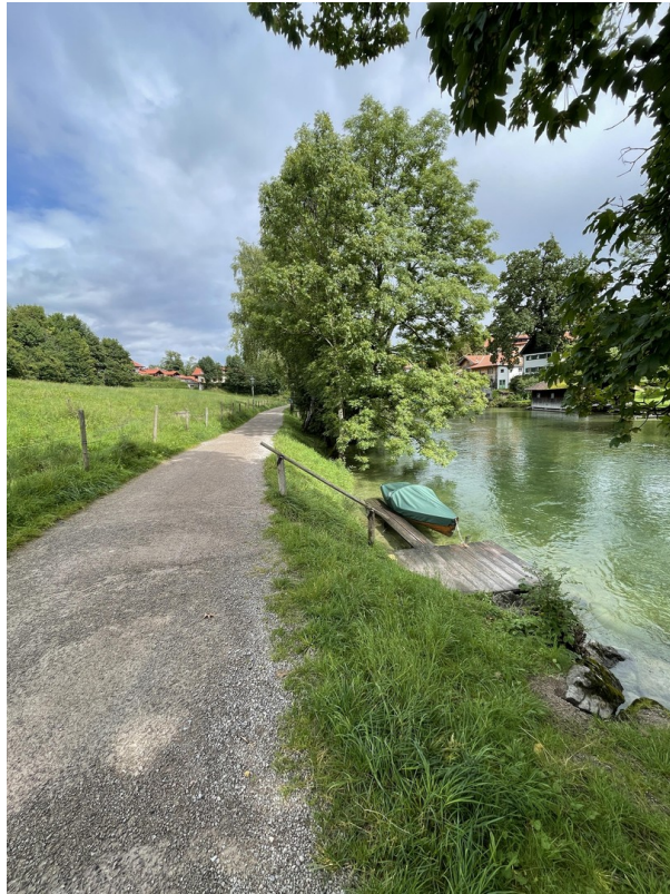
Weg Mangfall zur Wohnung