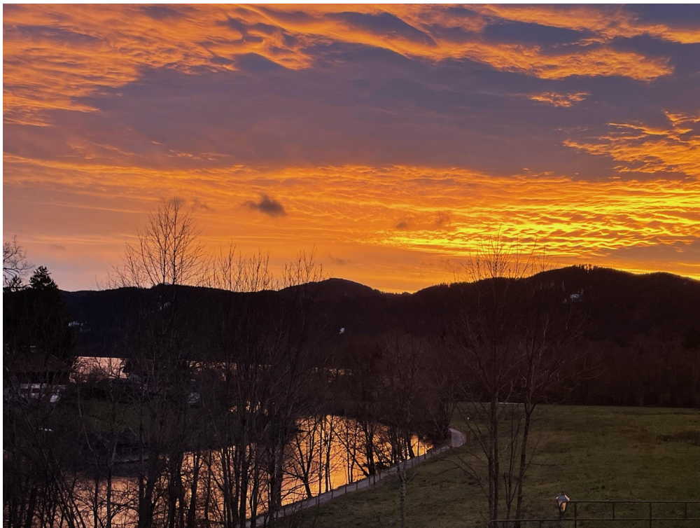
Süd/Westbalkon mit Seeblick