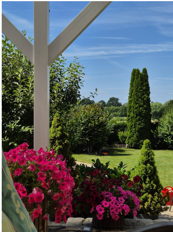
Blick Terrasse in den Garten