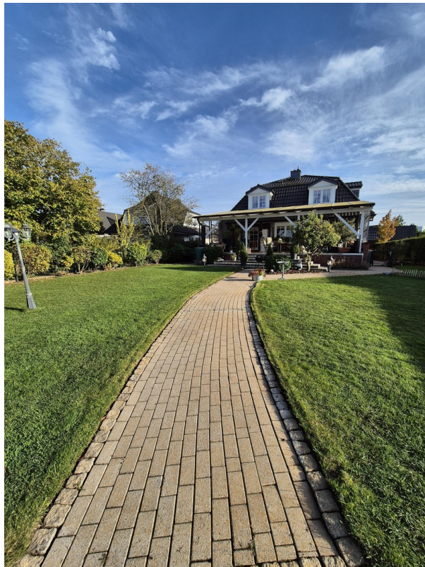
Blick auf die Terrasse