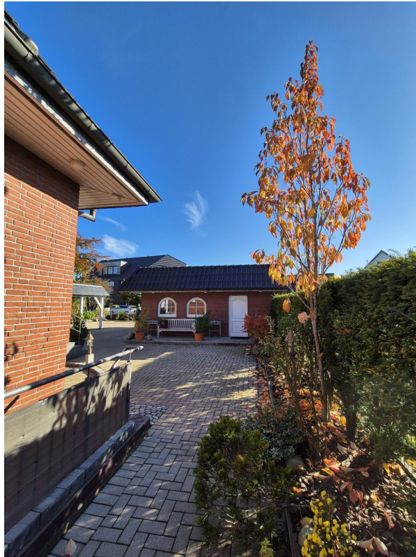
Blick auf die Doppelgarage