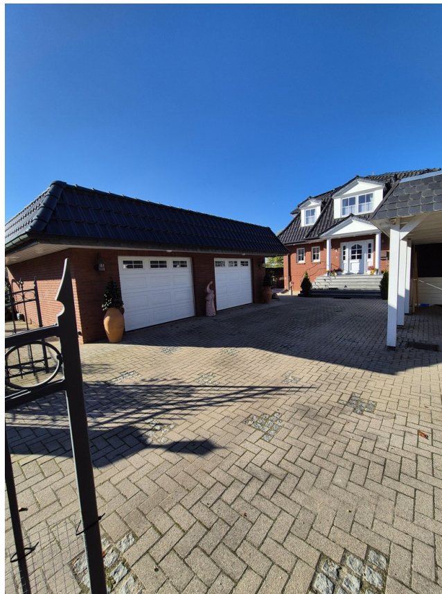
Blick auf die Doppelgarage