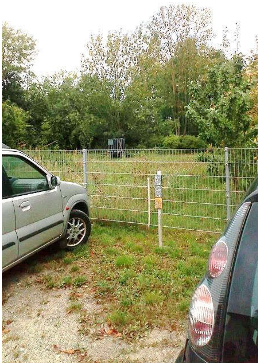
Bild 2_Zaun südl an Gadebuscher Str