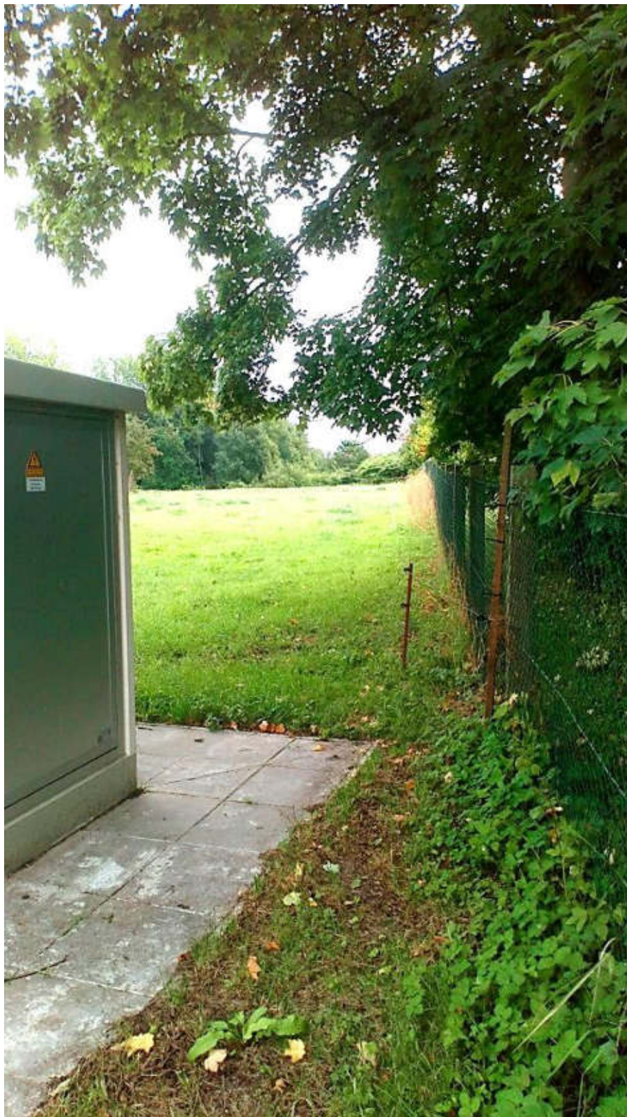
Bild 15_114_17-Trafo_Blick SO