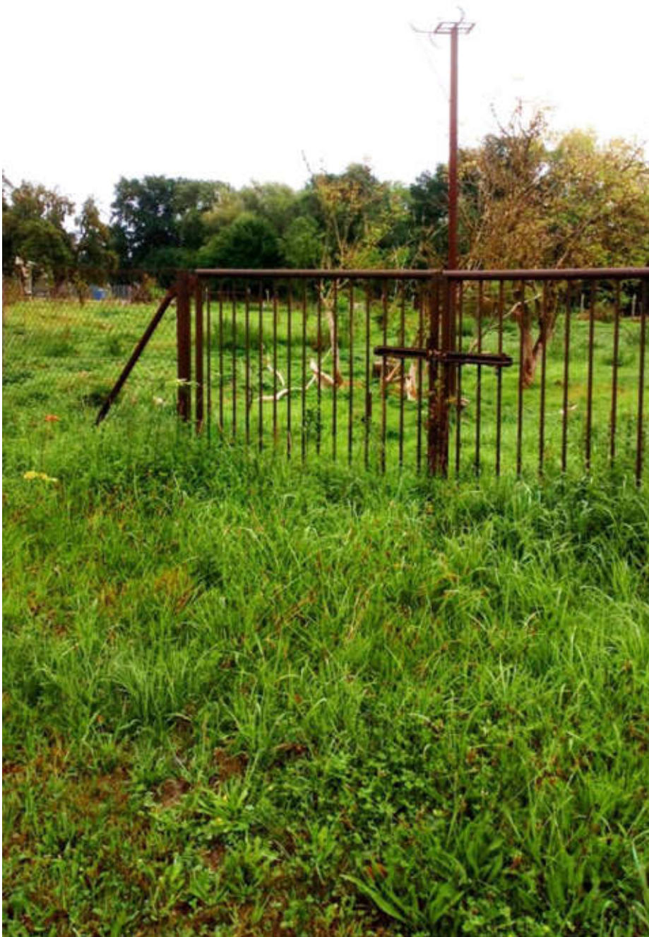
Bild 9_Tor_NW-Ecke 114_16