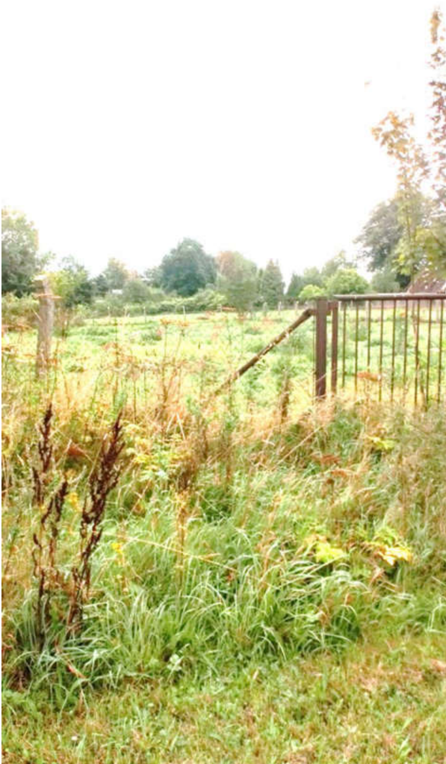
Bild 10_Tor-NW-Ecke 114_16